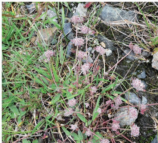
Abb. 5: Felsen-Klee ( Trifolium saxatile ).

Highlights der Tiroler Flora zählen. Sie stammen von außerhalb der drei ausgewiesenen Untersuchungsräume, aus dem Bereich Oberriss (UR 4 in Tabelle 8, Trifolium saxatile 47°5'56"N 11°11'50"E).