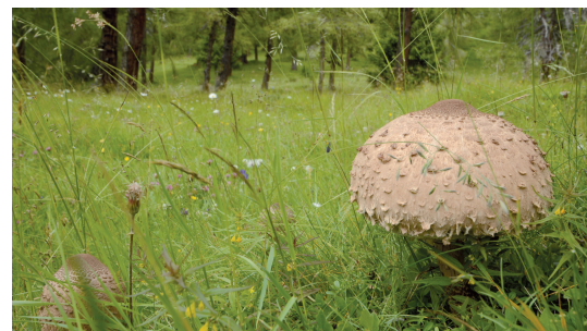
Abb. 4: Riesen-Schirmling ( Macrolepiota procera ) in den Eulenwiesen (UR 2).

licher, Einblick in die vorhandene Pilzvielfalt. Die vorliegende Artenliste verschafft also einen guten ersten Eindruck, mit vielen der häufigeren, standorttypischen und/oder auffälligen Arten. Zu den bemerkenswerten Funden zählen Gastrum minimum (leg. Pagitz & Lechner-Pagitz) mit bisher zwei Einträgen für Tirol und Spathularia neesii mit einem knappen Dutzend Fundorten in Österreich laut der Datenbank der Pilze Österreichs ( http://austria.mykodata.net/ ). Ebenso erwähnenswert als Indikatoren für nährstoffarme „Wiesen“ und immer wieder schön: drei Arten von Saftlingen.