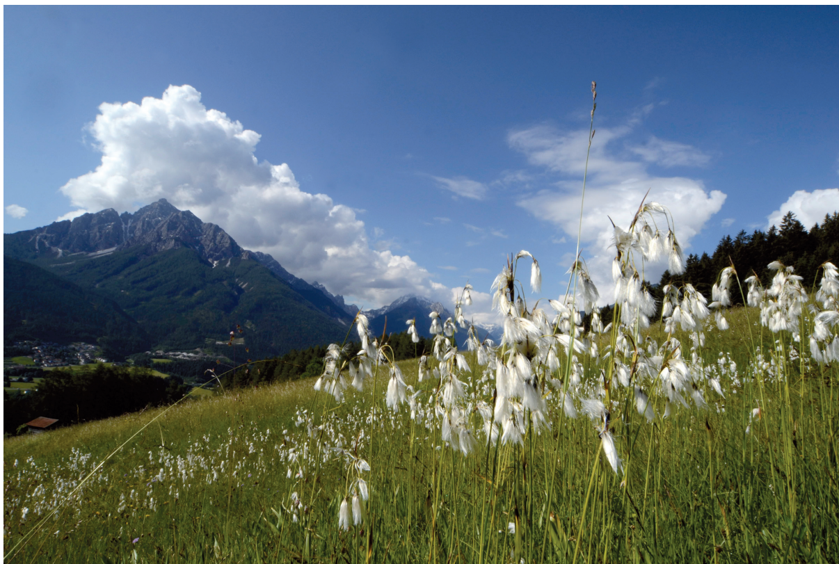
Abb. 1: Telfer Wiesen.