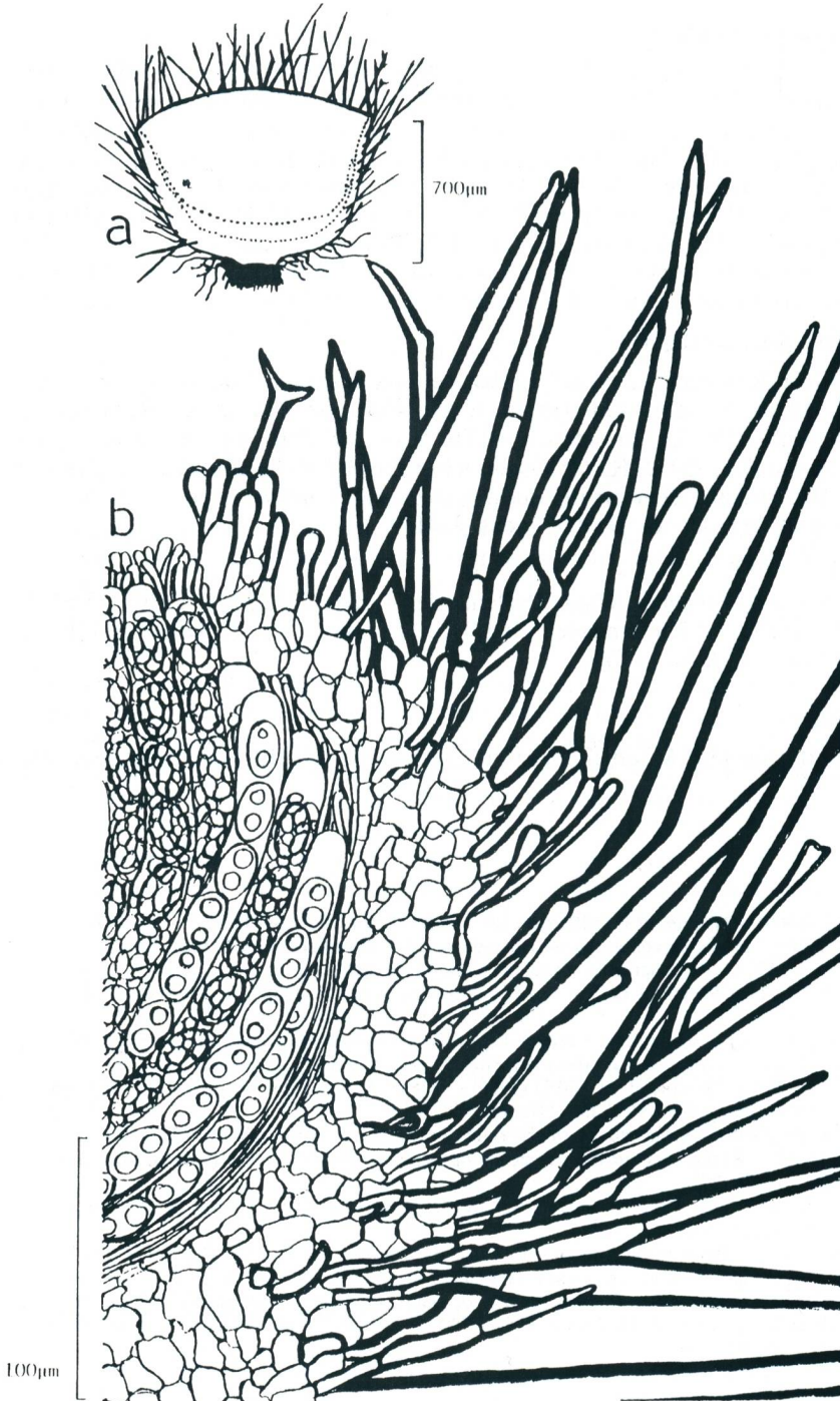
Fig. 1: T. paludosa var. tuberculata – Apothecienschnitt (schematisch; mit Basalfilz und angedeutetem Stielchen, Schichtung: Äuß. Excip., medullärer Teil, Hymen.) b – Randschnitt (Randseten: diverse Formen, septiert bis unseptiert, basale Verankerung im Äuß. Exc.; Tectura angularis des Äuß. Excip.; Paraphysen; Asci mit Ascussporen).