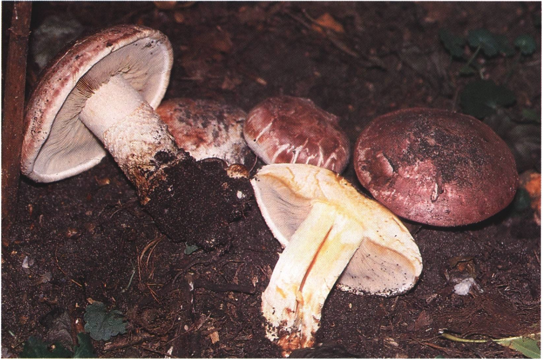
Agaricus geesterani nach Dia H. Bender