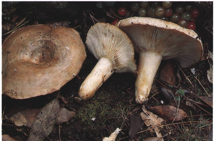
Lactarius ilicis nach Dia F. Bellù