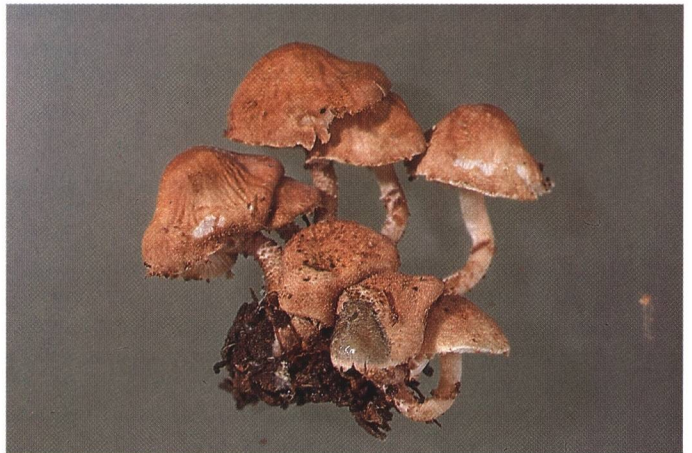
Cystoderma subvinaceum nach Dia A. Hausknecht (→ grüne KOH-Reaktion auf einem Hut!)