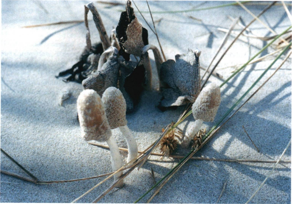
Abb. 2: Coprinus dunarum agg. in den Weißdünen der Insel Wangerooge.