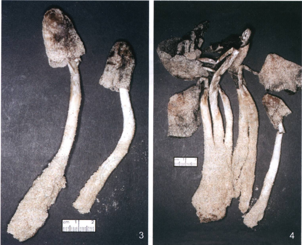
Abb. 3: Die zwei jüngeren Fruchtkörper (vgl. Abb. 2 vorne links) von Coprinus dunarum agg. – Abb. 4: Die älteren büscheligen Fruchtkörper (vgl. Abb. 2 hinten links) von Coprinus dunarum agg.

nerhalb des Herbariums Romell vorhanden ist. Dieser gut erhaltene Beleg ist mit Sicherheit als der eigentliche Typus-Beleg zur Stoll'schen Art Coprinus dunarum aufzufassen. Er wurde am 1. Juli 1926 auf der Wanderdüne am Riga-Strand von Stoll gesammelt. Das der Originalbeschreibung (STOLL 1929, 1930) beigelegte Aquarell und die zugehörigen Fotografien sind ebenfalls mit Juli 1926 datiert und mit einer übereinstimmenden Fundortsangabe versehen.