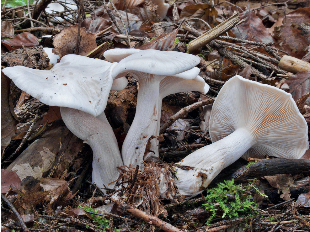
Abb. 4: Clitocybe nebularis var. alba