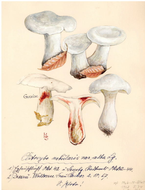
Abb. 3: Clitocybe nebularis var. alba Zeichnung: K. H. SAALMANN aus SAALMANN (1940-43)

Folgt man dieser Spur aber konsequent weiter, stellt man fest, dass es auch dafür eine Erklärung gibt, nämlich die, dass VELENOWSKÝ (1920) bei der Erwähnung von C. cerussata wahrscheinlich der Auffassung seines Zeitgenossen RICKEN folgte. RICKEN (1915, 1918), der wenige Jahre vor VELENOWSKÝS „Houby“ (1920) sein „Vademecum“ und davor seine „Blätterpilze“ herausbrachte, benutzte den Namen C. cerussata bekanntermaßen für helle Formen der Nebelkappe, C. nebularis (Batsch) P. Kumm. var. alba Bataille (Abb. 3 und 4). Dies wird deutlich durch die Angabe bei RICKEN (1918) „im Fichtenwald in großen Kreisen“; sowie durch die Tf. 99 Bild 3 in RICKEN (1915). Und C. nebularis wird dann auch tatsächlich so groß wie der von VELENOWSKÝ (1920) beschriebene Pilz. Da der Geruch von C. nebularis schwer zu beschreiben ist, wenn man das eigentlich alle möglichen Gerüche beinhaltende Wort „parfümiert“ beiseitelässt, wäre es also sehr naheliegend, dass Velenowskýs C. ornamentalis einfach eine C. nebularis var. alba ist.