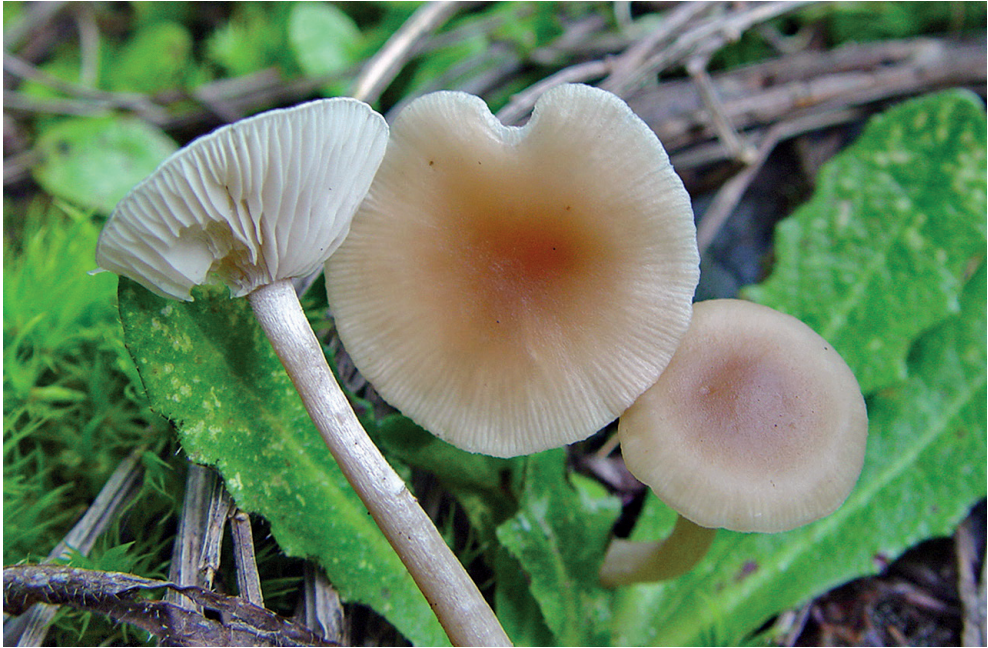
Abb. 2: Clitocybe fragrans

C. luffii wurde sowohl von SINGER (1943) als auch von MASSEE (1897) als eher zarter Pilz mit einem Stiel von nur 2 mm Dicke beschrieben. Der Pilz, für den Einhellinger seine Funde hielt, nämlich Clitocybe luffii , gilt gemeinhin als Synonym von C. fragrans (With.) P. Kummer (Abb. 3). Und es spricht alles dafür, dass auch EINHELLINGER (1969) den Namen in diesem Sinne anwandte.