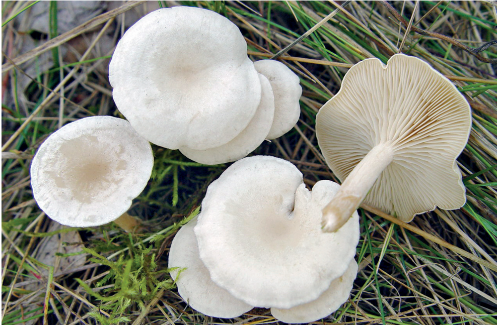
Abb. 1: Clitocybe albofragrans – Fund auf einer verbuschenden Wiese eines ehemaligen Hundesportplatzes in Biederitz (MTB 3836/1)