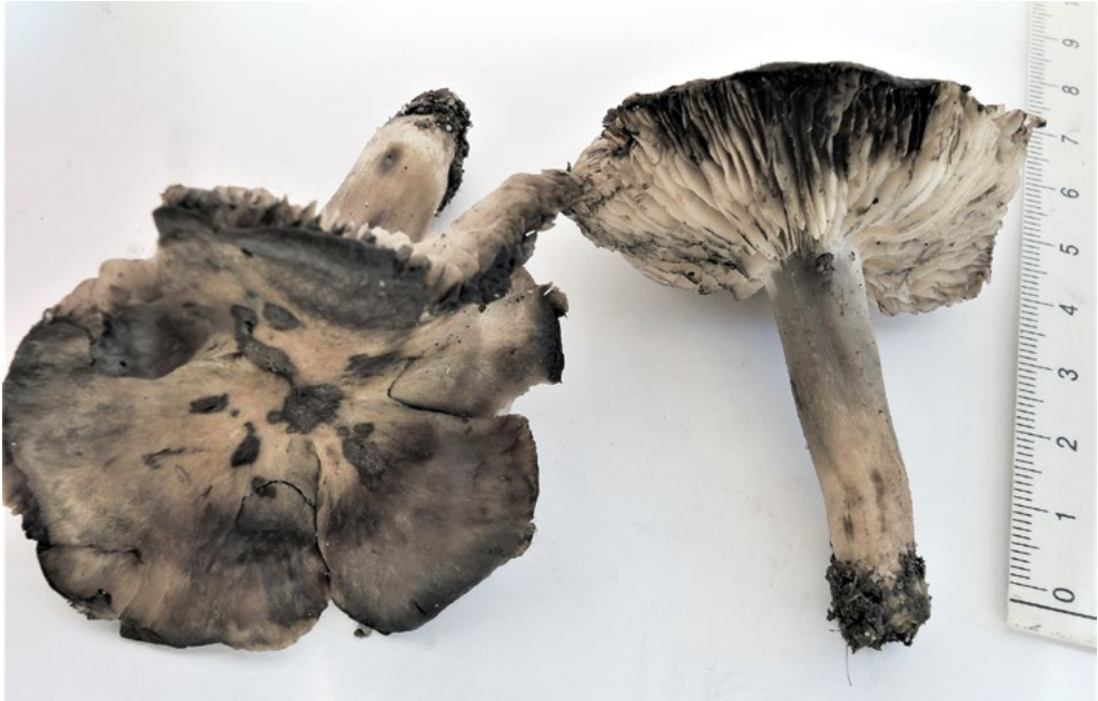
Abb. 6: Lehmfarbener Rasling ( Lyophyllum paelochroum ) aus dem Buchenmischwald im Botanischen Garten Frankfurt, ein Erstfund für Hessen.

Der Lehmfarbene Rasling ( Lyophyllum paelochroum ) ist ein Erstfund für Hessen (Abb. 6). In ganz Deutschland gibt es laut verschiedenen Datenquellen etwa 215 Nachweise in etwa 120 Quadranten, bevorzugt in collinen Lagen und auf lehmigen Böden (DGfM-DATENBANK 2018; GBIF.ORG 2018). In der Roten Liste (DÄMMRICH et al. 2016) ist der ohnehin schon seltene Pilz wegen leichten Rückgängen in den letzten Jahren mit „C“ (Gefährdung unbekanntes Ausmaßes) eingestuft.