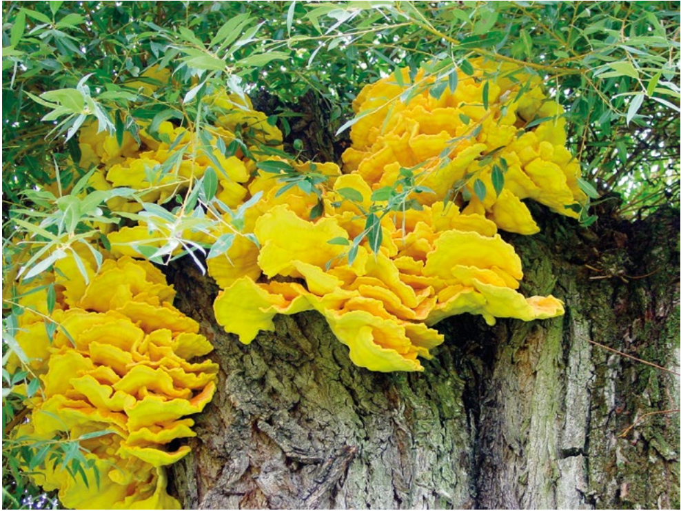
Abb. 3: Zahlreiche gelbe Fruchtkörper vom Schwefelporling ( Laetiporus sulphureus ) im oberen Stammbereich.