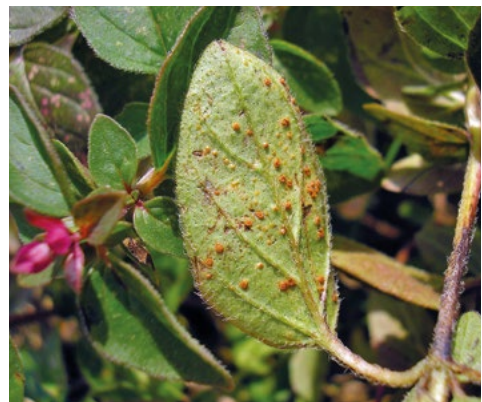
Abb. 13: Die zimtbraunen Uredien von Puccinia menthae auf der Unterseite von Origanum vulgare -Blättern.

Während Puccinia menthae im Botanischen Garten Frankfurt auf Echem Dost ( Origanum vulgare ) nachgewiesen werden konnte (Abb. 13), ist es bemerkenswert, dass weitere Nachweise für Hessen fehlen. Diese Pilz-Wirt-Kombination taucht in Deutschland sowohl in Wild- als auch in Kultur-Populationen von Origanum vulgare zerstreut auf (BRANDENBURGER 2005, BRAUN 1982).