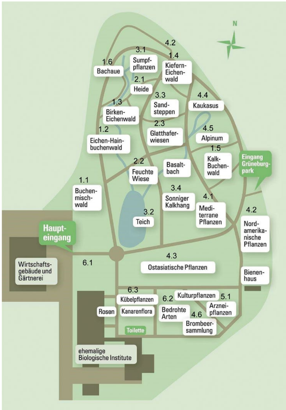
Abb. 1: Aktueller Lageplan der einzelnen Areale im Botanischen Garten Frankfurt (BOTANISCHER GARTEN FRANKFURT 2018 verändert von Lotz-Winter & Kruse, 2019).