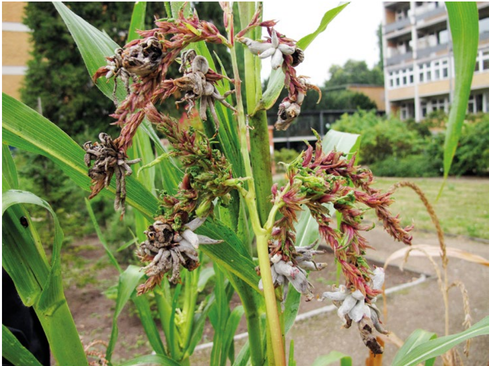
Abb. 4: Maisbeulenbrand ( Ustilago maydis ) auf Teosinte ( Zea mexicana )

Gaillardia aristata Pursh, cult., 5.1, 19.11.2013, T, Kruse J, H.KRU B0655 & 4.6, 11.7.2015, Piepenbring M und Fachberater, HLW MP 5248 – Entyloma picridis Rostr. auf Picris hieracioides L., 2.2, 8.5.2014 & 6.10.2015, T, Kruse J, H.KRU B0745 & B0974 (vgl. KRUSE et al. 2015) – Exobasidium japonicum Shirai. auf Rhododendron kiusianum Makino, cult., 4.3, 8.5.2014, T, Kruse J, H.KRU B0746 (LOTZ-WINTER et al. 2011: auf gleichem Wirt) – Macalpinomyces spermophorus (Berk. & M.A. Curtis) Vánky auf Eragrostis minor Host, 6.1, 6.10.2014, T, Kruse J – Microstroma album (Desm.) Sacc. auf Quercus robur L., 1.2, 21.11.2013, T, Kruse J – Rhamphospora nymphaeae D. D. Cunn. auf Nymphaea -Kultursippe, 3.2, 6.10.2014, Kruse J (LOTZ-WINTER et al. 2011: auf gleichem Wirt) – Urocystis eranthidis (Pass.) Ainsw. & Sampson auf Eranthis hyemalis (L.) Salisb., verwildert, 6.1, 14.3.2014, T, Kruse J, H.KRU B0666 – Ustilago maydis (DC.) Corda auf Zea mexicana (Schrad.) Kuntze, 6.6, 13.10.2012, T, Lotz-Winter H & Piepenbring M, HLW 3741 – Ustilago neocopinata J. Kruse & Thines auf Dactylis glomerata L. s. str., 2.2, 8.5.2014, T, Kruse J, H.KRU B0744 – Ustilago salweyi Berk. & Broome (vgl. KRUSE et al. 2018b bzgl. Nomenklatur) auf Holcus lanatus L., 2.2, 8.5.2014, T, Kruse J, H.KRU B0743