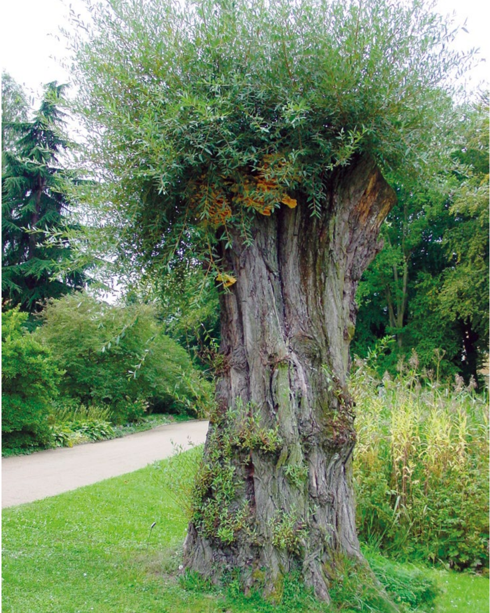
Abb. 2: Schwefelporling ( Laetiporus sulphureus ) auf der Dotterweide ( Salix alba var. vitellina ) am Teich im Botanischen Garten Frankfurt. Die 1950 gepflanzte Weide musste immer wieder zur Verkehrssicherung beschnitten werden und fiel 2012.

Thelephorales (3 Aufsammlungen/3 Arten): Thelephora anthocephala (Bull.) Fr. auf Totholz von Fagus sylvatica L., 1.1, 11.10.2014, Piepenbring M – Thelephora palmata (Scop.) Fr. in der Laubstreu, 1.1, 13.7.2007, Trampe T, HLW TT 284 – Thelephora terrestris Ehrh. auf Holzresten von Fagus sylvatica L., 1.1, 12.10.2013, Sandau H