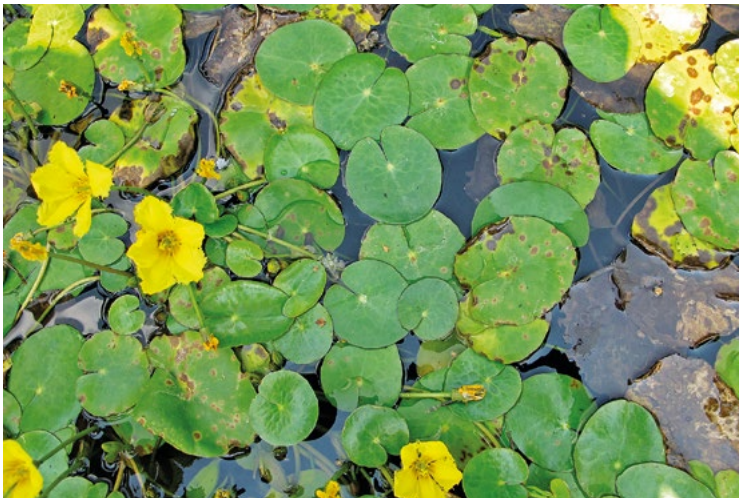
Abb. 14: Der selten berichtete asexuelle Pilz Septoria villarsiae parasitiert auf Blättern der Seekanne ( Nymphoides peltata ) und verursacht charakteristische braune Blattflecken.

Eine ziemlich selten berichtete Art ist Septoria villarsiae (Abb. 14). Der Pilz parasitiert auf Blättern der Seekanne ( Nymphoides peltata ), die zu den Fiebertree-Gewächsen gehört, und stehende Gewässer sowie seeähnliche Altwasser von Flüssen besiedelt. In der Literatur gibt es Hinweise (FARR & ROSSMANN 2018), dass auch andere nah verwandte Menyanthaceae befallen werden. Der in dieser Arbeit gelistete Fund der Zweitautorin aus 2013 ist der einzige neue Nachweis für Hessen in „Pilze Deutschlands“ (DGfM-DATENBANK 2018), ein dort nicht gelisteter Nachweis vor 1864 aus Hatzenheim im Rheingau stammt von FÜCKEL (1864). Etwa zeitgleich mit dem Fund von FÜCKEL gibt es einen Fundort im Jahre 1894 in Straubing in den Donauauen (GBIF.ORG 2018), drei Funde in Berlin (nach DIEDICKE 1912-15), sowie 1957 aus Hamburg (GBIF.ORG 2018). Der zweite Nachweis in Pilze Deutschlands (DGfM-DATENBANK 2018) in neuerer Zeit stammt von der Erstautorin (Rheine, Nordrhein-Westfalen, 2017). Zwei weitere Funde werden aus Sachsen-Anhalt (JAGE 2016) bzw. aus Brandenburg berichtet (KUMMER 2009). In anderen europäischen Ländern (Belgien, Großbritannien, Niederlande, Österreich, und Rumänien) ist Septoria villarsiae bei GBIF.ORG (2018) mit 9 Fundorten gelistet. Etliche dieser Fundorte liegen in botanischen Gärten bzw. Parks. In Polen wurde der Pilz im botanischen Garten von Krakau gefunden (WOŁCZAŃSKA 2010). In dieser Arbeit wird von einem weiteren Fund in Polen aus dem Jahr 1926 in einer Parkanlage berichtet.