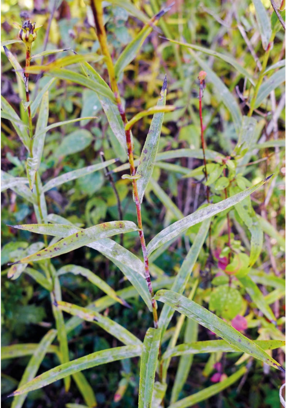
Abb. 10: Weißes Myzel von Golovinomyces inulae auf der Oberseite von Inula ensifolia -Blättern.