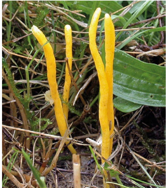
Abb. 5: Die Goldgelbe Wiesenkeule ( Clavulinopsis helvola ).

Im Zeitraum August 2010 bis Dezember 2018 wurden drei Großpilzarten registriert, die in der aktuellen Roten Liste der Großpilze als gefährdet gekennzeichnet sind (DÄMMRICH et al. 2016). Zu den in ganz Deutschland wegen Standortverlust und Eutrophierung bedrohten Wiesenpilzen der CHEG-Gruppe (Clavariaceae- Hygrocybe-Entoloma -Geoglossaceae) gehört die Goldgelbe Wiesenkeule Clavulinopsis helvola (Abb. 5). Mit der Rote-Liste-Kategorie „3“ gilt sie als gefährdet. Auch wenn die Art noch als „mäßig häufig“ eingestuft wird, wurden starke Rückgänge festgestellt, die dem Verlust von Offenland-Biotopen geschuldet sind.