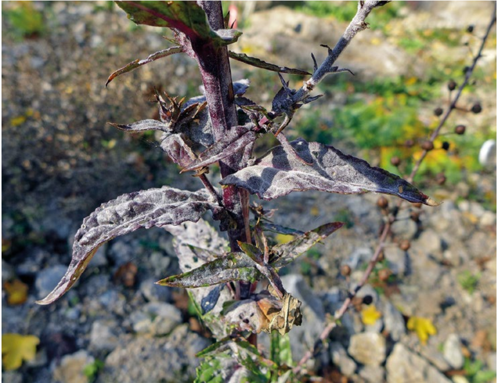
Abb. 11: Dichtes Myzel von Golovinomyces verbasci an den Blättern, Stängeln und Kelchen von Verbascum blattaria -Pflanzen.

Neu für Hessen ist das Auftreten von Golovinomyces verbasci auf der Schaben-Königskerze ( Verbascum blattaria , Abb. 11). Bisher war diese Kombination nur aus Thüringen und Nordrhein-Westfalen bekannt (BRANDENBURGER & HAGEDORN 2006). Ansonsten kommt dieser Echte Mehлтаupilz vor allem auf der Schwarzen Königskerze ( Verbascum nigrum ) oder der Kleinblütigen Königskerze ( Verbascum thapsus ) verbreitet in Deutschland vor.