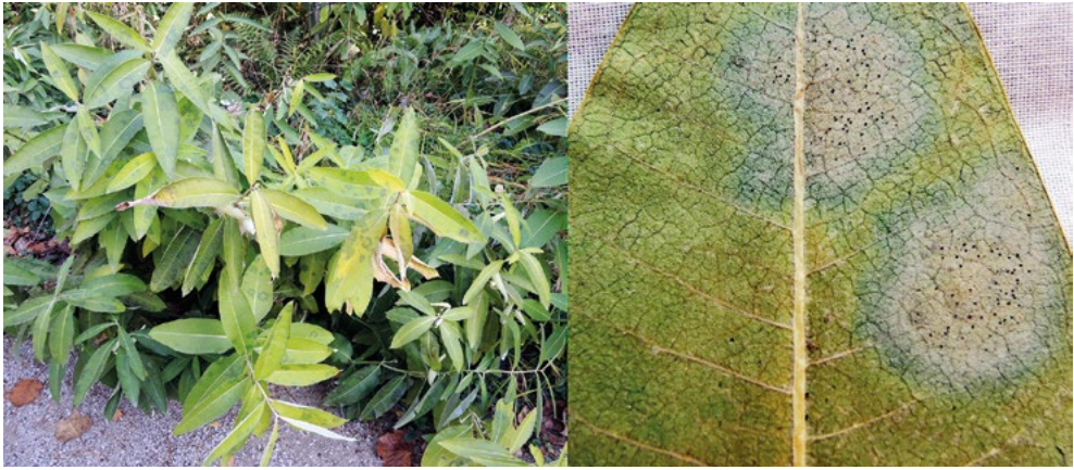
Abb. 8: Phyllactinia fraxini auf Asclepias syriaca , ein Erstnachweis für diese Pilz-Wirt-Kombination in Deutschland. li. Habitus der befallenen Wirtspflanzen, re. kreisrunde Myzelflecken mit gut sichtbaren Fruchtkörpern (Chasmothecien) auf der Unterseite eines Blattes.

Befall ist auf der Blattoberseite ein weißliches Myzel mit zahlreichen darin befindlichen kleinen und dunklen Fruchtkörpern ausgebildet (Abb. 9).