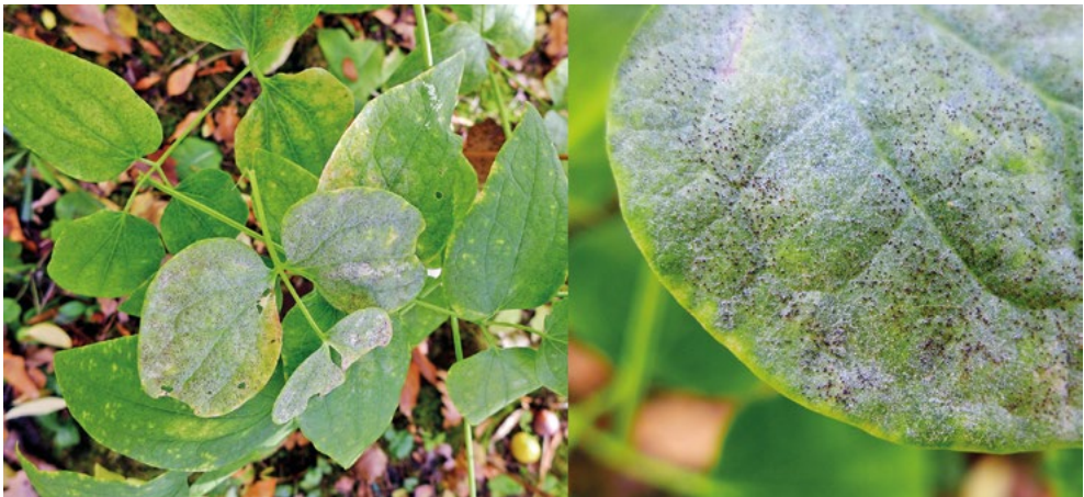
Abb. 9: Weißliches Myzel und zahlreiche kleine dunkle Fruchtkörper von Erysiphe aquilegiae var. ranuoculi auf der Oberseite von Clematis recta -Blättern. li: Habitus, re: Detail der Fruchtkörper.