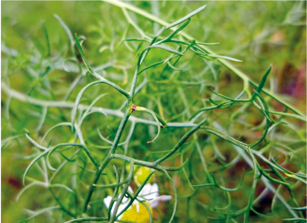
Abb. 12: Die braunen Puccinia matricariae -Uredien an den filigranen Chamomilla recutita -Blättern.

Ausgesprochen selten in Deutschland ist Puccinia matricariae auf der Echten Kamille ( Chamomilla recutita ). Dieser Rostpilz bildet braune Uredien (Abb. 12) und schwarzbraune Telien auf beiden Blattseiten aus und ist mit seinem Vorkommen auf diese Wirtspflanze beschränkt. Aus Deutschland liegen bisher nur wenige Nachweise vor (BRANDENBURGER 2005, BRAUN 1982), für Hessen ist dieser Pilz neu.