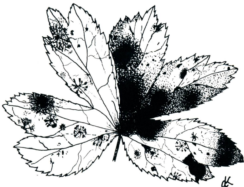
Abb. 1: Astrantia major L. Blatt mit Flecken (normale Grösse).

Während eines kurzen Aufenthaltes im Berchtesgadener Land im Monat September 1967 wurde meine Aufmerksamkeit auf eine seuchenartig auftretende Blattkrankheit der Großen Sterndolde ( Astrantia major L.) gelenkt. Diese Krankheit war dort so allgemein verbreitet, daß es kaum eine Pflanze gab, die nicht befallen worden war. Um die Natur dieser typischen Krankheit kennenzulernen, wurde eine Anzahl Blätter mit charakteristischen Flecken auf meinen Wanderungen bei Maria Gern, Ettenberg, Marktschellenberg, Ramsau und Untersberg für weitere Studien gesammelt.