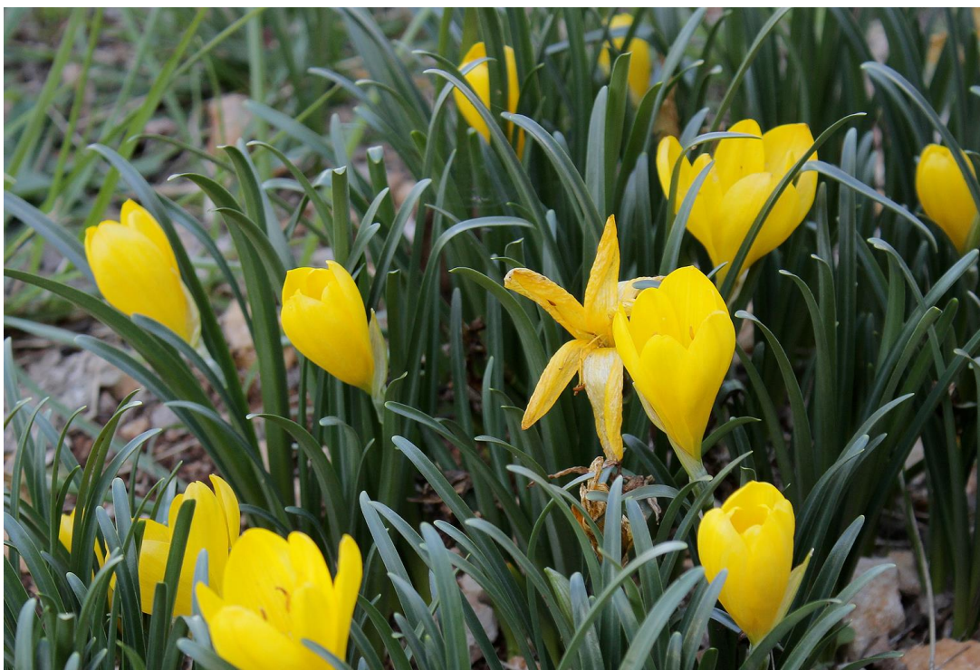
Abb. 6: Sternbergia lutea subsp. lutea ; Erstfund für die Insel Krk; Foto: Hildegard KÖNIGHOFER; confirm. Michael MÜNCH.