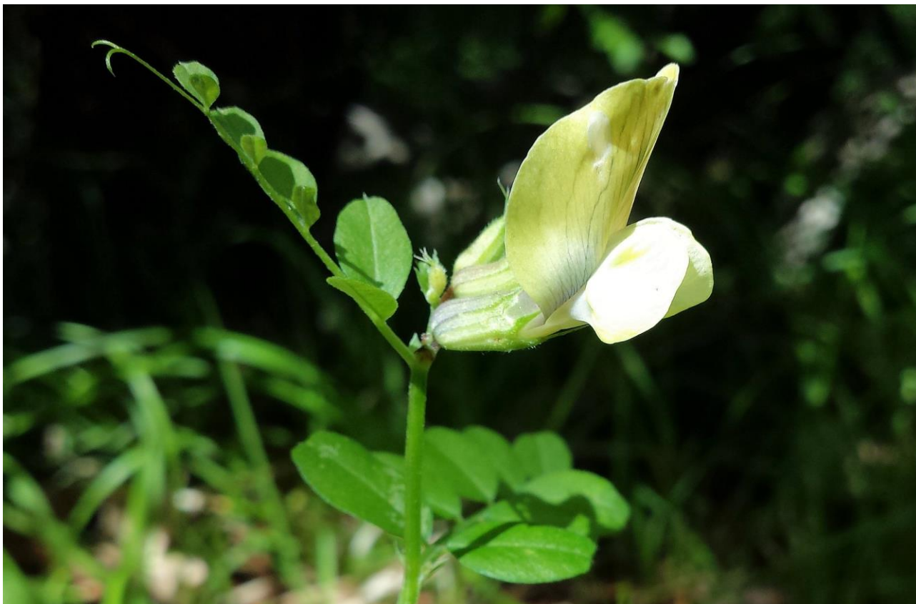
Abb. 11: Vicia grandiflora subsp. grandiflora var. grandiflora ; Erstfund für die Insel Krk; Foto: Stefan LEFNAER; det. Walter K. ROTTENSTEINER.