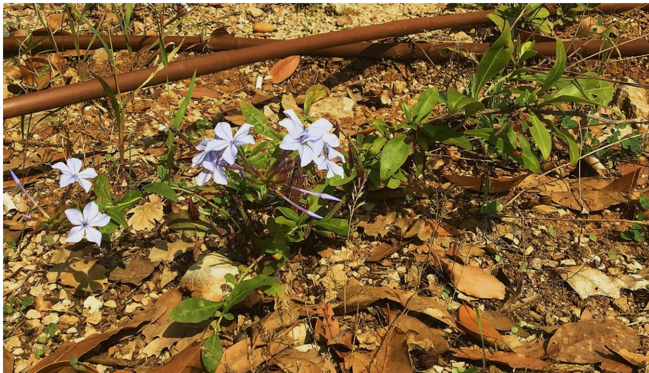
Abb. 18: Plumbago auriculata ; Erstfund für die Insel Krk, Istrien und Kroatien; Foto: Marica ROTTENSTEINER; confirm. Matthias ERBEN.