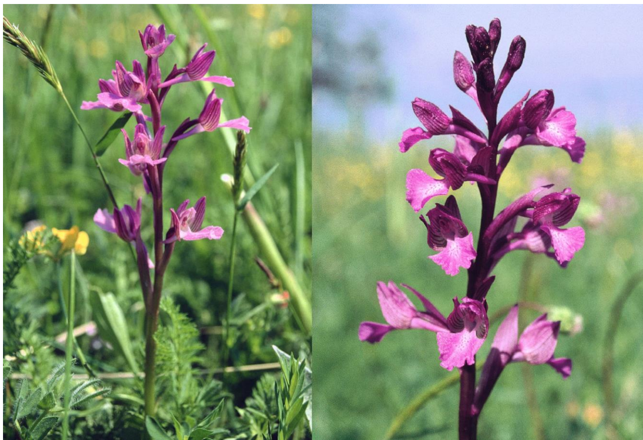
Abb. 13: Anacamptis × gennarii ( A. morio × A. papilionacea); Erstfund für die Insel Krk: W Malinska/Maliscal/Durischal, Porat/Porto; 23.04.2000