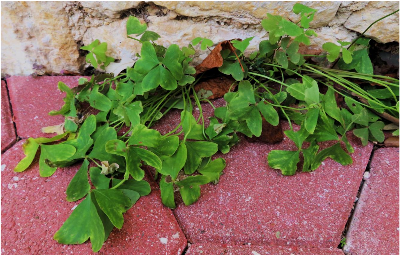
Abb. 17: Oxalis latifolia ; Erstfund für die Insel Krk; det. Walter K. ROTTENSTEINER.

Oxalis latifolia HUMB., BONPL. & KUNTH (Abb. 17) !!Neu für die Insel Krk/Veglia/Vöglis!!; selten kultiviert und verwildert. Dieser Erstfund wurde am 31.12.2019 westlich von Punat/Ponte/Sankt Maria auf der otočić Košljun/scoglio Cassione/Klosterinsel direkt beim Franziskanerkloster gemacht: N 45°01'35,88", E 14°37'04,04", 2 m alt.; Pflasterritze.