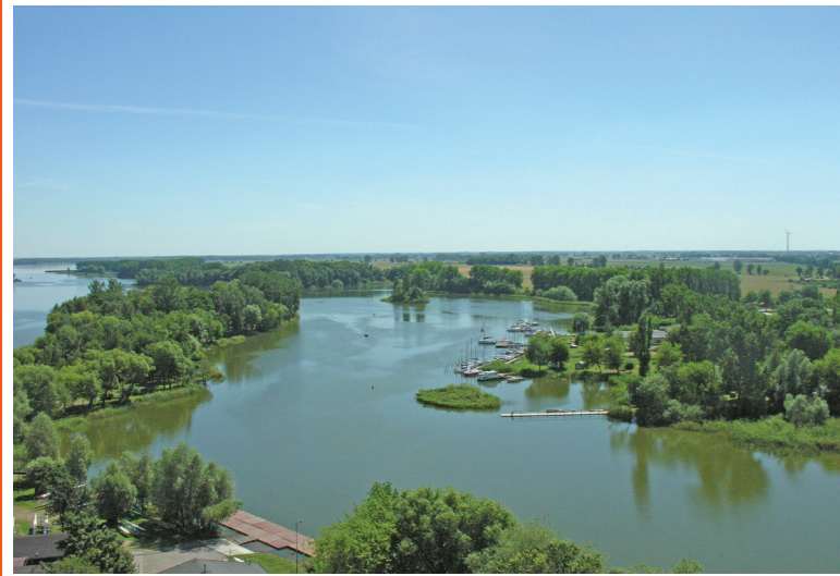
Panorama Gopla