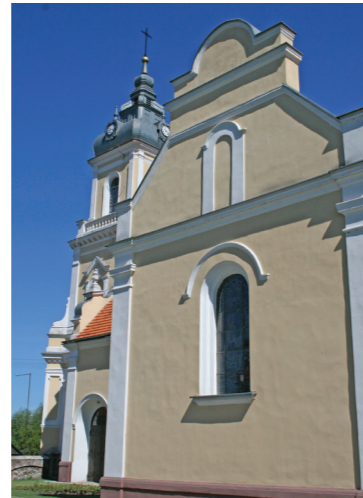
Kościół Matki Boskiej Bolesnej i św. Józefa w Skulsku