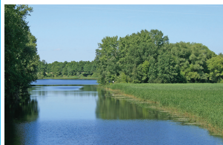
Kanał Warta-Gopło w rejonie Mielnicy Dużej

Przez teren Nadgopla przebiegają szlaki piesze, rowerowe i wodne. Dla potrzeb turystyki edukacyjnej zaprojektowano system ścieżek edukacyjnych, dotychczas nieoznakowanych w terenie. Najdłuższą z nich jest ścieżka Mare Polonorum o charakterze przyrodniczo-historycznym. Na trasie południowej odnogi tej ścieżki w granicach województwa wielkopolskiego znalazły się przystanki dydaktyczne zlokalizowane nad Jeziorem Gopło oraz jeziorami Skulskim i Skulska Wieś. Rowerzyści nad Gopło mogą dotrzeć, wykorzystując Bursztynowy Szlak Rowerowy, który stanowi część Wielkopolskiego Systemu Szlaków Rowerowych. Na miejscu rowery można wypożyczyć w Skulsku. Na wielbicieli kajaków czekają szlak wodny przez Gopło oraz kanał Warta – Gopło, łączący Wartę i Noteć, stanowiący fragment największego szlaku wodnego regionu – Wielkiej Pięty Wielkopolski. Na terenie Wielkopolski amatorzy kąpieli mogą skorzystać z ośrodków wypoczynkowych w Skulsku (nad jeziorem Skulska Wieś) i Mielnicy Dużej (nad Gopłem), gdzie znajdują się plaże i działają wypożyczalnie sprzętu wodnego. Bazę noclegową tworzą gospodarstwa agroturystyczne, domki letniskowe oraz hotel w Lisewie.