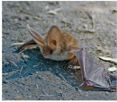
Gacek brunatny