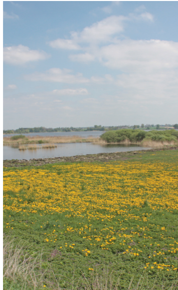
Łąki nad Gopłem