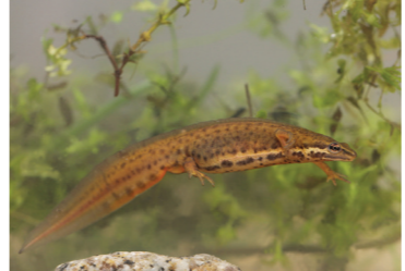
Rzaska zwyczajna