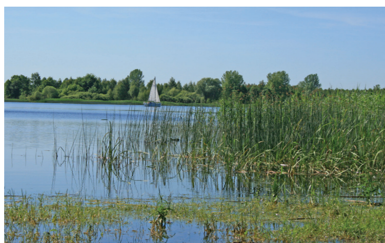
Turystyka wodna