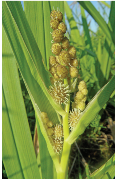
Jezogłówka galgosiasta

Na pastwiskach i łąkach parku spotyka się stanowiska roślin słonolubnych, w tym rzadkiej świbki morskiej i chronionego mlecznika nadmorskiego. Piaszczyste miejsca porośnięte są zbiorowiskami psammofilnymi