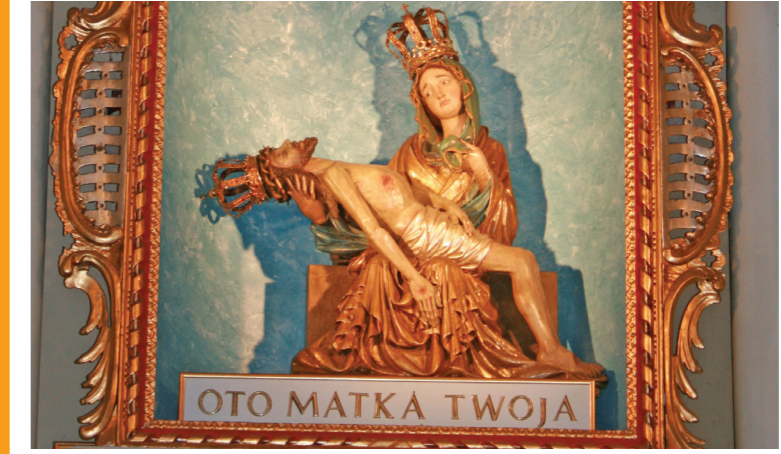
Laskani świąteczna Figura Matki Boskiej Bolesnej ze Skulsku

Osadnictwo nad Gopłem rozwijało się już od epoki neolitu, kiedy były to jedne z najbardziej intensywnie zasiedlonych ziem polskich. Okolice Gopla to kolebka dynastii Piastów i źródło związanych z nimi legend. Według jednej z nich w Warzymowie i południowej niedaleko Gopla urodził się Piast Kołodziej i jego żona Rzepicha – protoplaści rodu Piastów. Najwcześniejsze wzmianki o miejscowościach nadgoplańskich pochodzą z późnego średniowiecza, a zdecydowana ich większość w dokumentach jest wymieniana już w XVII wieku. Większość wsi leżących na terenie parku ma charakter rolniczy, a w przeszłości folwarczny. Na ich tle wyróżniają się Luszczero, wzmiankowane po raz pierwszy w 1399 roku jako osada rolniczo-rybacka. W Nadgoplańskim Parku Tysiąclecia i jego otoczeniu znajdują się interesujące zabytki architektury sakralnej. Pierwszoplanową wartość ma kościół z 1810 roku pw. Matki Boskiej Bolesnej i św. Józefa w Skulsku – miejscowości już od XVI wieku znanej jako miejsce kultu Matki Boskiej Bolesnej. Obecnie w Skulsku znajdują się także XX-wieczna kalwaria. Warto