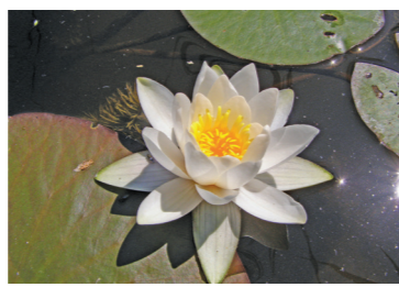
Grzybnie białe