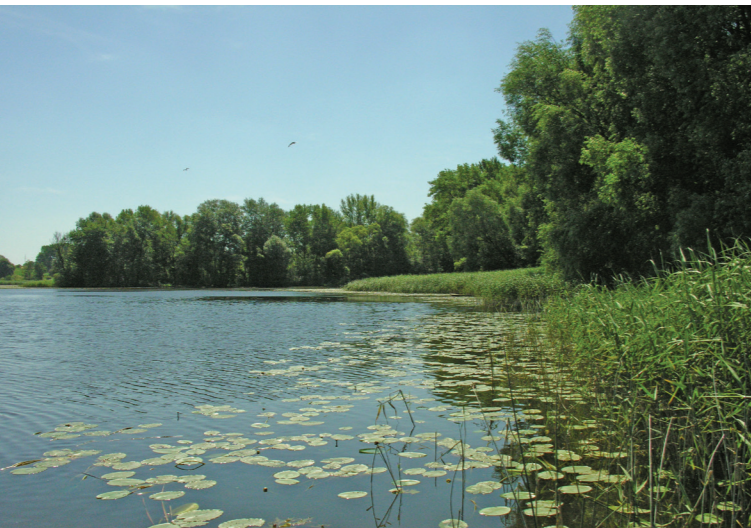
Pis przybrzeżny Gopla

wypowały pasy rozległych szuwarów. W licznych rynnach, a także w śródpolnych obniżeniach terenu zachowały się mokradła, często o charakterze torfowisk niskich. Na pozostałym obszarze od setek lat dominuje użytkowanie rolnicze. Największym obszarem zwartej zabudowy na terenie parku jest Skulsk – siedziba władz gminnych. W pobliskich wioskach spotykana jest rozproszona zabudowa zagrodowa oraz stosunkowo liczne obiekty rekreacyjne. Tereny Nadgopla położone w województwie kujawsko-pomorskim objęto ochroną w postaci siostrzanego odrębnego parku krajobrazowego (z własnymi władzami i służbami), również nazwanego Nadgoplańskim Parkiem Tysiąclecia.