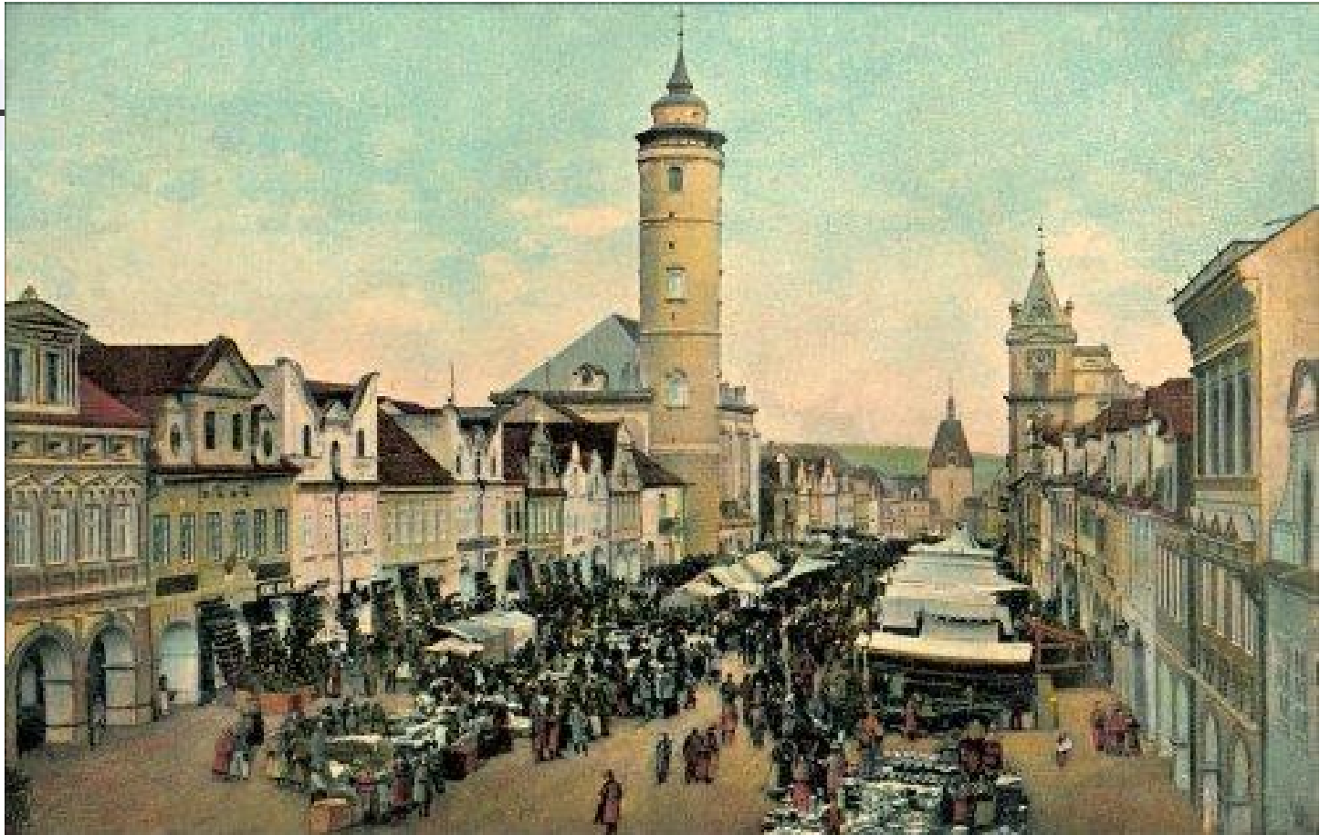
Město - středisko obchodu a řemesel