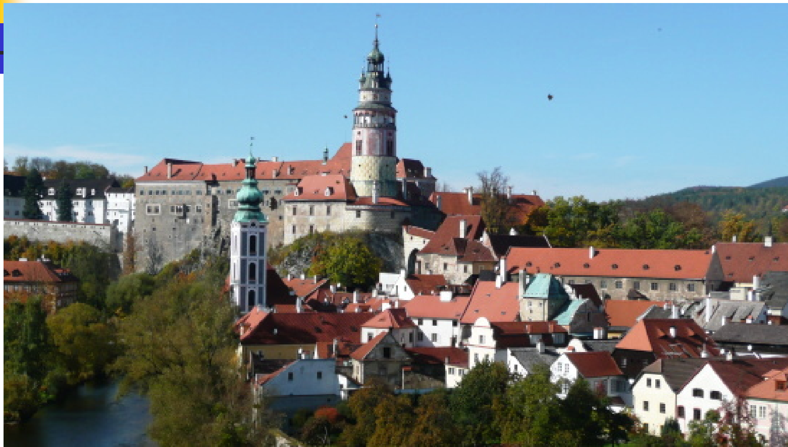
Středověké poddanské město – Český Krumlov