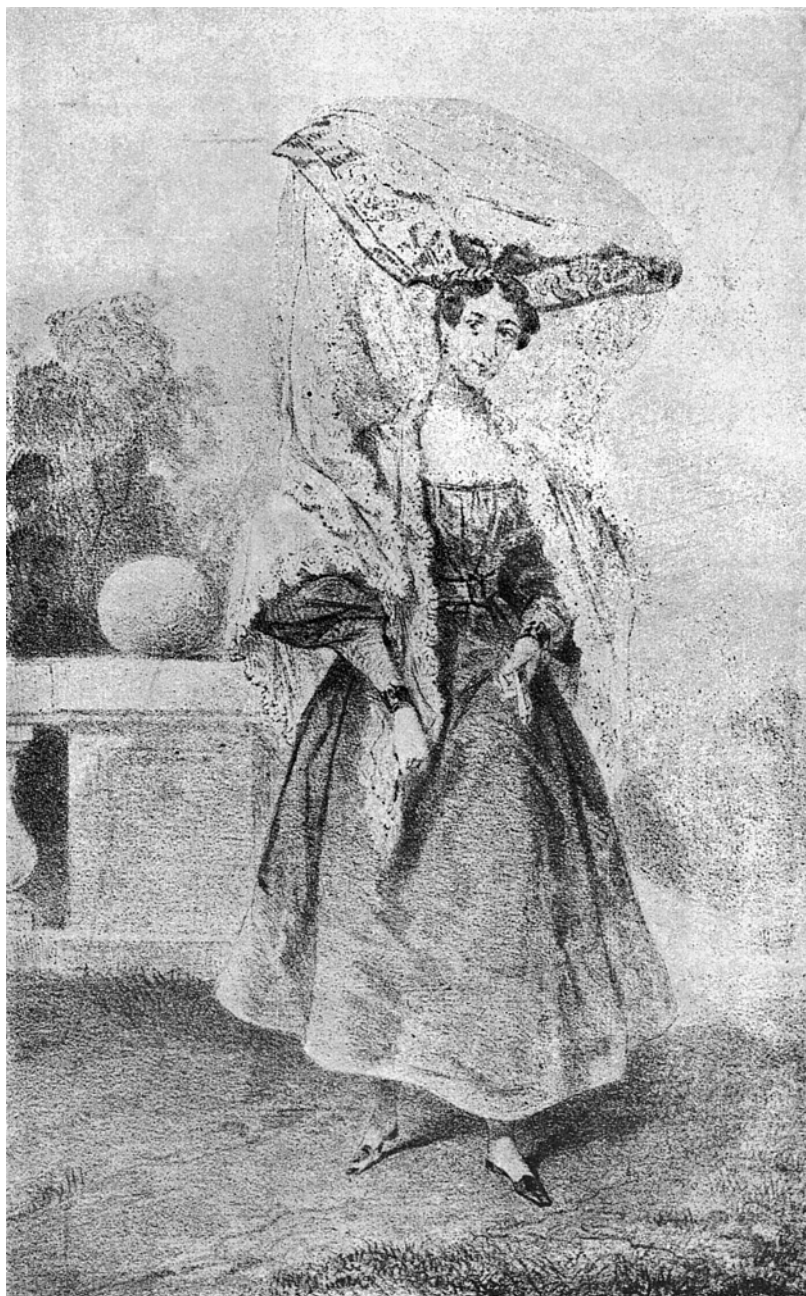
Portenha – Traje de passeio