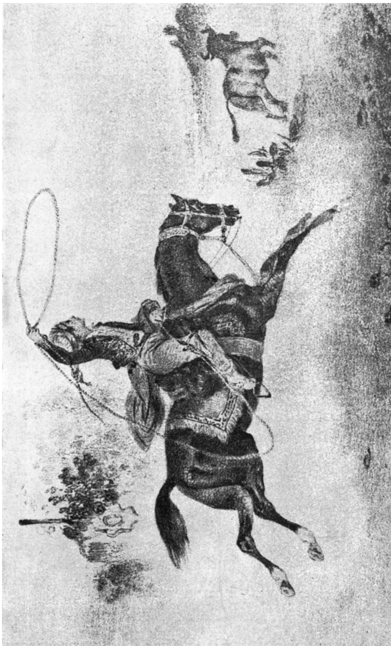
Gaucho laçando um touro