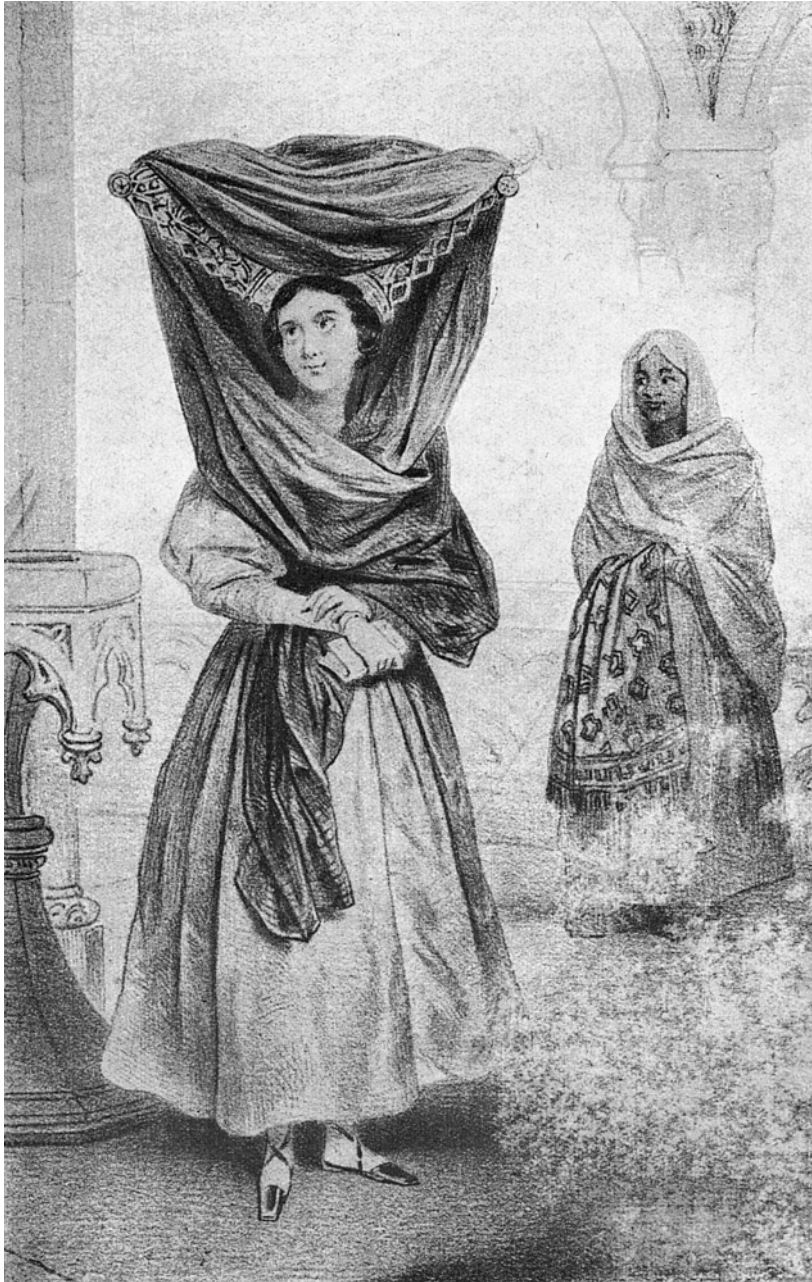
Portenha – Traje de ir à igreja