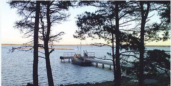
Båt vid brygga.

Vänerns stränder och skårgårdar är landets största sötvattenarkipelag.