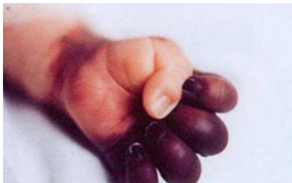
Fig 2: imagen de una mano con un proceso vaso-oclusivo

Los enfermos, en su mayoría de raza negra con rasgos negroides, generalmente son altos, delgados, con cráneo en torre y articulaciones hiperextensibles, su crecimiento y maduración sexual están generalmente retardados. Al examinarlos se aprecia ictericia conjuntival y no es raro que este dato desoriente al médico no familiarizado con esta enfermedad y establezca el diagnóstico clínico de hepatitis. Los enfermos sufren úlceras maleolares o cicatrices de úlceras antiguas. En el fondo de ojo, los vasos retinianos se encuentran tortuosos o en tirabuzón.