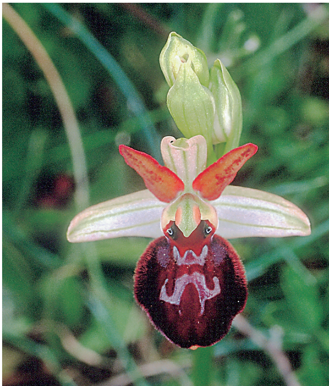
Fig. 4/Sl. 4: Ophrys majellensis .

Tra le varie famiglie assumono una grande importanza le Orchidaceae in quanto rare, di estrema bellezza ed indicatrici di un'elevata qualità dell'ambiente. Nell'elenco floristico sono riportate 56 entità, un numero apparentemente non rilevante, ma che in realtà costituisce il 66 % del patrimonio orchidologico abruzzese e