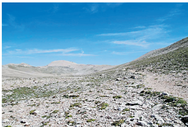
Fig.1: Valle di Femmina Morta. Sl. 1: Dolina Femmina Morta.

Il centro abitato è situato ad una altitudine di 767 m. s. l. m. mentre il suo territorio copre una superficie di 91.61 Km 2 e si estende lungo l'asse NO-SE, dalla valle del Fiume Aventino, sino alle alture che circondano la Valle di Femmina Morta, morena di origine glaciale (Fig. 1), sita sul massiccio della Majella, dove in alcuni periodi dell'anno è presente un omonimo laghetto effimero, che si forma con lo scioglimento delle nevi.