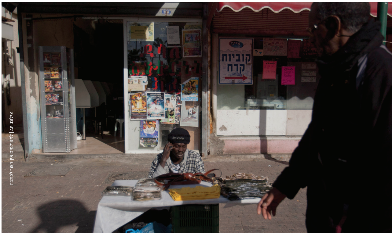
למצלומים אין קשר למכתבה