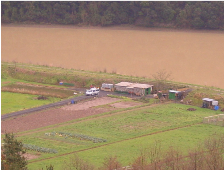
1. Argazkia: Baratzeak eta Urolaren itsasadarra bereizten dituen Basadizarreko barraderaren ikuspegia

Zumaiako Udalaren asmoa herritarrek parte-hartzera bultzatzea da, bereziki haurrak eta baratzeen jabeak/erabiltzaileak. Lehenengoei dagokienez, landaresia elkarrekin landatzea da asmoa, auzolan jardunaldi baten bitartez; bigarrenegi dagokienez, udala borondatezko hitzarmenak lortzen saiatuko da lursailen jabeekin. Lursail horiek Itsaso eta Lehorren arteko Jabari Publikoarekin mugan daude.