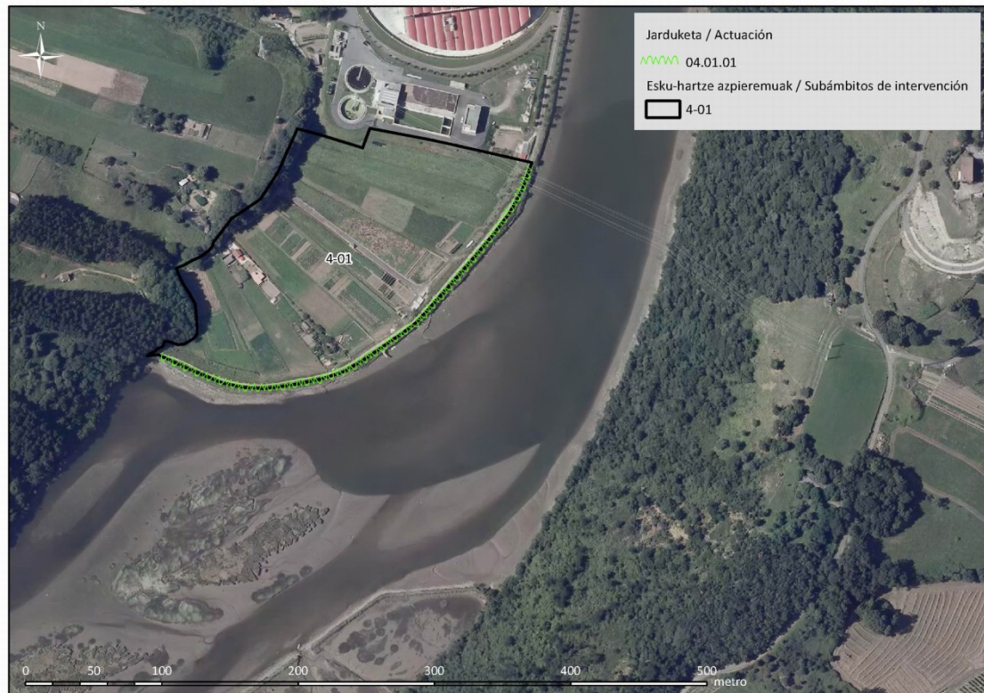
2. Irudia: Zuhaikez osatutako hesiaren kokalekua Basadizarreko barraderan zehar

Hori dela eta, Plan Bereziak proposatzen duen neurrietako baten helburua erabilera antropikoek eremu horretan izan dezaketen eragina gutxitzea da. Erabilera antropiko horiek gehienbat itsasadarraren ezker aldeko ertzean gauzatu ohi dira eta bereziki aipagarriak dira Basadizarreko barraderan zehar gauzatzen diren aisialdiko erabilerak. Ondorioz, barraderan zuhaixkez osatutako hesi bat sortzea proposatzen da, neurri batean, soinuari dagokionez zein fisikoki muga bat izan dadin eta, bide batez, elementu artifizial horren naturalizazioari mesede egin diezaion.