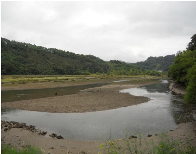
2. Argazkia: Usurbiribillagako paduraren eta uharten ikuspegia hegaztien behatokia eraikitzea proposatzen den gunetik.

Gauzak horrela, Basadizarreko ibarrararen hego-mendebaldeko muturrean hegaztien behatoki bat eraikitzea proposatzen da, Basadizarren mendebaldeko ertzetik igarotzen den bide publikotik gertu, hain zuzen. Hori dela eta, egungo barraderatik sarbide bat ez litzateke beharrezkoa izango hura kenduko balitz. Kokaleku horrek aukera bikaina eskaintzen du bertan hegaztien behatoki bat eraikitzeko balio urriko instalazioak jarritz. Era berean, behatokiaren ondoan informazio-panelak eta hegazti -fauna espezieak identifikatzeko gakoak jartzea proposatzen da.