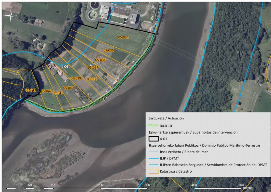
3. Irudia: : Ukitutako lursailak