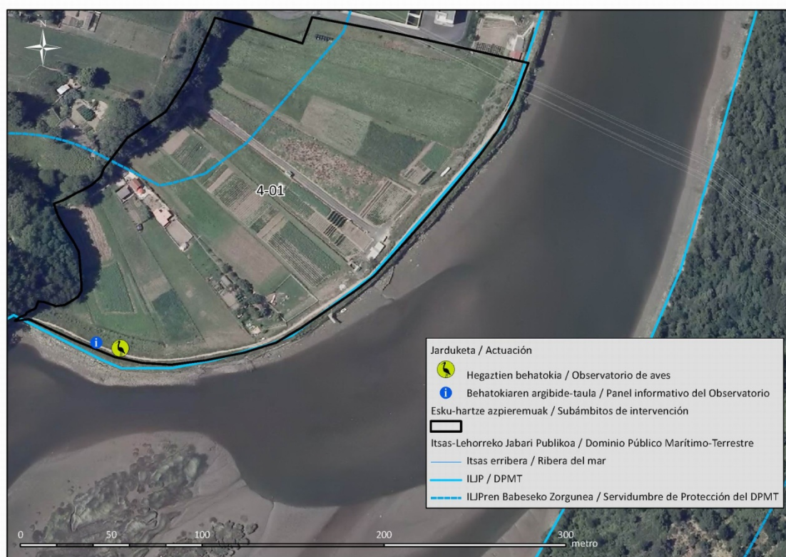
4. Irudia: Behatoki bat eta informazio-panel bat jartzeko proposatzen den kokalekua

Hegaztien behatoki hori egokitzeko beharrezkoa izango da hegaztiak identifikatzeko interpretazio gakoak biltzen dituen informazio –panela jartzea eta hegaztiak behatzeko aterpe aproposa eskainiko duen egurrezko etxola eraikitzea. Etxola hori gehienez 3 metro garai izango da eta egurrez, edota inguruneke paisaian erabat integratzea ahalbidetuko duten antzeko materialez, egina egongo da (ikus Ekintza Plana, 5.1.2. Behaketa guneak atala). Aintzat hartzekoa litzateke, baita ere, betaurreko prismadunak jartzeko aukera, hegazti horien behaketa errazte aldera.