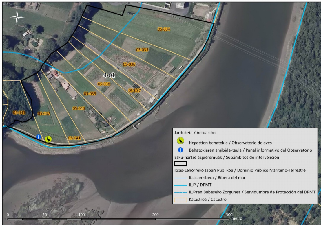
5. Irudia: Ukitutako lursailak