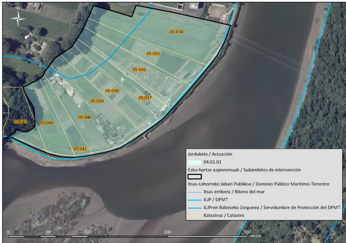
7. Irudia: Basadizarreko ibarra padura gisa berrezartzeko ukitutako lursailak