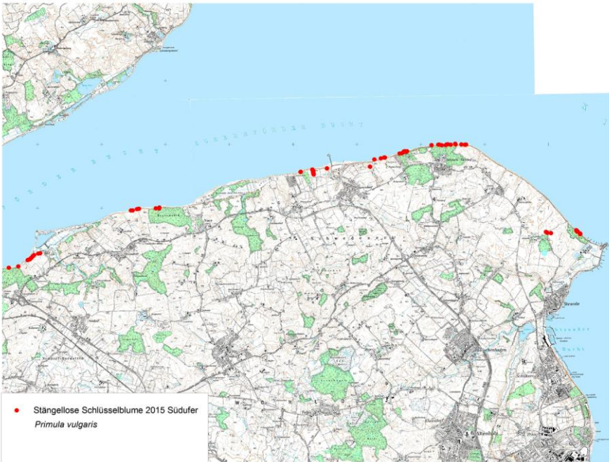
Karte 4: Funde von Primula vulgaris auf dem Südufer der Eckernförder Bucht 2015

Eckernförder Bucht an folgenden Orten vor: in den aktiven und inaktiven Kliffs bei Aschau, Hegenwohld und Lindhöft, auf dem Strandwall und im feuchten Wäldchen bei Lindhöft, in Kliffs und Bachschluchten bei Surendorf, Hohenhain und Dänisch-Nienhof, im Kliff bei Hatzberg/Bülk. Am Nordufer wurde die Primel rund um den Hemmelmarker See und im Hemmelmarker Wald, in den inaktiven Kliffs bei Karlsminde und nordöstlich des Aassees sowie im Steilufer und in einer Bachschlucht bei Waabs und im Hökholz bei Großwaabs gefunden (Karte 4).