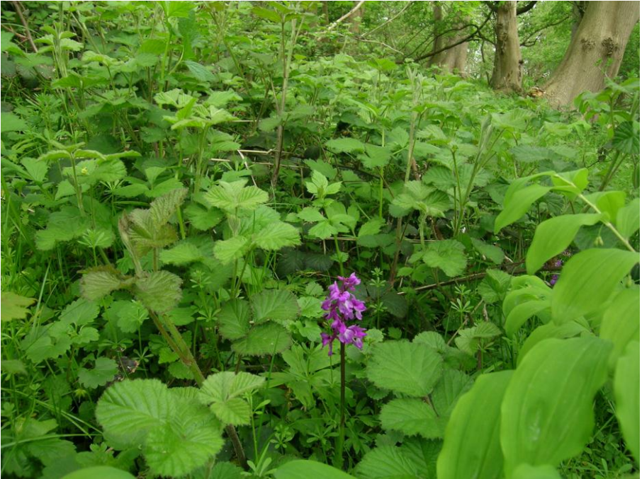
Abb. 16: Gefährdung des Stattlichen Knabenkrautes ( Orchis mascula ) und weiterer gefährdeter Arten wie Paris quadrifolia durch Eutrophierung und Ausbreitung von Brombeeren und Brennesseln. Jellenbek