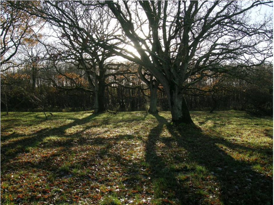
Abb. 23: Markante Alteichen ( Quercus robur ) auf dem Strandwall von Lindhöft