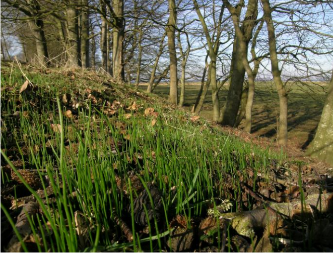
Abb. 11: Große Bestände des Scheidigen Goldsterns ( Gagea spathacea ) auf und an dem inaktiven Kliff in Aschau. Hier wachsen auch große Bestände der Stängellosen Primel ( Primula vulgaris )