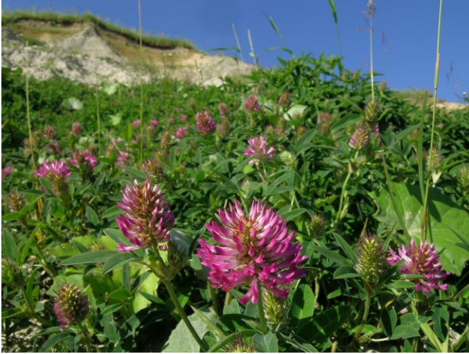
Abb. 4: Große reich blühende Bestände des Rot-Klees ( Trifolium pratense ). Hier in der Steilküste bei Stohl hat die autochthone Form dieses Klees ein Refugium.