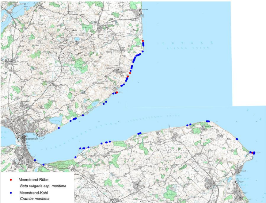
Karte 5: Funde von Beta vulgaris ssp. maritima und Crambe maritima an der Eckernförder Bucht 2015

bergstrand/Langhoved, an zwei Stellen bei Waabs/Strandbek und nördlich Bookniseck gefunden. Die im Spätsommer weit ausladenden Pflanzen wachsen bevorzugt in und an Uferverbauungen oder zwischen Steinen am Strand. Christensen (1996) beschreibt die Ausbreitung der Art in Schleswig-Holstein, wobei Diasporen mutmaßlich über Meeresströmungen von den dänischen Inseln hertransportiert worden sind. Inzwischen gibt es an der nördlichen und an der südlichen Ostseeküste unseres Landes mehrere Vorkommen, deren Diasporen vermutlich schwimmend durch küstenparallele Strömungen weitergetragen werden.