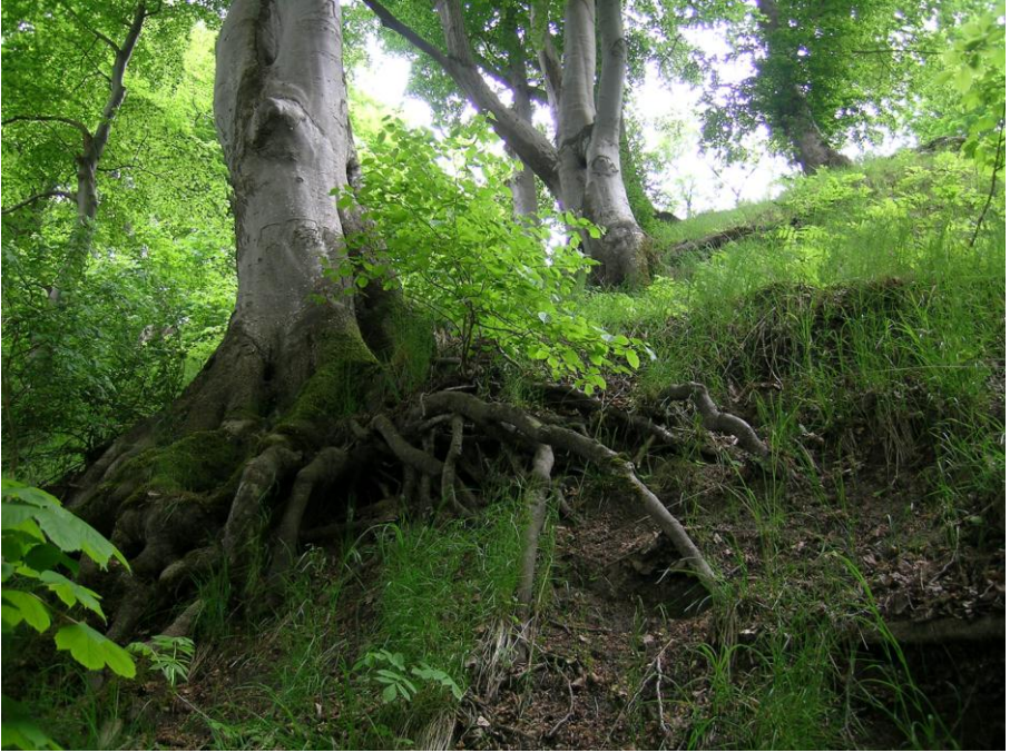
Abb. 9: Beeindruckende Altbuchen in der Steilküste von Kiekut/Grüner Jäger