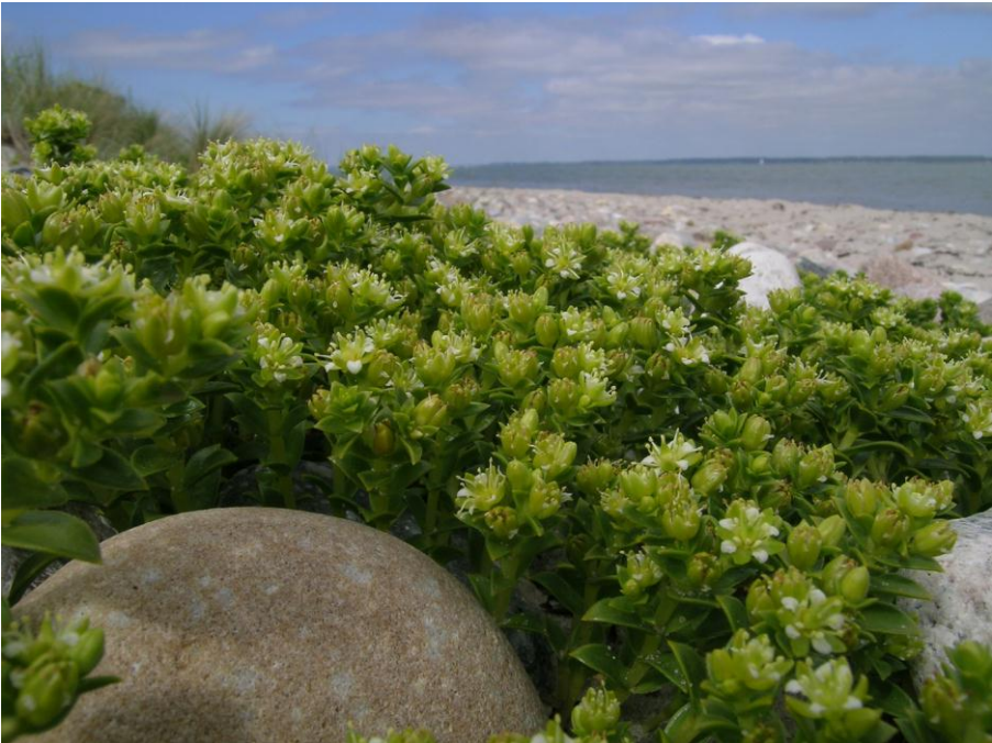
Abb. 18: An den naturnahen, nicht zu stark durch Tourismus beeinträchtigten Stränden bildet die Meerstrand-Salzmiere ( Honckenya peploides ) große Polster

An vielen Stränden ist dank der eher extensiven Erholungsnutzung zumindest stellenweise eine naturnahe halophytische Pioniervegetation mit ein- und zweijährigen sowie ausdauernden Arten ausgebildet. Typische Arten im salzbeeinflussten Bereich sind Salzmiere ( Honckenya peploides ), Spieß-Melde ( Atriplex prostrata ), Meersenf ( Cakile maritima ) und Kali-Salzkraut ( Salsola kali ).