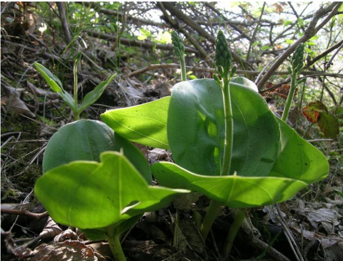
Abb. 10: Das Große Zweiblatt ( Listera ovata ), eine Orchideenart, bildet Massenbestände in den Steilküsten von Eckernholm, Hohenhain und Dänisch-Nienhof.