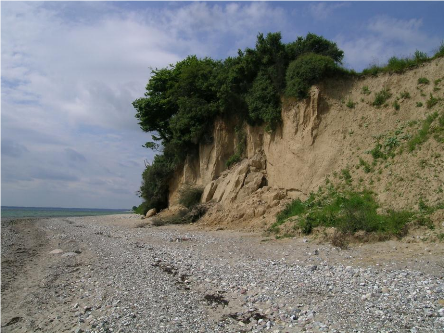
Abb. 2: Besonders steiler, stellenweise vegetationsfreier Abbruch südöstlich von Waabs mit eindrucksvollen überhängenden Schlehen-Gebüsch ( Prunus spinosa )