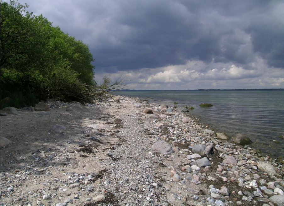
Abb. 1: Naturnahes Ufer östlich Lindhöft mit Steinstrand und bewaldeter Abbruchkante

Raum. Dank der natürlichen Küstendynamik finden hier viele Pflanzenarten ein Refugium, die an Küstenlebensräume gebunden sind, oder die anderenorts durch intensive Landnutzung gefährdet sind.