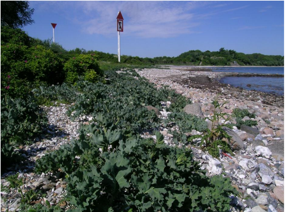
Abb. 19: Die größten Bestände des Meerkohls ( Crambe maritima ) an der Eckernförder Bucht finden sich am Steinstrand bei Bülk.

Der Meerkohl ( Crambe maritima , Karte 5) besiedelt bevorzugt Stellen, an denen der Sand mit Strandsteinen gemischt vorliegt und damit etwas stabilisiert wird. Die individuenstärksten Populationen des Meerkohls finden sich an den Außenküsten der Eckernförder Bucht im Bereich Bülk und Waabs/Bookniseck, während an den Küsten der inneren Bucht die Art zwar regelmäßig, aber meist nur jeweils mit wenigen Individuen vorkommt. Einzelne Vorkommen (zum Beispiel Teile der Population in Bülk) werden von der Kartoffelrose ( Rosa rugosa ) bedrängt, und einzelne werden jedes Jahr durch Erholungssuchende vernichtet (zum Beispiel am Südstrand Eckernförde: Open-Air-Konzerte), wobei die Art insgesamt an der Eckernförder Bucht als nicht gefährdet erscheint. Einige Vorkommen sind angesalbt worden (Stephan 2005). Im Bereich Aschau wurde zudem die Stranddistel ( Eryngium maritimum ) angesalbt (Stephan 2006), wobei das langfristige Überleben dieser anspruchsvollen Strandart fraglich erscheint.