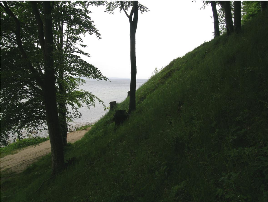
Abb. 13: Starker Holzeinschlag in den Buchen-Hangwald bei Kiekut/Grüner Jäger

Die Küstenwälder mit bewaldeten Steilküsten haben sich in vergleichenden Untersuchungen (Romahn 2015 a) als bedeutende »Hotspots« der Artenvielfalt erwiesen. Daher sollten größere Anstrengungen zu ihrem Schutz unternommen werden. Der Holzwert der im Seewind aufgewachsenen knorrigen Bäume dürfte größtenteils gering sein. In der Steilküste selbst sollte nicht eingeschlagen werden, und auch die oft beeindruckenden Baumgestalten oberhalb der Kante sollten unter Schutz gestellt werden. Daher ist der Kauf von Altbäumen oder Vertragsnaturschutz zu empfehlen.