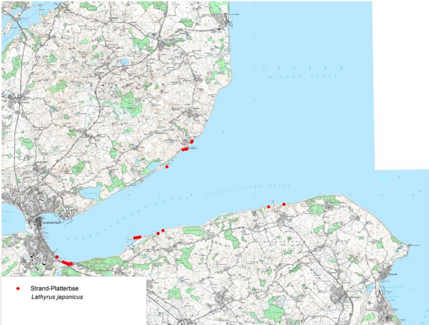
Karte 6: Funde von Lathyrus japonicus an der Eckernförder Bucht 2015

Vorkommen bei Lehbergstrand/Langhoved. Die Art vermehrt sich am Standort vor allem durch unterirdische Ausläufer, welche den Sand durchziehen. Aufgrund ihrer skleromorphen Blätter scheint die Pflanze verhältnismäßig tolerant gegenüber gelegentlichem Vertritt zu sein. Möglicherweise wurden neue Vorkommen angesalbt oder durch Erholungssuchende verschleppt, denn oft fällt die Nähe der Populationen zu »Badeeingängen« am Strand auf.