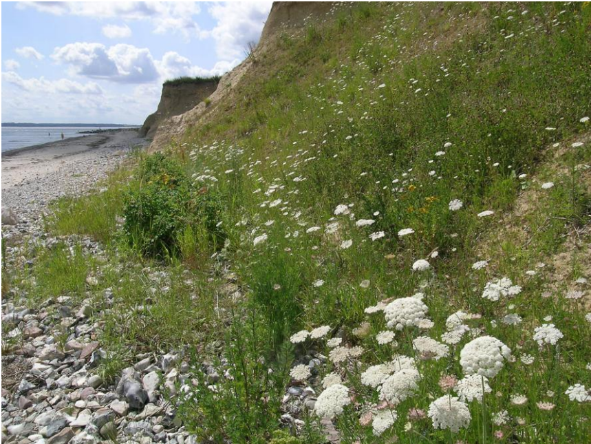
Abb. 5: Autochthoner großer Bestand der Wilden Möhre ( Daucus carota ) in der Steilküste bei Waabs