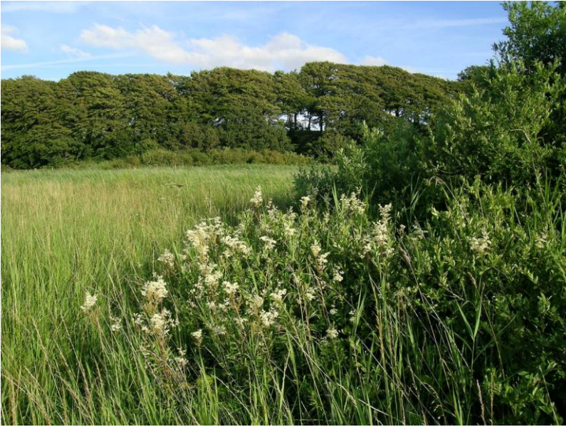
Abb. 12: Blick vom Strandwall von Aschau über das dahinter liegende Schilf- und Grünlandgebiet hinüber zum bewaldeten, inaktiven Kliff mit knorrigem Altbuchen.