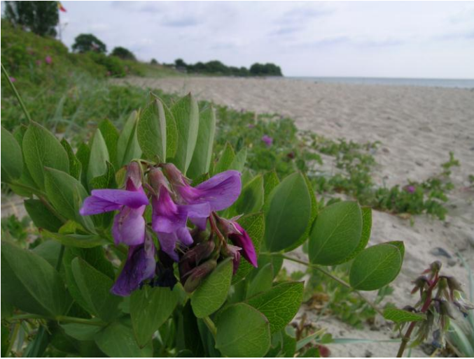
Abb. 20: Die Meerstrand- Platterbse ( Lathyrus japonicus ) bei Waabshof an einem touristisch intensiv genutzten Strand