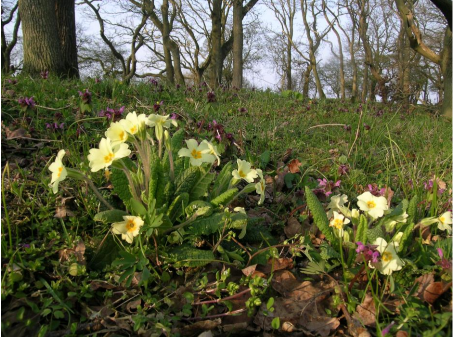
Abb. 17: Besonderer Wuchsort der Stängellosen Primel ( Primula vulgaris ) auf dem beweideten Strandwall von Lindhöft

Im Jahr 2015 wurden viele blühende und auch fruchtende Primeln an der Eckernförder Bucht und auch anderenorts in Schleswig-Holstein (Kobarg per mail, Harder per mail) angetroffen, da es sich offenbar um ein günstiges »Primel-Jahr« gehandelt hat.