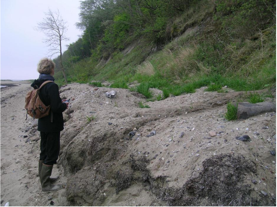
Abb. 8: Illegale Abkippungen von Seegras, Tang und Steinen an der Steilküste von Dänisch-Nienhof, welche die nach FFH-RL geschützten Lebensräume erheblich beeinträchtigen und die gefährdeten Arten bedrohen.