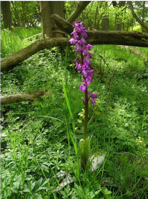
Abb. 15: Stattliches Knabenkraut ( Orchis mascula ) im Wäldchen von Jellenbek bei Surendorf

Die kleinen Bachschluchten und der kleine Wald bei Jellenbek sind aufgrund ihrer direkten Nachbarschaft zu Agrarflächen in besonderem Maße durch Eutrophierung gefährdet. So breiten sich seit Jahren in Jellenbek Brombeeren und Brennesseln immer stärker aus und drohen die gefährdeten Arten zu verdrängen. Empfohlen wird daher, im Rahmen von Vertragsnaturschutz oder Agrarumweltprogrammen Pufferflächen für diese wertvollen Strukturen zu den Agrarflächen hin einzurichten. Zudem sollten alte Bäume am Rand der Schluchten und im Auebereich möglichst erhalten werden. Das Befahren der sensiblen Auen- und Hanglebensräume sollte unterbleiben.