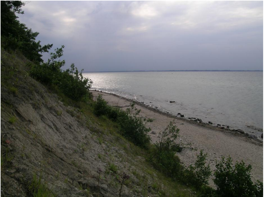
Abb. 6: Mergeliger sickerfeuchter Steilhang bei Dänisch-Nienhof, Wuchsort eines großen Bestandes des Sumpf-Herzblattes ( Parnassia palustris )

Aufgrund der Rohböden sind Steilküsten auch ein wichtiger Lebensraum für konkurrenzschwache Kryptogamen-Arten. Typische Moosarten für sickerfeuchte mergelige Stellen an den Steilküsten sind Pellia endiviifolia , Didymodon fallax , Dicranella varia , Bryum pallens , Bryum gemmiferum und Pohlia wahlenbergii . Besonders auffällig ist Pellia endiviifolia , welche die Steilküsten stellenweise mit einem dichten, an Salatblättchen erinnernden Rasen überzieht. Auch Flechten wie Collema limosum sind auffällig. Weniger auffällig, aber durchaus typisch sind die Flechten Thelidium minutulum und T. zwackii (Moos- und Flechtenfunde, Bestimmung und Habitatcharakteristik C. Dolnik).