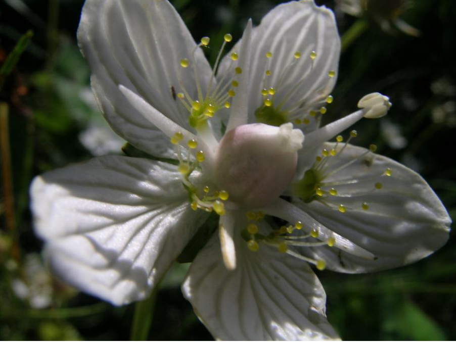
Abb. 7: Blüte des Sumpf-Herzblattes ( Parnassia palustris )

Gefährdungen und Schutzmöglichkeiten: In Surendorf und Dänisch-Nienhof wurden große Mengen von Tang und Seegras, gemischt mit Sand und Steinen, vom Kurstrand entfernt und in großen Haufen in und am Fuße der wertvollen Steilküsten-Lebensräume abgekippt, wobei diese teils überschüttet worden sind. Auf einigen Haufen ist eine üppige nitrophytische Vegetation entstanden, die dort nicht standortgemäß ist. Betroffen sind unter anderem Lebensräume von Fuchs Knabenkraut, Sumpf-Herzblatt, Stängelloser Primel und anderen überaus gefährdeten Arten. Es ergibt sich eine erhebliche Beeinträchtigung der nach Anhang I FFH RL geschützten wertvollen Steilküstenlebensräume, u. a. der nach Anhang I FFH RL prioritär geschützten Lebensraumtypen Kalktuffquellen und des Eschen-Ahorn-Hangwaldes sowie des Stein- und Geröllstrandes am Fuße der Steilküste. Die Ablagerungen beeinträchtigen zudem den ästhetischen Eindruck der naturnahen Küste. Eine Mail an den Bürgermeister der Gemeinde Schwedeneck und ein Gespräch mit dem verantwortlichen Gemeindearbeiter hatten zum Ergebnis, dass das Abkippen von nun an vermieden werden soll. Die Einhaltung sollte von der Unteren Naturschutzbehörde kontrolliert werden.