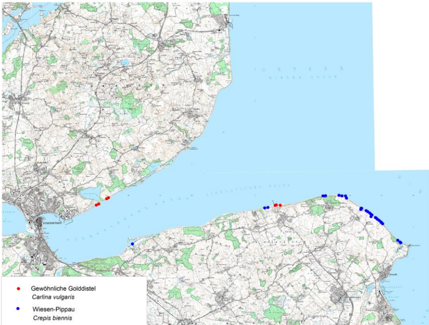
Karte 1: Funde von Calina vulgaris und Crepis biennis an der Eckernförder Bucht 2015

se), Wiesen-Platterbse ( Lathyrus pratensis ), Wiesen-Flockenblume ( Centaurea jacea ) und Fettwiesen-Margerite ( Leucanthemum ircutianum ). Diese Vorkommen sind mit hoher Wahrscheinlichkeit als autochthon einzustufen und damit hochgradig schutzwürdig, denn sie sind anderenorts in der Kulturlandschaft aufgrund des intensiven Einsatzes von Einsaatmischungen aus Südosteuropa und anderen Provinzen inzwischen wohl kaum noch zu finden. Insbesondere der autochthone Rot-Klee dürfte inzwischen sehr selten geworden sein. Zudem kommen in den Steilküsten häufige Arten des nährstoffreichen Grünlandes vor, wie Wiesen-Kerbel ( Anthriscus sylvestris ), Wiesen-Labkraut ( Galium album ), Vogel-Wicke ( Vicia cracca ) und Wiesen-Bärenklau ( Heracleum sphondylium ). Der Wiesen-Pippau ( Crepis biennis , Karte 1) und die Scabiosen-Flockenblume ( Centaurea scabiosa ) zeigen basische Verhältnisse an. Auch Saum-Arten wie Mittlerer Klee ( Trifolium medium ), Knautie ( Knautia arvensis ) und Kleiner Odermennig ( Agrimonia eupatoria ) sind zu finden.