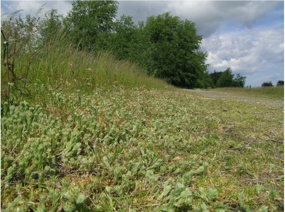
Abb. 21: Trockener Trittrasen am Rande eines Wanderweges mit Massenbeständen von Gewöhnlichem Filzkraut ( Filago vulgaris ).