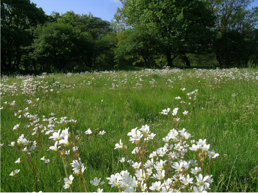
Abb. 22: Massenbestände des Knöllchen-Steinbrechs ( Saxifraga granulata ) auf dem extensiv beweideten Strandwall von Lindhöft