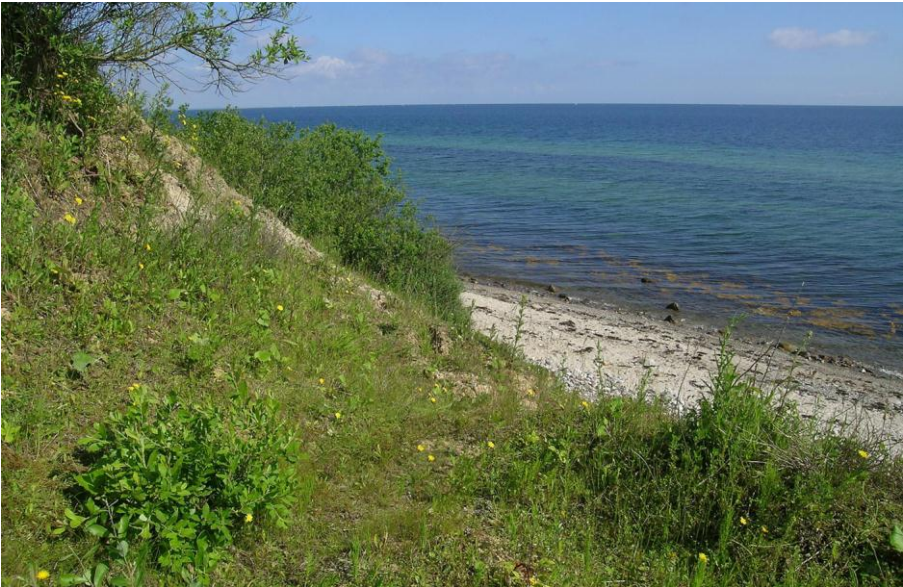
Abb. 3: Krautige Vegetation mit u. a. Wiesen-Pippau ( Crepis biennis ), Echtem Tausendgüldenkraut ( Centaurium erythraea ), Wiesen-Flockenblume ( Centaurea jacea ) und Huflattich ( Tussilago farfara ) sowie aufkommende Weidengebüsche bei Stohl

Großblütige Königskerze ( Verbascum densiflorum ). Diese Sippen finden sich ebenfalls oft in großen Beständen und sind aspektprägend. Weiterhin typisch für dynamische Steilküstenabschnitte sind typische Ackerwildkraut-Arten wie Acker-Kratzdistel ( Cirsium arvense ), Acker-Vergissmeinnicht ( Myosotis arvensis ), Gewöhnlicher Erdrauch ( Fumaria officinalis ) und Geruchlose Kamille ( Tripleurospermum maritimum ). Eine sehr seltene Ackerwildkraut-Art ist die Nacht-Lichtnelke ( Silene noctiflora ), die in der Steilküste von Hemmelmark vorkommt. An basischen Bodenanschnitten mit offenen Bodenstellen findet sich das Echte Tausendgüldenkraut ( Centaurium erythraea ).