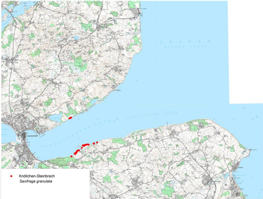
Karte 8: Funde von Saxifraga granulata an der Eckernförder Bucht 2015

Hinter der bewaldeten Düne von Noer befindet sich ein Steilufer, in dem ein Bestand der Weißen Pestwurz ( Petasites albus ) vorkommt. Ein weiterer großer Bestand findet sich in einem kleinen Bruchwäldchen hinter dem Strandwall von Lindhöft.