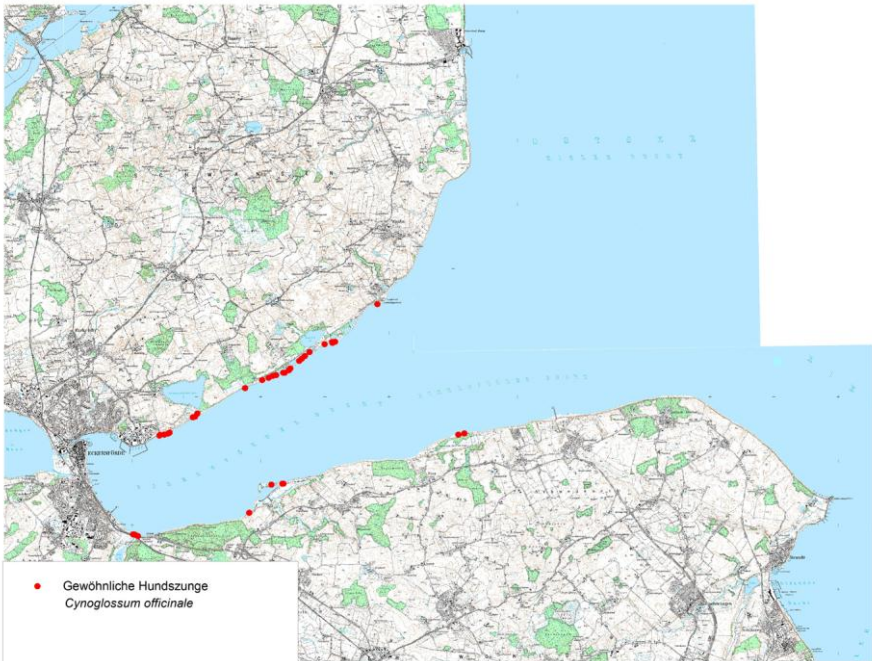
Karte 7: Funde von Cynoglossum officinale an der Eckernförder Bucht 2015