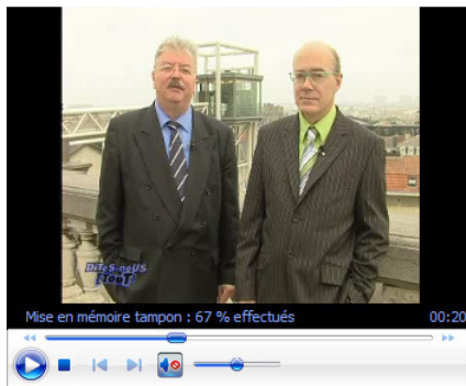
Extrait de "Dites nous tout" - Télé Bruxelles