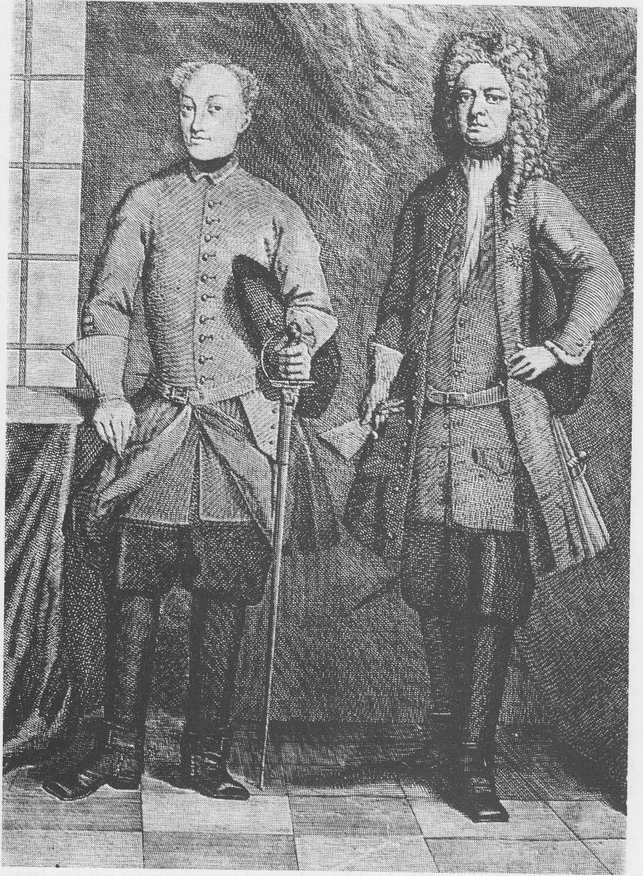
Karl XII och Görtz.

Efter kopparstick i Aubry de la Motraye, "Voyage en Europe, Asie et Afrique" (1723).