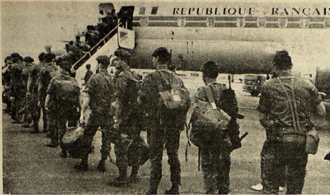
FRANCESES HACIA LIBANO.— Tolosa, Francia, septiembre 22. Soldados del octavo regimiento de paracaidistas de la armada francesa, suben a un transporte aéreo, en Tolosa, en el suroeste de Francia, para dirigirse a Libano y participar en la Fuerza Multinacional de Mantenimiento de la Paz.