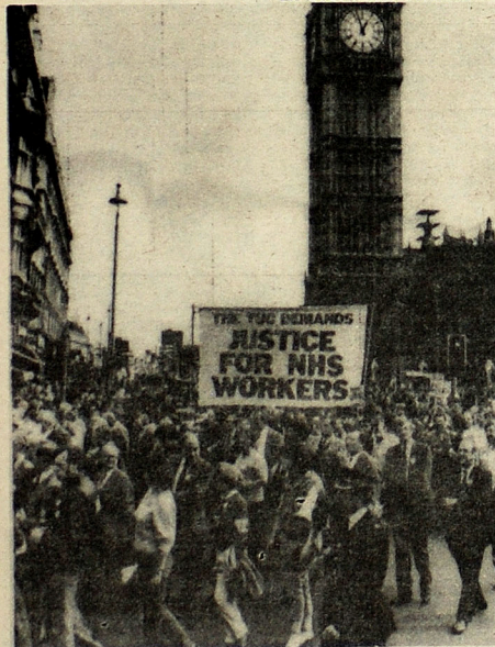
MANIFESTANTES.— Londres, septiembre 22. Grupos de manifestantes desfilan hoy por las calles de Londres, durante la "Jornada de acción", organizada por el congreso sindical, en apoyo de las demandas salariales de las enfermeras y empleados sanitarios. Mineros del carbón, obreros metalúrgicos, empleados de ambulancia y del transporte, figuraron entre los centenares de millares de trabajadores, que secundaron un paro de solidaridad.