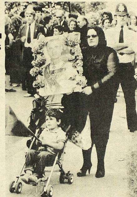
RECUERDAN AL SHA. Londres, julio 27 (UPI).— Una demostración de ex súbditos del destronado Sha Mohamed Reza Pavlevi, conmemoró el cuarto aniversario de su fallecimiento en Egipto. Atacaron la política seguida por el actual Jefe de Estado, el Ayatollah Komheini.