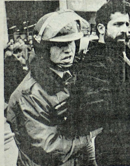
ARRESTA A ISLAMICO. Estambul, Marzo 10. Un policía turco arresta un militante islámico, después que la policía dispersó una manifestación de más de 3 mil personas que piden que se suspenda la prohibición a las mujeres islámicas de vestir los velos cuando asisten a la universidad.