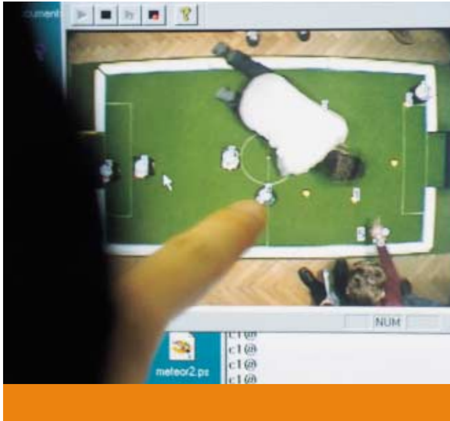
// FUSSBALL SPIELLENDE ROBOTER: DAS IUB ROBOCUP-TEAM 2002 ALS BUNDESLIGAERSATZ BEIM ›OPEN HOUSE‹