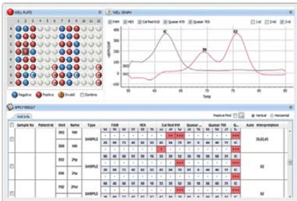
Resultado de los genotipos en base a las Curvas de Melting