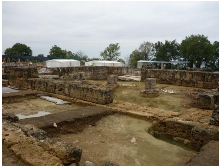
Εικόνα 8: Ανάκτορο Αιγών

Το έργο με προϋπολογισμό €7.000.000, και υπό την εποπτεία της ΙΖ' Εφορεία Προϊστορικών και Κλασικών Αρχαιοτήτων, έχει ως βασικό αντικείμενο την αποκατάσταση και ανάπλαση των αρχαιολογικών χώρων της Βεργίνα, Νομός Ημαθίας. Συγκεκριμένα περιλαμβάνει την ανάπλαση-ανάδειξη της βασιλικής Νεκρόπολης και του Ανακτόρου των Αιγών , μέσω της συντήρησης, καθαρισμού και ολοκλήρωσης εργασιών των δωματίων, αρχιτεκτονικών μελών και δομών , καθώς και μέσω της ανάταξης και συμπλήρωσης λίθινου τοιχοβάτη των δωματίων της νότιας και νοτιοανατολικής πτέρυγας του ανακτόρου. Επιπλέον θα πραγματοποιηθούν διάφορες μελέτες με στόχο την αναβάθμιση του δικτύου ηλεκτροφωτισμού, πυρόσβεσης κ.α. για την ανάδειξη των ταφικών μνημείων. Η νεκρόπολη είναι ο υπόγειος χώρος της μνήμης όλων των Μακεδόνων και το ανάκτορο των Αιγών είναι το μεγαλύτερο ανάκτορο της κλασικής Ελλάδας. Τα αποτελέσματα από την υλοποίηση, και λειτουργία του έργου αποτυπώνονται στον ακόλουθο πίνακα: