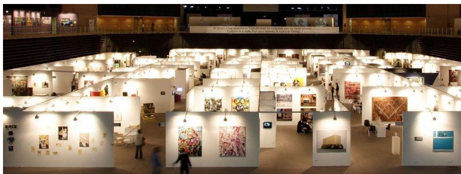
Εικόνα 9: Εκδήλωση Art Athina

Η ART-ATHINA θεσμοθετήθηκε το 1993 από τον Πανελλήνιο Σύνδεσμο Αιθουσών Τέχνης (Π.Σ.Α.Τ.) .Το έργο της «Διεθνής Συνάντησης Σύγχρονης Τέχνης 2013», με αρχικό προϋπολογισμό €600.000 αφορά την έκθεση «ART-ATHINA» που αποτελεί είναι μία από τις παλαιότερες φουάρ σύγχρονης τέχνης της Ευρώπης. Στόχος της έκθεσης είναι η ενίσχυση της προβολής, κυρίως της σύγχρονης ελληνικής εικαστικής δημιουργίας και των παραγόντων της καθώς και η ενδυνάμωση των συνεργασιών στον εικαστικό χώρο.