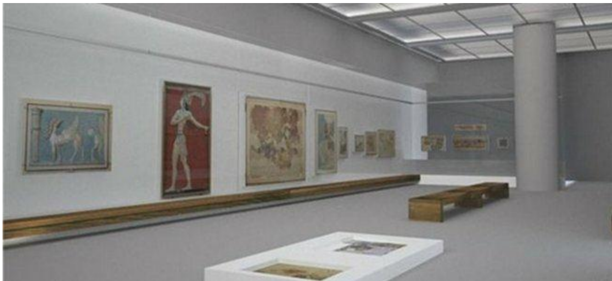
Εικόνα 7: Αρχαιολογικό Μουσείο Ηρακλείου

Σκοπός του έργου είναι αρχικά η συντήρηση, ο καθαρισμός και η στερέωση περίπου 2.000 αντικειμένων καθώς και η μεταφορά των συντηρημένων αντικειμένων στους εκθεσιακούς χώρους. Το έργο έχει προϋπολογισμό €7.694.834 και περιλαμβάνει μεταξύ άλλων την κατασκευή, προμήθεια και εγκατάσταση των προθηκών, μετά των ενσωματωμένων σε αυτές φωτιστικών, καθώς και την προμήθεια και εγκατάσταση των φωτιστικών, που τοποθετούνται εκτός προθηκών για τις ανάγκες φωτισμού των εκθεμάτων. Τέλος, το έργο περιλαμβάνει Οικοδομικές, Η/Μ και λοιπές εργασίες οι οποίες είναι απαραίτητες για την κατάλληλη οργάνωση και διαμόρφωση των χώρων του ΑΜΗ, καθώς και μουσειογραφική μελέτη επανάκθεσης του ΑΜΗ κ.α.. Τα αποτελέσματα από την υλοποίηση, και λειτουργία του έργου αποτυπώνονται στον ακόλουθο πίνακα: