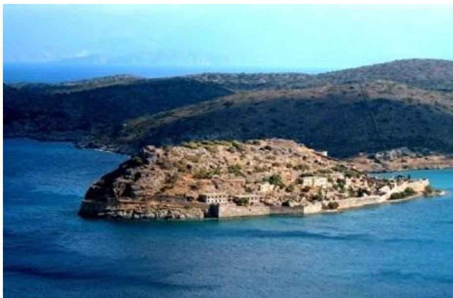
Εικόνα 2: Σπιναλόγκα

Το έργο με προϋπολογισμό €1.800.000 και επιβλέπουσα αρχή την 13 η Εφορεία Βυζαντινών Αρχαιοτήτων περιελάμβανε εργασίες καθαρισμού, στερεώσεων και συμπληρώσεων στο Ανατολικό επιθαλάσσιο τείχος της νησίδας Σπιναλόγκα, Ανατολική Κρήτη. Επιπρόσθετα, περιλαμβάνει εργασίες καθαρισμού, διερεύνησης, αποχρωμάτωσης, στερέωσης και διαμόρφωσης στους Τομείς 1 και 2 της Δυτικής πλευράς της Σπιναλόγκας καθώς και την τοποθέτηση ενημερωτικών πινακίδων. Τα αποτελέσματα από την υλοποίηση, και λειτουργία του έργου αποτυπώνονται στον ακόλουθο πίνακα: