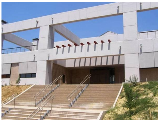
Εικόνα 3: Μουσείο Διδυμοτείχου

Το έργο με προϋπολογισμό €1.760.000, αφορά την οργάνωση της μόνιμης έκθεσης του Βυζαντινού Μουσείου Διδυμοτείχου. Το Μουσείο θα φιλοξενήσει επί το πλείστον ευρήματα από το Διδυμότειχο και την ευρύτερη περιοχή του, αλλά και ευρήματα από την περιοχή της Θράκης τα οποία βρίσκονται σε διασπορά σε άλλα μουσεία ή φυλάσσονται σε αποθήκες. Τα εκθέματα χρονολογούνται από την ρωμαϊκή εποχή έως τη δημιουργία του νέου ελληνικού κράτους. Το κτίριο έχει 3 επίπεδα (υπόγειο, ισόγειο και πρώτο όροφο), καθώς περιλαμβάνει και χώρους εξυπηρέτησης κοινού, εκθεσιακούς χώρους περιοδικών εκθέσεων και πολιτιστικών εκδηλώσεων κ.α. Το έργο διακρίνεται σε 3 Υποέργα : Προμήθεια προθηκών και λοιπών εκθεσιακών κατασκευών για την οργάνωση της μόνιμης έκθεσης του Βυζαντινού Μουσείου Διδυμότειχου, Προμήθεια Φωτιστικών Σωμάτων και Λοιπών εξαρτημάτων τους για τις ανάγκες του εκθεσιακού φωτισμού του Βυζαντινού Μουσείου Διδυμοτείχου και το την Οργάνωση της Μόνιμης Έκθεσης του Βυζαντινού Μουσείου Διδυμοτείχου και Υλοποίησης των Συνοδευτικών Επικοινωνιακών Δράσεων. Τα αποτελέσματα από την υλοποίηση, και λειτουργία του έργου αποτυπώνονται στον ακόλουθο πίνακα: