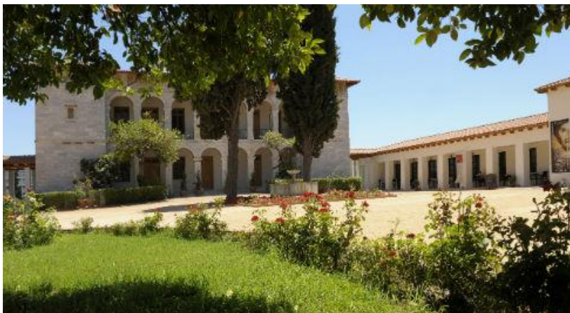
Εικόνα 5: Βυζαντινό & Χριστιανικό Μουσείο

Το Βυζαντινό και Χριστιανικό Μουσείο, με έδρα την Αθήνα, είναι ένα από τα εθνικά μουσεία της χώρας για την τέχνη και τον πολιτισμό των βυζαντινών και μεταβυζαντινών χρόνων. Το έργο με προϋπολογισμό €2.190.000, περιλαμβάνει διαμορφώσεις του περιβάλλοντος χώρου του μουσείου, καθώς και έργα άρδευσης και αποχέτευσης. Επιπλέον, το έργο έχει ως αντικείμενο την εκπόνηση των απαραίτητων μελετών εφαρμογής, τον σχεδιασμό, την παραγωγή και τοποθέτηση πληροφοριακού και ενημερωτικού υλικού σε όλη την έκταση του περιβάλλοντος χώρου, προστασία και ανάδειξη των μνημείων που ευρίσκονται στον χώρο, επέκταση των κηποτεχνικών διαμορφώσεων και φυτεύσεων, την τοποθέτηση αντικειμένων φυσικού εξοπλισμού, την τεκμηρίωση και προβολή της πράξης. Τα αποτελέσματα από την υλοποίηση, και λειτουργία του έργου αποτυπώνονται στον ακόλουθο πίνακα: