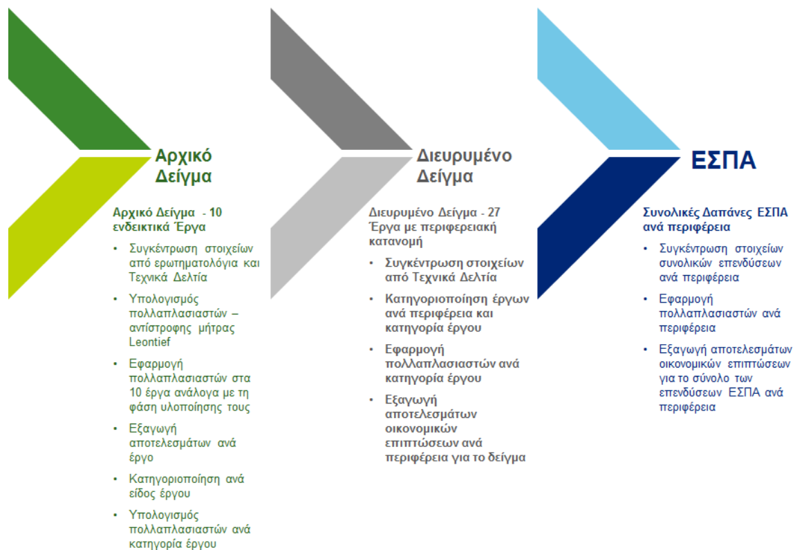
Σχήμα 4: Διαδικασία Επεξεργασίας Δεδομένων και Εξαγωγής Αποτελεσμάτων

Η μεθοδολογία υλοποίησης της επεξεργασίας των δεδομένων αλλά και μέτρησης των επιπτώσεων ανά διακριτή φάση αποτυπώνεται στο ακόλουθο σχήμα: