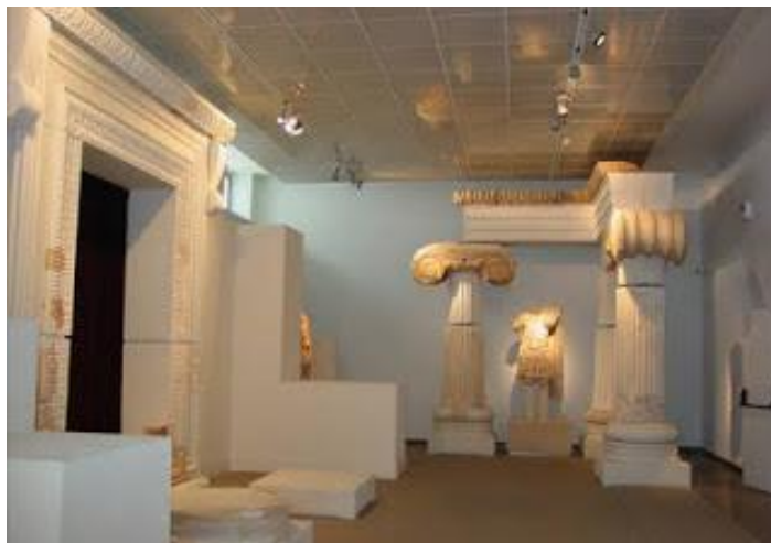
Εικόνα 4: Αρχαιολογικό Μουσείο Θεσσαλονίκης

Ο προϋπολογισμός του έργου για το Αρχαιολογικό Μουσείο Θεσσαλονίκης είναι €1.546.523,81 και έχει ως αντικείμενο την Ανάπτυξη της Πολιτιστικής Υποδομής του Μουσείου. Συγκεκριμένα, περιλαμβάνει τη μεταφορά των αρχαίων αντικειμένων που βρίσκονται στον προαύλιο χώρο σε διπλανή έκταση, προκειμένου να κατασκευαστεί η υποσκαφή αποθήκη. Στη συνέχεια θα διαμορφωθεί υπαίθρια έκθεση αρχαιοτήτων σε ενότητες με υποδομές πρόσβασης και για ΑΜΕΑ , αποθήκευση-τακτοποίηση αρχαίων σε διαμορφωμένη ζώνη και δημιουργία εκπαιδευτικών προγραμμάτων και πρασίνου κ.α. Επιπλέον, το έργο περιλαμβάνει την κατασκευή υποσκαφής αποθήκης στη δυτική ζώνη του περιβάλλοντος χώρου του ΑΜΘ η οποία θα συνδέεται με υπόγειο διάδρομο με το κτίριο του μουσείου και θα έχει ρήση αποθήκης αρχαίων. Οι εργασίες που θα ακολουθήσουν είναι ανασκαφές, συντηρήσεις, κατασκευές κ.α.. Τα αποτελέσματα από την υλοποίηση, και λειτουργία του έργου αποτυπώνονται στον ακόλουθο πίνακα: