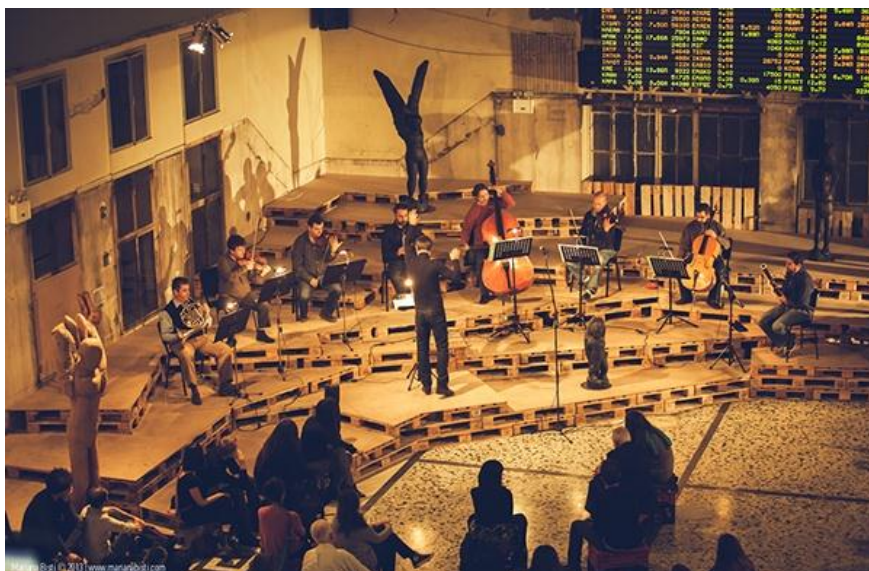
Εικόνα 10: Biennale Athens 2013

Το έργο έχει προϋπολογισμό €650.000 και περιλαμβάνει την προετοιμασία, υλοποίηση και διεξαγωγή της 4 ης Μπιενάλε της Αθήνας 2013. Το έργο έχει ως αντικείμενο την έγκαιρη μεταφορά και τοποθέτηση των έργων τέχνης της έκθεσης , την παρουσίαση και υποστήριξη των έργων, τον συντονισμό και υποστήριξη της παραγωγής, διαχείρισης και επικοινωνίας της διοργάνωσης κ.α. Η 4 η Μπιενάλε αποτελείται από την κύρια έκθεση που περιλαμβάνει έργα όλων των καλλιτεχνικών μέσων (ζωγραφική, γλυπτική, εγκαταστάσεις, νέα μέσα κ.α.), καθώς περιλαμβάνει και ημερίδες, ομιλίες, προβολές, τουλάχιστον σαράντα δράσεις, ενώ συμμετέχουν πάνω από 100 καλλιτέχνες, καλλιτεχνικές ομάδες και θεωρητικοί από όλο τον κόσμο.