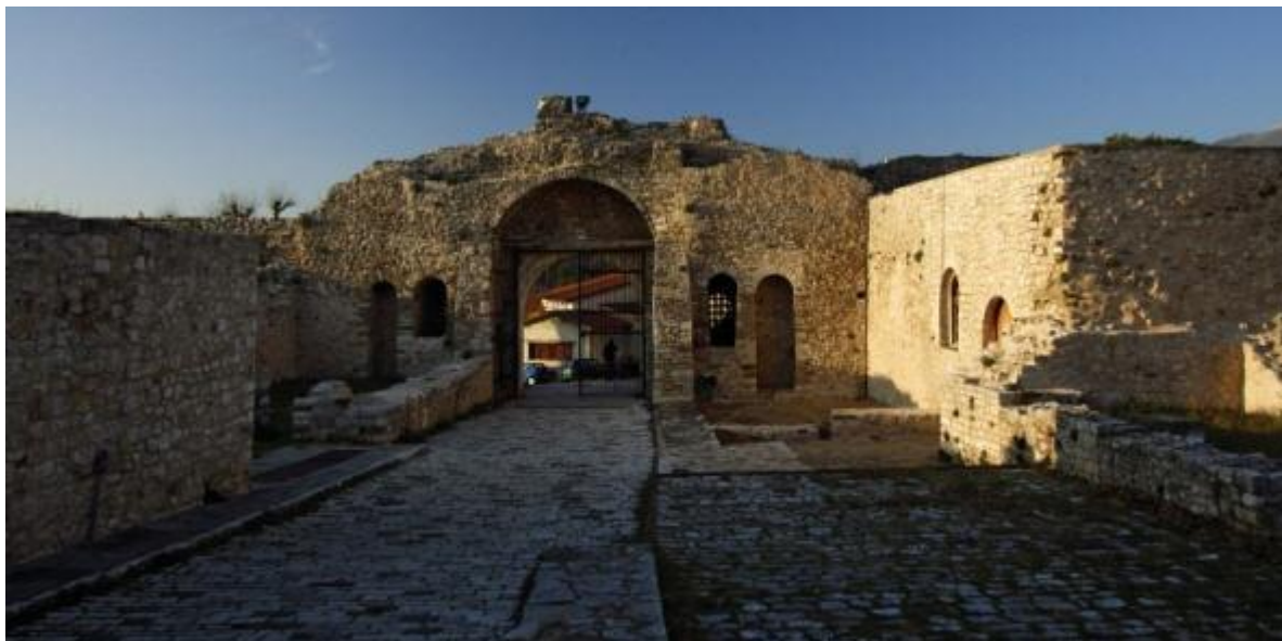
Εικόνα 1: Τμήμα Κάστρου Ιωαννίνων

Το έργο με προϋπολογισμό €2.569.562 και επιβλέπουσα αρχή την 8 η Εφορεία Βυζαντινών Αρχαιοτήτων, περιελάμβανε την αποκατάσταση των εξωτερικών τειχών του Κάστρου Ιωαννίνων. Οι εργασίες πραγματοποιήθηκαν από την περίοδο 2/8/2006 έως 30/6/2009 και αφορούσαν την αποκατάσταση του κεντρικού τμήματος της νοτιοδυτικής πλευράς των τειχών (μνημειακή πύλη του Κάστρου, βυζαντινό πύργο, στοές κ.α.), καθώς και την αποκατάσταση του θολωτού τμήματος του κεντρικού τμήματος του Κάστρου ώστε να λειτουργεί ως επισκέψιμος εκθεσιακός χώρος. Τα αποτελέσματα από την υλοποίηση, και λειτουργία του έργου αποτυπώνονται στον ακόλουθο πίνακα: