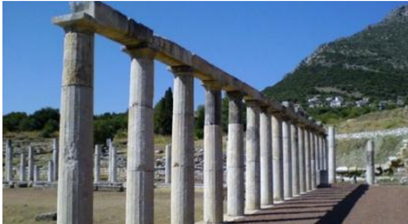
Εικόνα 6: Αρχαιολογικός Χώρος Μεσσήνης

Το αντικείμενο του έργου περιλαμβάνει τη συντήρηση και ανάδειξη των μνημείων και του περιβάλλοντος Αρχαιολογικού χώρου της Αρχαίας Μεσσήνης, στην Πελοπόννησο, και έχει προϋπολογισμό € 2.800.000. Το έργο γίνεται με παράλληλη ανασκαφική δραστηριότητα που κρίνεται απαραίτητη για τη διερεύνηση στοιχείων απαιτούμενων για την προστασία, την συντήρηση και αναστήλωση των μνημείων. Στόχος είναι η ανάδειξη των μνημείων. (Στερέωση και αναστήλωση τοίχου ΒΑ γωνίας, στερέωση και αναστήλωση ναού της θεάς Ειλειθυίας, στερέωση ετοιμόρροπου Πύργου, Αναστήλωση κιονοστοιχιών του Γυμνασίου, συντήρηση και διαμόρφωση βόρειας στοάς αγοράς κ.α.). Τα αποτελέσματα από την υλοποίηση, και λειτουργία του έργου αποτυπώνονται στον ακόλουθο πίνακα: