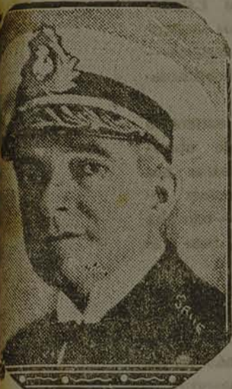
Almirante Protogenes Guimarães, Ministro da Marinha

Hoje é o dia do Marujo Brasileiro. Como um homenagem de Gazeta à Marinha, fazemos a publicação da ordem-do-dia, instituiu, essa data hoje festivamente commemorada: