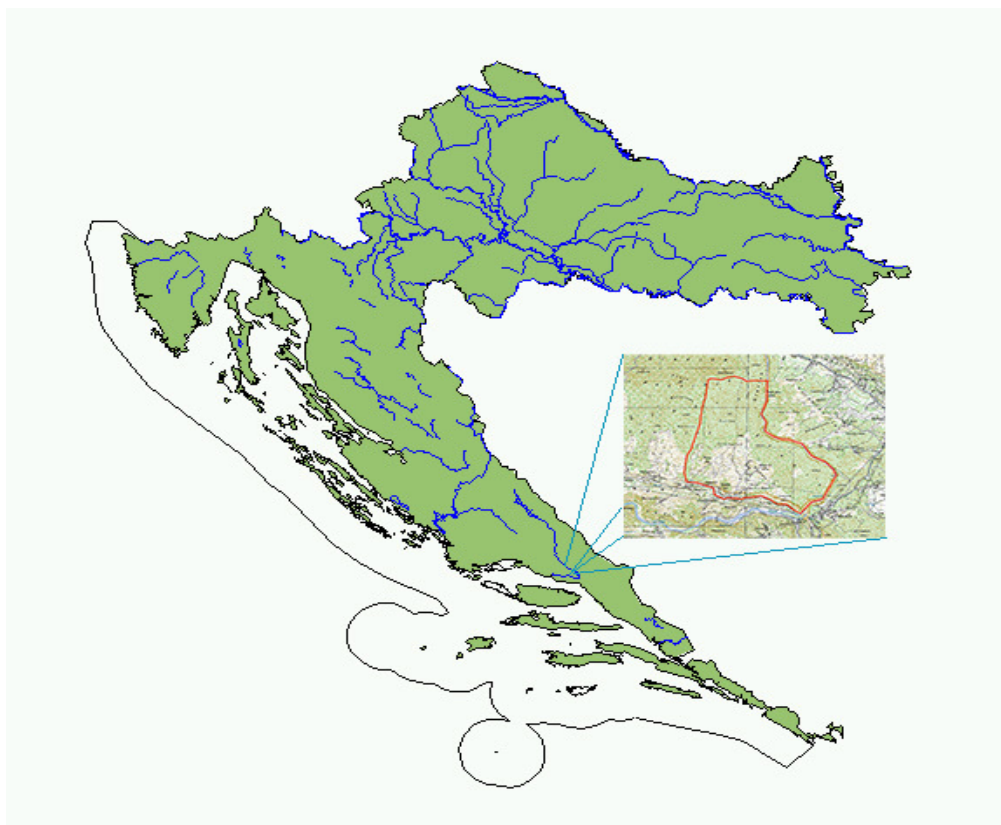
Slika 1. Geografski smještaj istraživanog područja Šćadin.