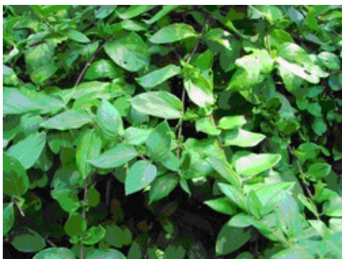
Figure 3. Lonicera japonica Thunb.