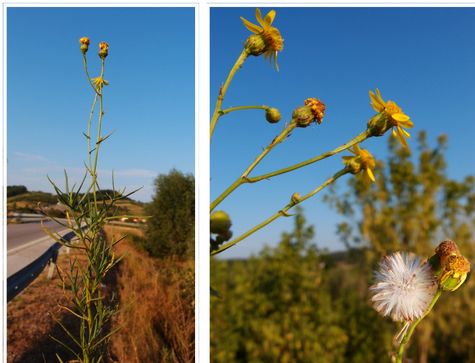
Slika 1. Senecio inaequidens DC. – habitus i cvat.

hepatotoksina pa ga stoka izbjegava pasti što mu, uz činjenicu da ima pojačanu moć apsorpcije mineralnih tvari iz tla, daje dodatnu konkurentsku prednost u odnosu na autohtone vrste. Pored toga, vrsta ima veliki reproduktivni potencijal jer cvate od proljeća do jeseni producirajući prosječno desetak tisuća sjemenki godišnje po jedinki (Ernst 1998).