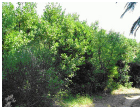
Figure 4. Lonicera japonica Thunb. within the stands of Laurus nobilis L. in the Župa dubrovačka region