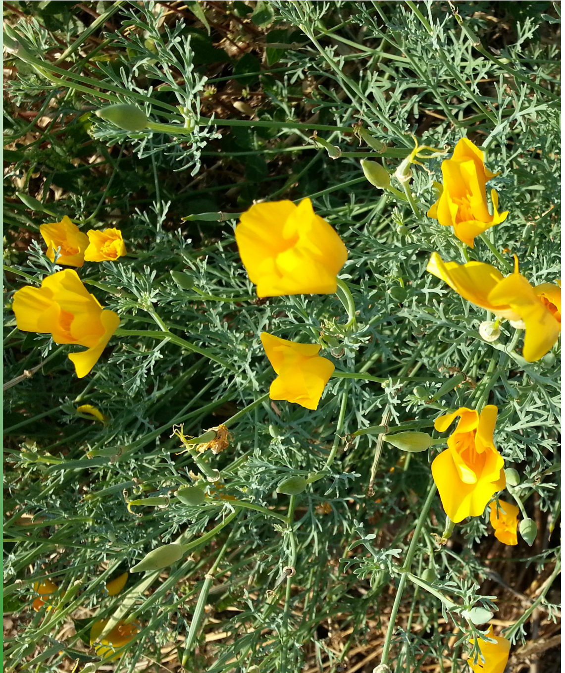
Eschscholzia californica Cham.

Journal of the Croatian Botanical Society