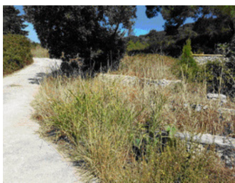
Figure 2. Habitat with Eschscholzia californica Cham. in the Bay of Sutvid on the Pelješac peninsula