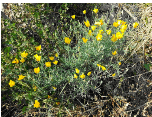
Figure 1. Eschscholzia californica Cham.

Intensive floristic surveys were conducted in July and August 2013 on the Pelješac peninsula and Župa dubrovačka (Dubrovnik-Neretva County, South Croatia), using the standard method described by Nikolić et al. (1998). Phytocoenological relevés were collected using the Braun-Blanquet (1964) approach. Herbarium specimens of Eschscholzia californica (Herbarium ID: ZAGR 33338) and Lonicera japonica (Herbarium ID: ZAGR 33337) are deposited in the Herbarium ZAGR of the Faculty of Agriculture, University of Zagreb (Bogdanović (ed.) 2013).