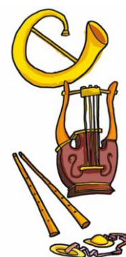
Instrumentos musicales de la Antigua Grecia.