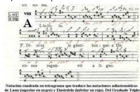
Notación cuadrada en tetragrama que traduce las notaciones adlastemáticas de Laon (superior en negro) y Einsiedeln (inferior en rojo). Del Graduale Triplex