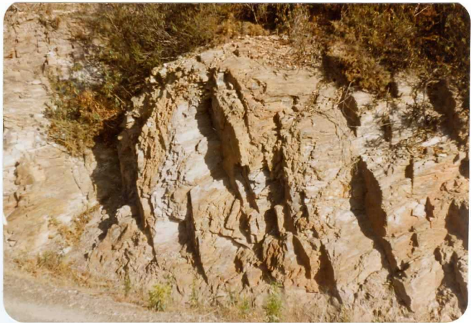
10-38-AD-DN-453: Aspecto de las tobas de la Formación Manganesífera .