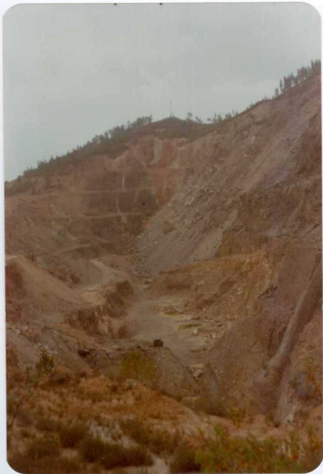
10-38-AD-CO-243: Corta de la mina Concepción, desde poniente.