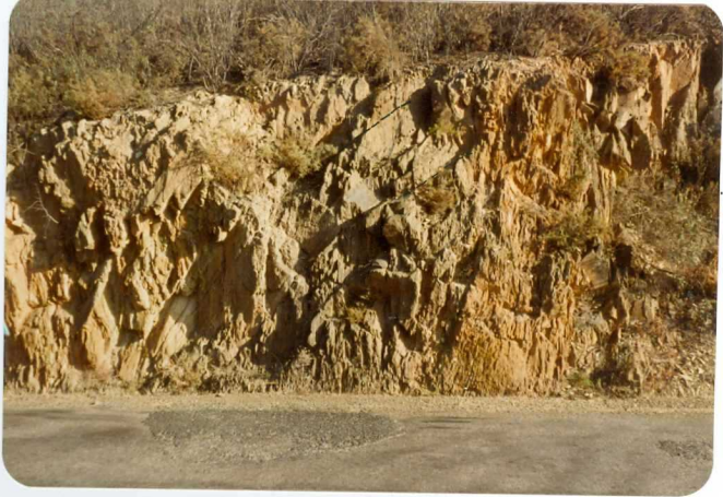
-10-38-AD-DN-455: Pliegue de tipo concéntrico con esquistosidad de plano axial de 1ª fase ( S_1 ) en pizarras de facies Culm. Viseiense Superior.