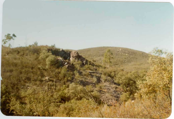
10-38-AD-DN-454: Lentejón de jaspe, con mineralización de man ganeso en la Formación Manganesífera.