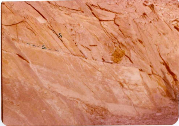
10-38-AD-CO-240: Estratificación ( S_0 ) y esquistosidad ( S_1 ) - en pizarras carboníferas. La S_1 buza más que la S_0 . En el km 9 de la Ctra. Dehesa- Campo frío.