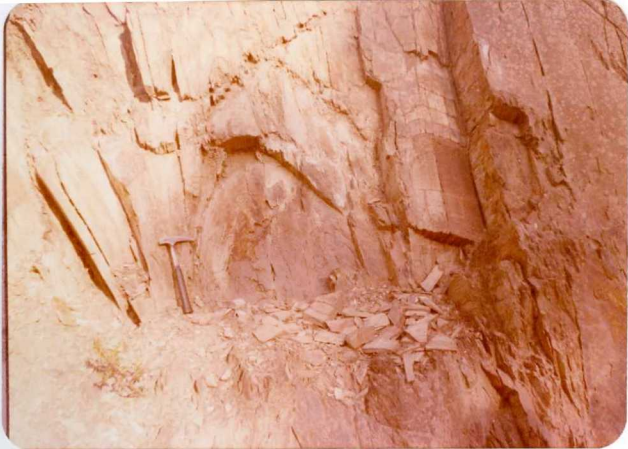
10-38-AD-CO-241: Pliegues asimétrico con la rama que buza al sur más empinada que la norte. Escala métrica. En el Carbonífero de la Dehesa.