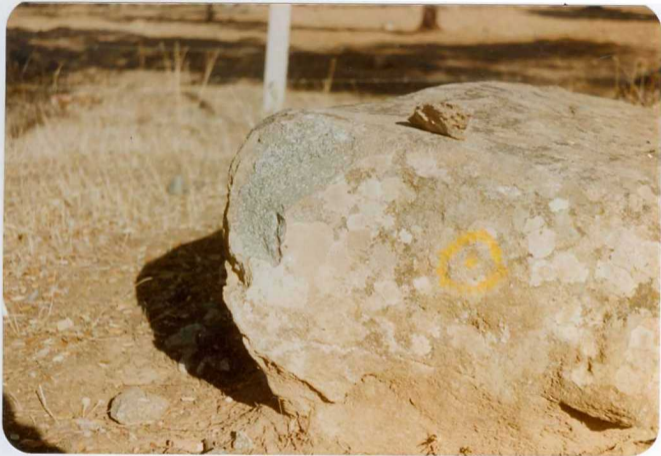
·10-38-AD-DN-452: Aspecto típico del gabro del norte de la Ho ja . Empalme de Sta Eulalia.