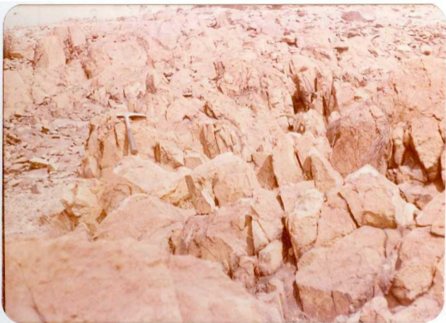
10-38-AD-CO-232: Lavas ácidas porfídicas masivas, diaclasadas, de pátina blanco-amarillenta. En la carretera que va al norte del cementerio de La Naya.