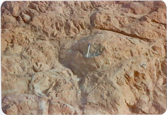
10-38-AD-CO-234: Pillow lava en rocas volcánicas básicas. Ctra. Zalamea a Calañas.