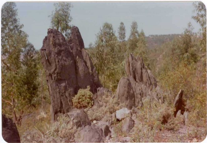
10-38-AD-CO-235: Crestones de tobas verde-violetas. A 5 km al este de Zalamea.