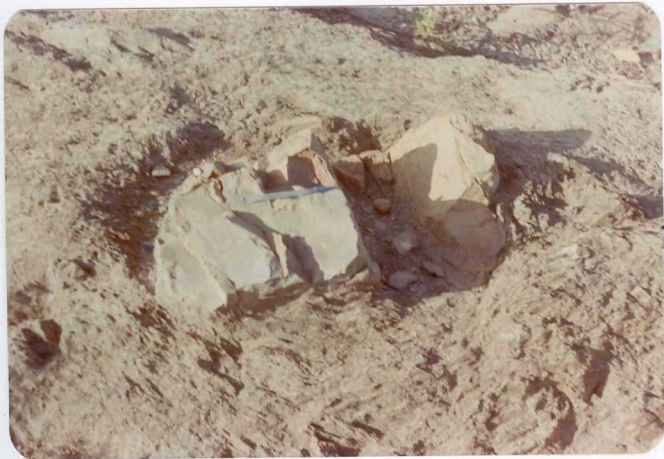
10-38-AD-CO-231: Lentejón cuarcítico de 60 x 30 cm entre pizarras, alargado y orientado según la esquistosidad. Cerca de la aldea de Traslasierra.