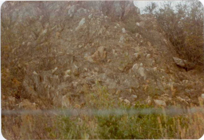
10-38-AD-CO-233: Aglomerado del volcanismo ácido inicial con cantos lávicos de más de 10 cm, orientados según la esquistosidad. En el extremo orien tal de la corrida de Soloviejo.