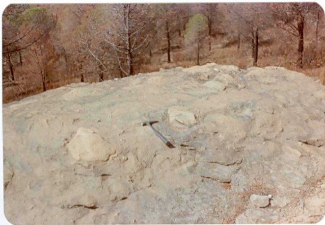
10-38-AD-CO-236: Aglomerado básico con clastos de lava ácida. Cerca ctra. Nerva al Madroño.