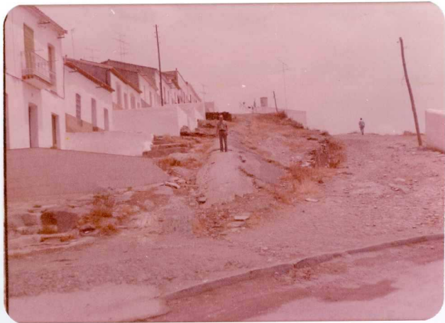
10-38-AD-CO-238: Anticlinal asimétrico en las pizarras carboníferas de Nerva.