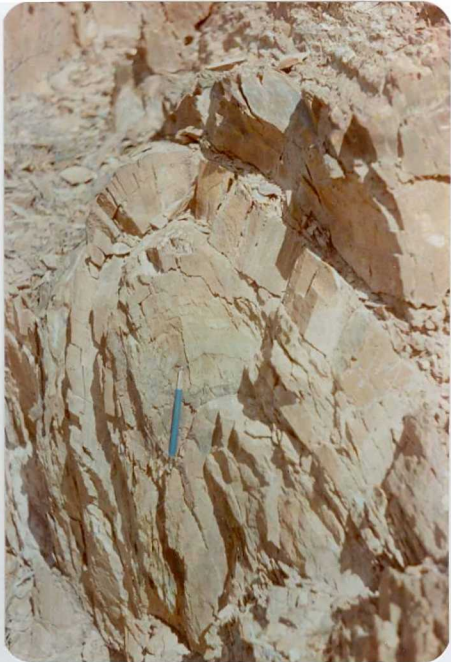
10-38-AD-CO-242: Anticlinal métrico volcado al sur en gra u cas carboníferas. En la vía del ferrocarril cerca de la mina Pepito.