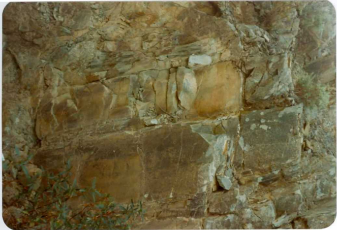
10-38-AD-DN-450: Alternancia de pizarras y grauvacas en facies Culm del Viseiense Superior. Bancos de grauvacas de hasta 1 m de potencia.