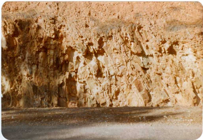
10-38-AD-DN-451: Serie de cuarcitas del Devónico Superior - Carbonífero Inferior (Formación Zámalea). Pliegue de tipo angular, apretado, de 1ª Fa se.