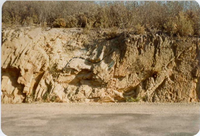
10-38-AD-DN-456: Pliegue de 2a fase en pizarras de facies - Culm del Viseiense Superior.