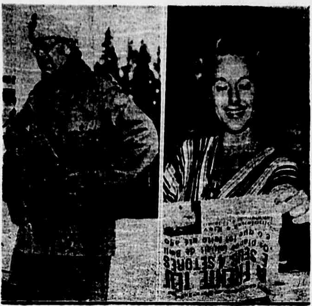
Grace Moore, num instante feito por ocasião de sua visita ao Rio; à esquerda o príncipe G. Adolfo

AMSTERDAM, 26 (Reuters) — O acidente contra a "Royal Dutch" (Linha Aérea Real Holandesa) acabou de confirmar as notícias do desastre ocorrido com o avião no aeroporto de Kastrop, na Dinamarca, hoje à tarde. O avião, que levava o príncipe Gustavo Adolfo, filho do rei da Suécia, seu ajudante de ordens, o capitão sueco, a cantora lírica dinamarquesa, Grace Moore, e outros passageiros, caiu em um campo de trigo, a uma altura de 50 metros, pouco antes de atingir o solo. O avião sinistrado era comandado pelo capitão sueco, e estava com 22 passageiros e 16 tripulantes. O acidente ocorreu às 23h da tarde, hora da Dinamarca. Algumas testemunhas dizem que ao que parecia o piloto automaticamente o avião entrou em espiral contra o solo e que ao cair o avião, explodiu e se incendiou.