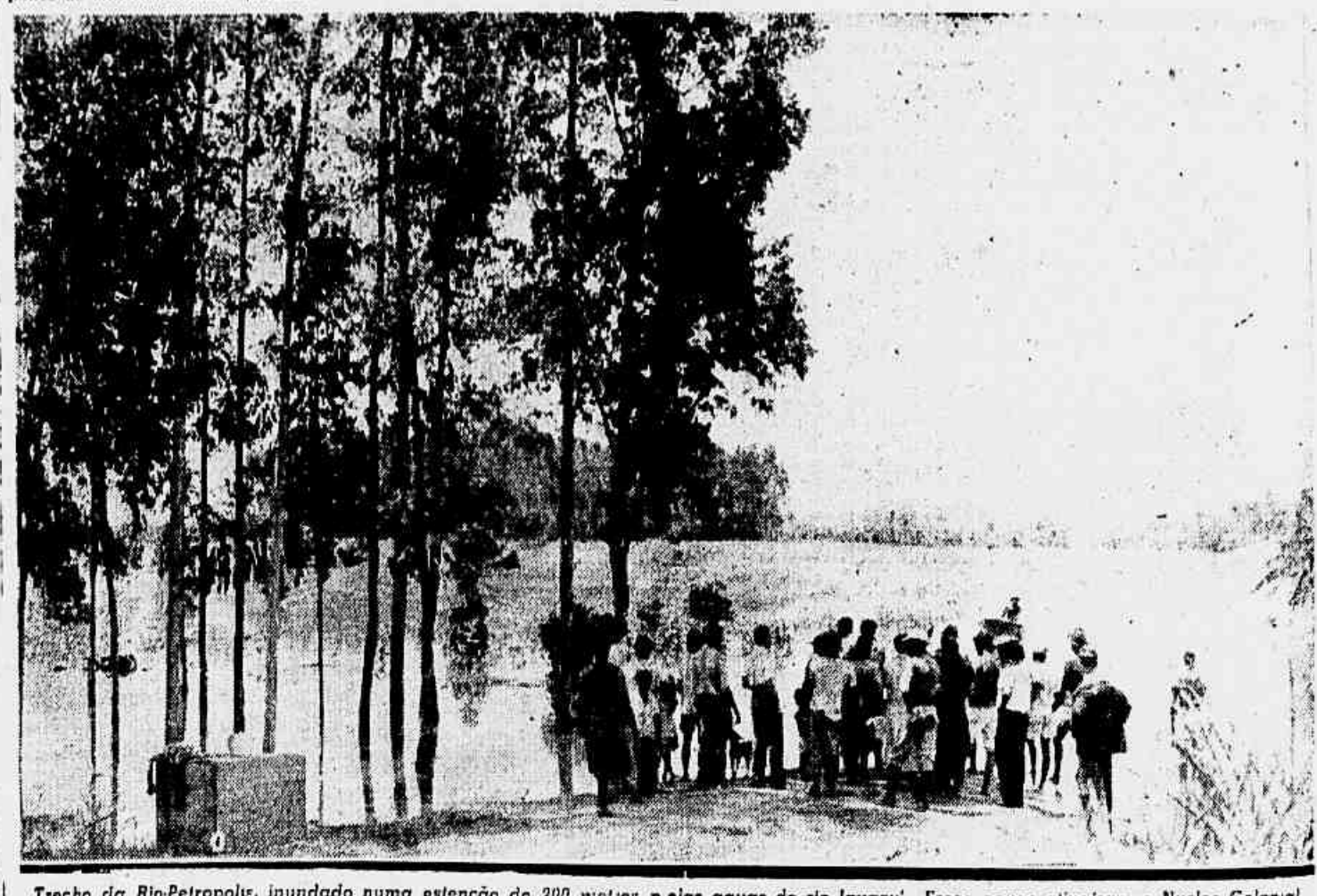
Trecho da Rio-Petropolis, inundado numa extensão de 200 metros pelas aguas do rio Iguacu'. Essas aguas atingiram o Nucleo Colonial de São Paulo, causando graves prejuizos aos colonos, que perderam suas roças e suas habitações

COMPRAR POR MENOS E HUMANO! MAS, POR MENOS QUE NA insinuante É HUMANAMENTE IMPOSSIVEL