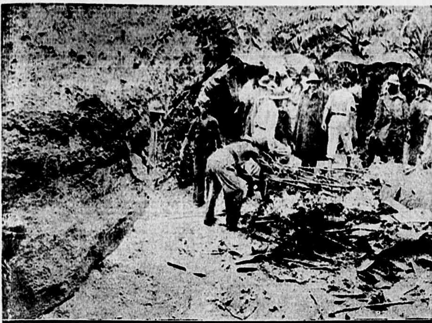
No local do tragico acidente ocorrido sabado, pela madrugada, na travessa Palmeirinha, em S. Gonçalo, foi colhido e flagrantemente fotografado acima pela reportagem do DIARIO DA NOITE, vendo-se os bombeiros removendo os escombros sob os quais ficou soterrada uma familia inteiramente em consequencia da queda de um pedaco do rochedo