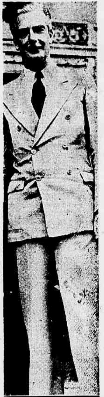
A Câmara dos Deputados recebeu, nesta-feira a tarde, uma das personalidades internacionais de mais evidência nesta congestionada cidade do século, Anthony Eden, o ex-titular do Foreign Office, o homem que primeiro enfrentou a colera de Hitler, o ex-geral e doutrina de apaziguar, firme e Alemanha nazista de 39, entrou em contato com os parlamentares brasileiros num amável "tête-à-tête" com aqueles que representam a Democracia em nossa notável fase política.