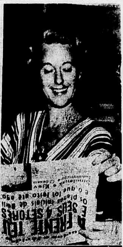
Grace Moore, num flagrante feito por ocasião de sua visita ao Rio; à esquerda o príncipe G. Adolfo