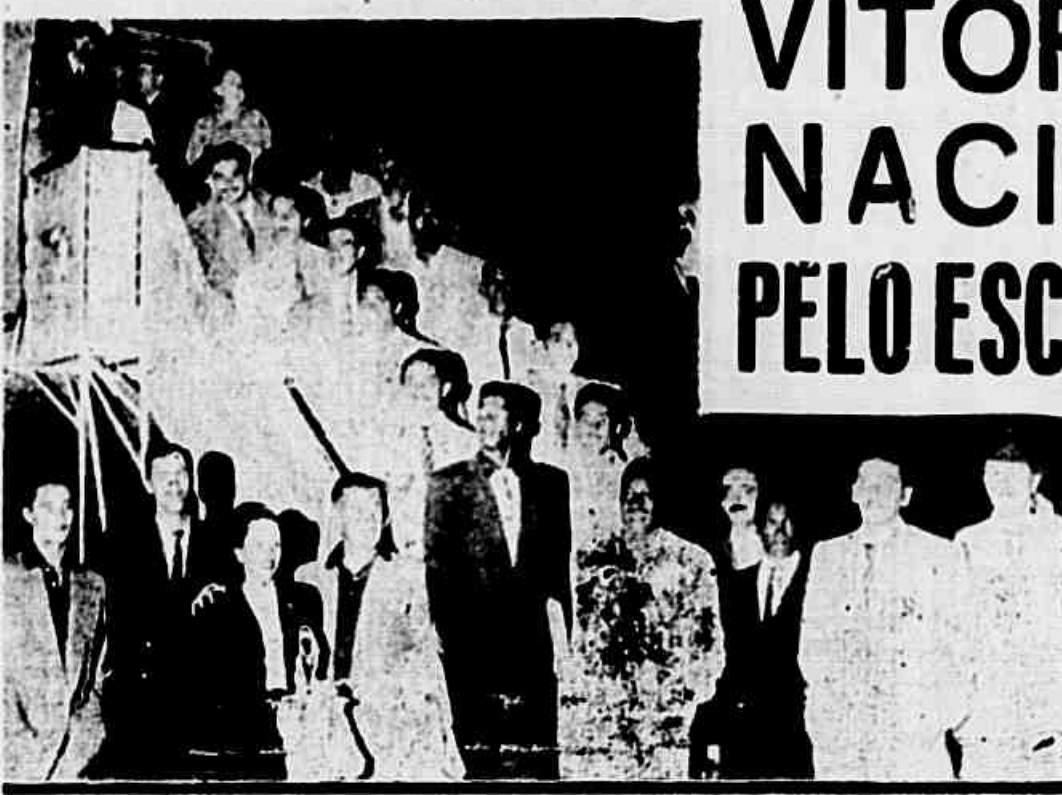
O VASCO EM MONTEVIDEO. A gravura lista o primeiro flagrante dos vascaínos em Montevideo. Vêem-se os componentes da delegação carioca, ao descer do avião que os conduziu, ainda no aeroporto de Carrasco. Ontem, depois de uma viagem precedida de incidentes que causaram verdadeira guerra de nervos entre os seus "cracks", estreou o Vasco, contra o Nacional, famoso conjunto uruguaio