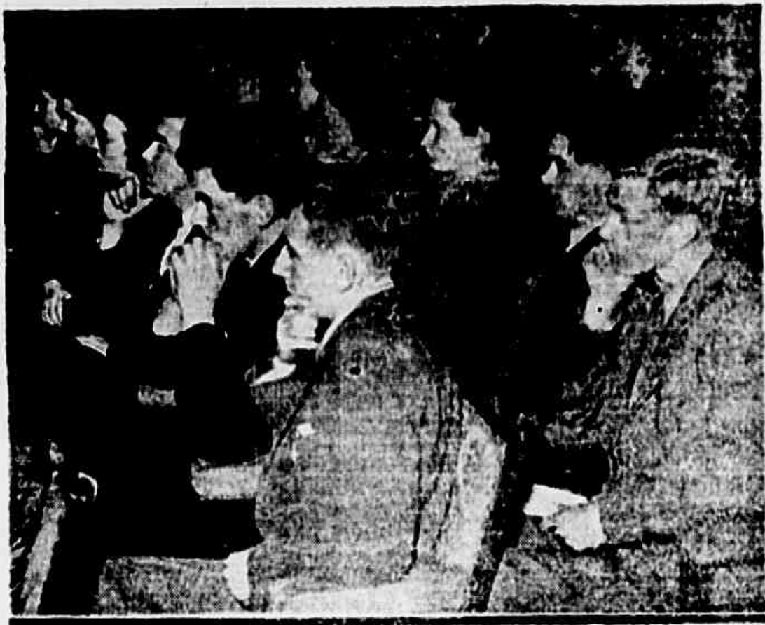
Jovens ingleses debatem problemas da paz mundial

o Por Charles SYMINGTON Copyright do H. N. S., especial para o DIÁRIO DA NOITE