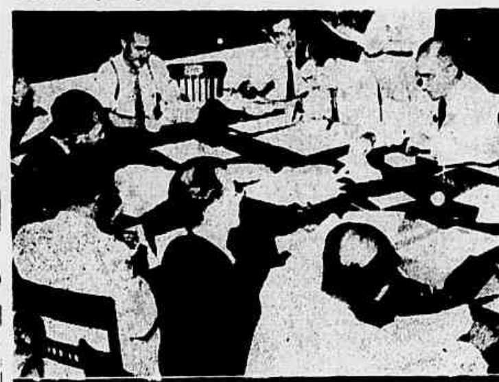
A MARCHA DAS APURAÇÕES: - O flagrantíssimo fixa um detalhe das apurações eleitorais nesta capital, onde, como em toda parte, foram assinados surpreendentes resultados

A fase final da apuração do pleito nos Estados já está indicando a necessidade da remodelação nos quadros da política nacional, pautada no resultado das urnas. Encerrando-se no próximo dia 31 a convocação extraordinária do Congresso, estará o presidente Dutra com as mãos desimpedidas para melhor ajustar os interesses políticos do seu governo, movido por tais e quais pedras, de acordo com os interesses e circunstâncias que naturalmente surgirem, ao mesmo tempo que os Estados se reajustam com governadores eleitos e as Assembleias dão início ao seu trabalho constituinte.