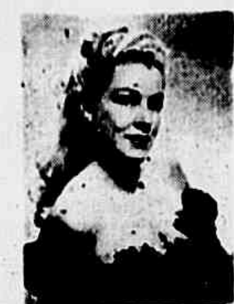
laire Trevor é a "estrela" de "Museu de Horrores" e "Drad- in Than The Male".