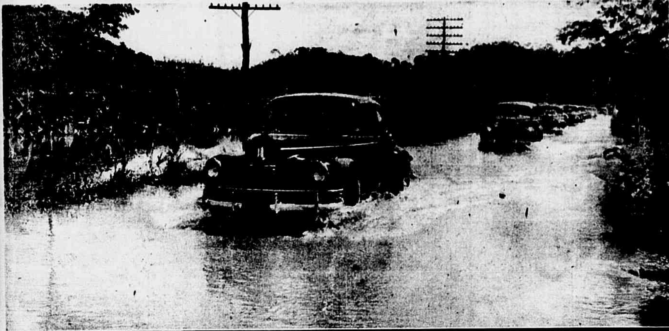
Na Estrada 5 de Julho, varios colonos, trazidos em canoas, aguardam a chegada de embarcações com seus haveres salvos da inundação