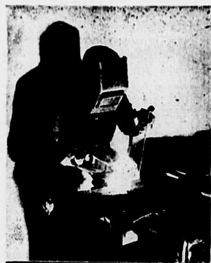
Soldado que perdeu um braço, trabalhando como soldado

RADIOS Vista e a prestação sem fio A B Mourinho & Co Ltda AVENIDA STRECH 428 e 430 TELEFONE 22-2838