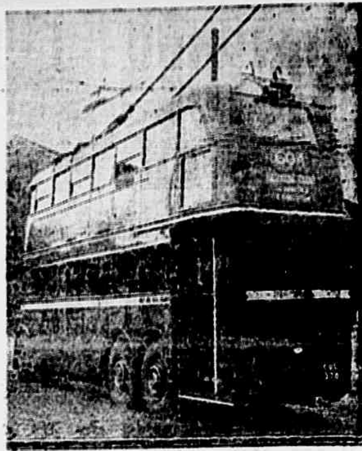
Um dos ônibus elétricos utilizados em Londres