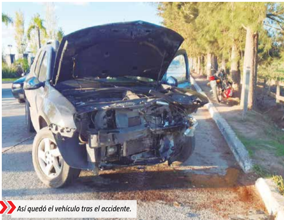
Así quedó el vehículo tras el accidente.

La mujer de 51 años culminó con varios politraumatismos y heridas de gravedad por lo que debió ser hos-