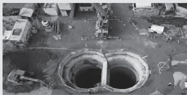
La estación elevadora que se construye en Temperley. En Esteban Echeverría habrá una de similares características.

El Sistema de Agua Sur comprende una serie de obras que se proyectaron para asegurar el abastecimiento de agua potable en Almirante Brown, Esteban Echeverría, Ezeiza, La Matanza, Lomas de Zamora y Quilmes, beneficiando a 2 millones y medio de personas. Para