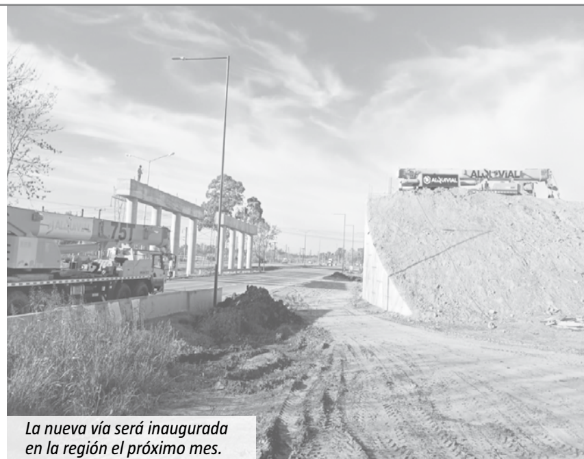
La nueva vía será inaugurada en la región el próximo mes.

El proyecto de la Autopista Presidente Perón fue lanzado en el año 2010 y hasta el año 2015 registraba un avance del 23%. Luego se registraron avances durante la gestión de Cambiemos y tomaron un nuevo impulso a partir de mayo de 2020, según informaron desde el ministerio de Obras Públicas de la Nación.