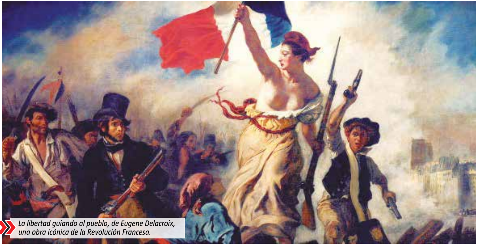
La libertad guiando al pueblo, de Eugène Delacroix, una obra icónica de la Revolución Francesa.

El dato de inflación de 8,4% registrada por el INDEC en abril sonó como un puñetazo sobre la mesa cuando terminaba la semana el pasado viernes. La cifra anualizada es del 108%: lo que en abril de 2022 salía 5 mil pesos hoy sale más de 10 mil pesos. Lo peor es que la tendencia es de aceleración, y que es poco probable que los precios detengan su escalada en el corto plazo.