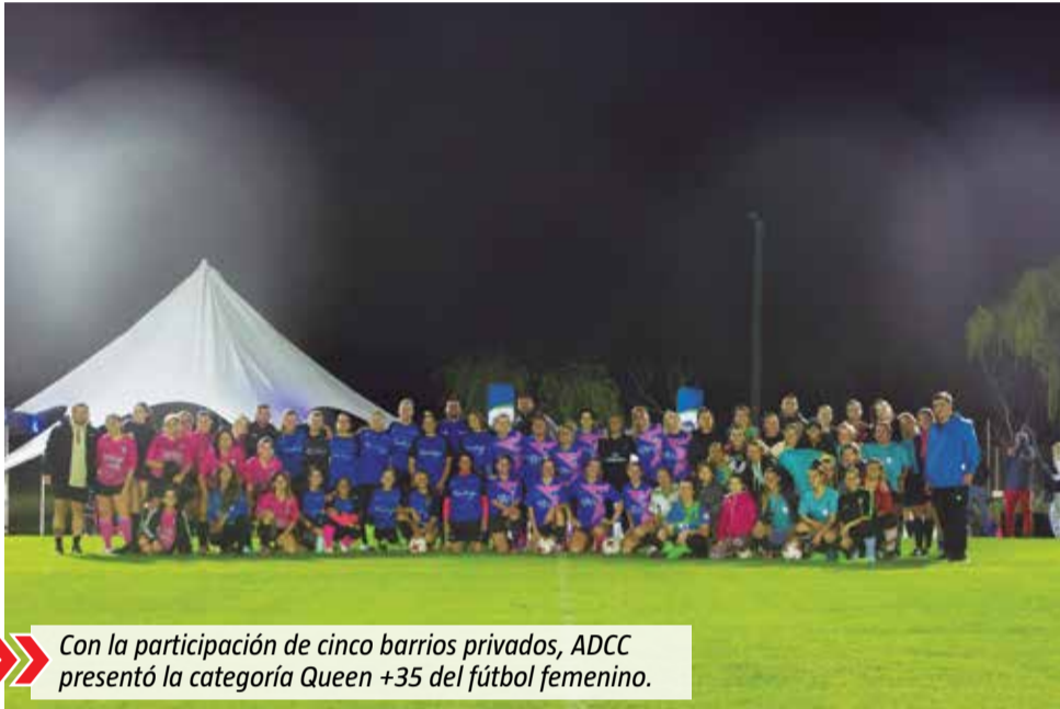
Con la participación de cinco barrios privados, ADCC presentó la categoría Queen +35 del fútbol femenino.

El anuncio de la incorporación de la división para mujeres mayores de 35 años se hizo con un torneo relámpago disputado esta semana en Terralagos. También dieron a conocer que habrá una sub12 para niñas.