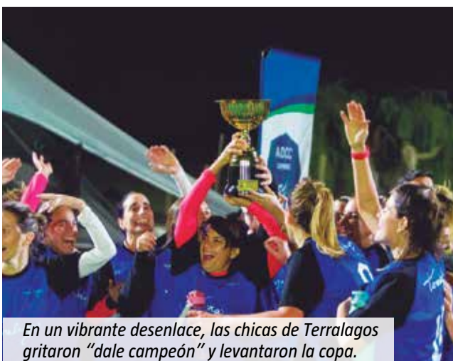
En un vibrante desenlace, las chicas de Terralagos gritaron "dale campeón" y levantaron la copa.