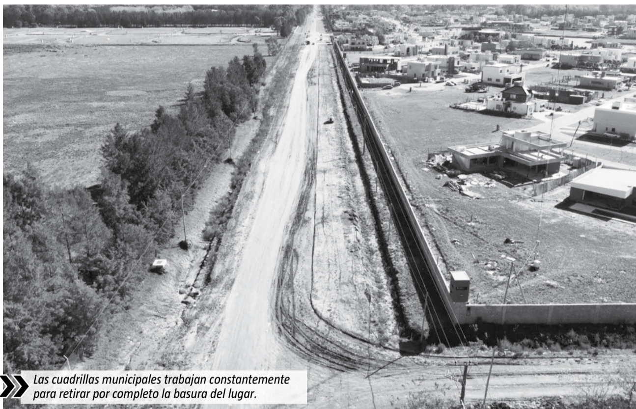
Las cuadrillas municipales trabajan constantemente para retirar por completo la basura del lugar.

En el lugar, los equipos de la secretaría de Servicios Públicos local y de las delegaciones de Monte Grande Sur y Canning llevan adelante los operativos de limpieza con una retroexcavadora, una pala, una motoniveladora y dos camiones, según informaron