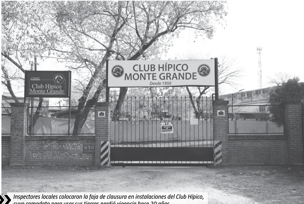
Inspectores locales colocaron la faja de clausura en instalaciones del Club Hípico, cuyo comodato para usar sus tierras perdió vigencia hace 20 años.

En concreto, en el Municipio aseguran haber ofrecido al Club Hípico tres predios diferentes para que se muden a lo largo de los años. La última oferta fue