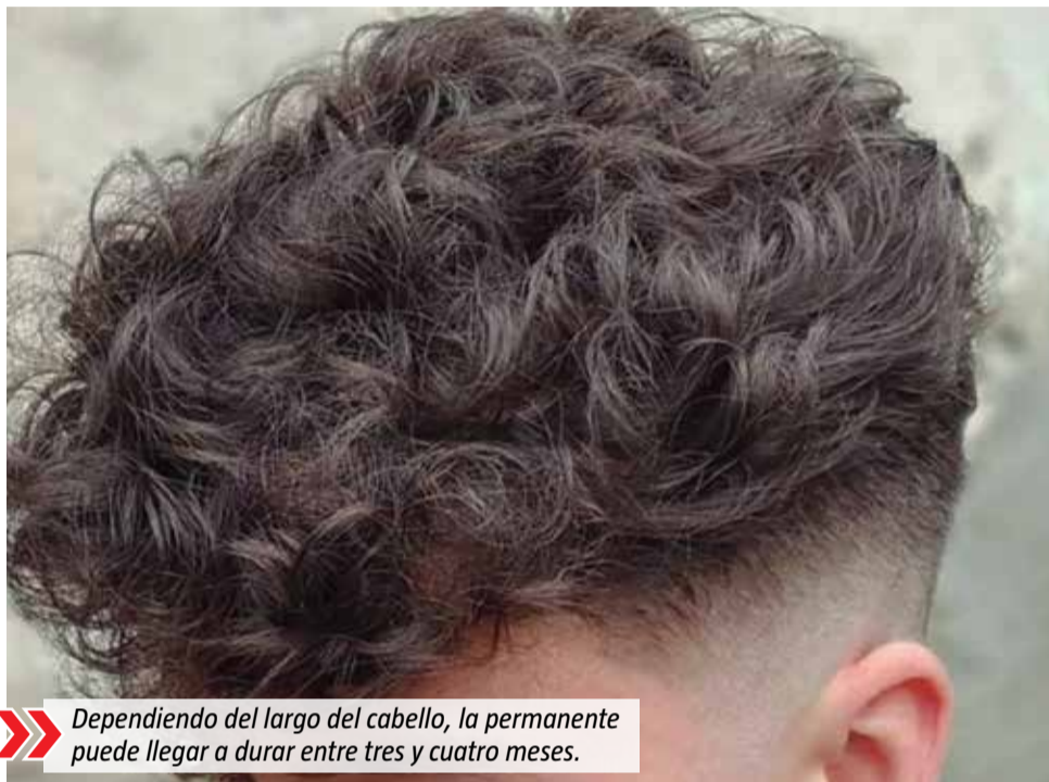
Dependiendo del largo del cabello, la permanente puede llegar a durar entre tres y cuatro meses.