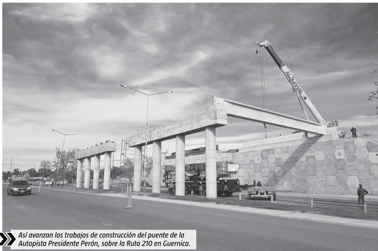
Así avanzan los trabajos de construcción del puente de la Autopista Presidente Perón, sobre la Ruta 210 en Guernica.

Otro pendiente es el puente sobre la Ruta 210, a la altura de Guernica. En ese sentido, el martes último comenzaron a llevarse adelante las tareas para la construcción del puente.