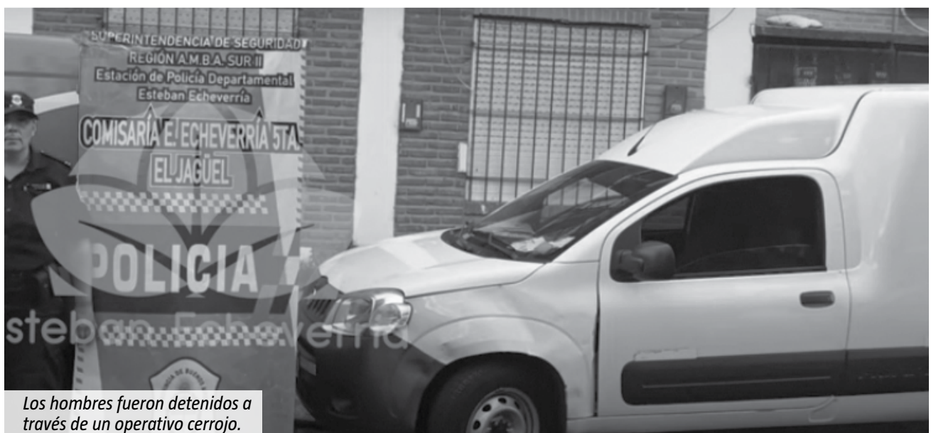
Los hombres fueron detenidos a través de un operativo cerrojo.

Los delincuentes habían robado dos vehículos en Monte Grande y fueron capturados gracias a las imágenes de las cámaras de seguridad del Municipio.