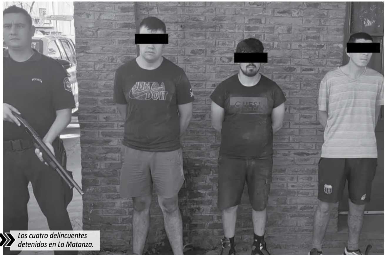
Los cuatro delincuentes detenidos en La Matanza.

Los efectivos policiales pidieron refuerzos para realizar un allanamiento de urgencia en el terreno donde se encontraban los malvivientes. Pocos minutos después llegaron varios