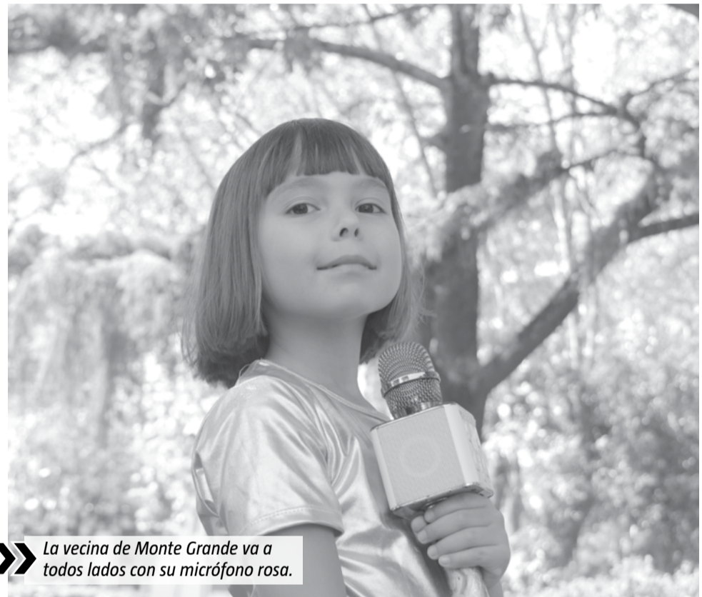
La vecina de Monte Grande va a todos lados con su micrófono rosa.