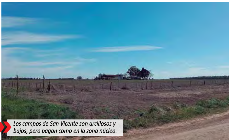
Los campos de San Vicente son arcillosos y bajos, pero pagan como en la zona núcleo.

Rural de San Vicente en el que analiza las subas en diferentes parcelas de campos tomadas como caso testigos. Algunos ejemplos. En un establecimiento de 294 hectáreas pagaron en 2023 cada una de las cuatro cuotas del impuesto inmobiliario rural $226 mil. En 2024, ese mismo establecimiento pagará $813 mil pesos cada cuota, redondeando un aumento del 360%. Uno de 113 hectáreas, pasó de $35 mil a $128 mil. Otro de 880 hectáreas, de $912 mil a $4 millones. Y la lista de ejemplos sigue, con aumentos en promedio por 404%, según detallaron desde la entidad.