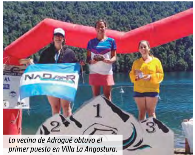
La vecina de Adrogué obtuvo el primer puesto en Villa La Angostura.

“Tuve a mi hijo y ahora retomé mis entrenamientos, pero no en forma tan profesional. Las prioridades cambian y a los 50 años es difícil mantener un nivel tan alto, pero hago lo que me apasiona”, aseguró la vecina de Adrogué. Y concluyó: “Son muchísimas las carreras que llevo grabadas en mi historia y en mi memoria”.