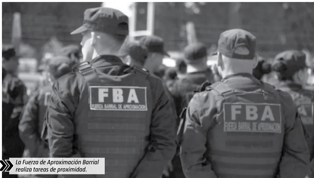
La Fuerza de Aproximación Barrial realiza tareas de proximidad.

“La seguridad de las vecinas y los vecinos es prioridad en nuestra gestión. El