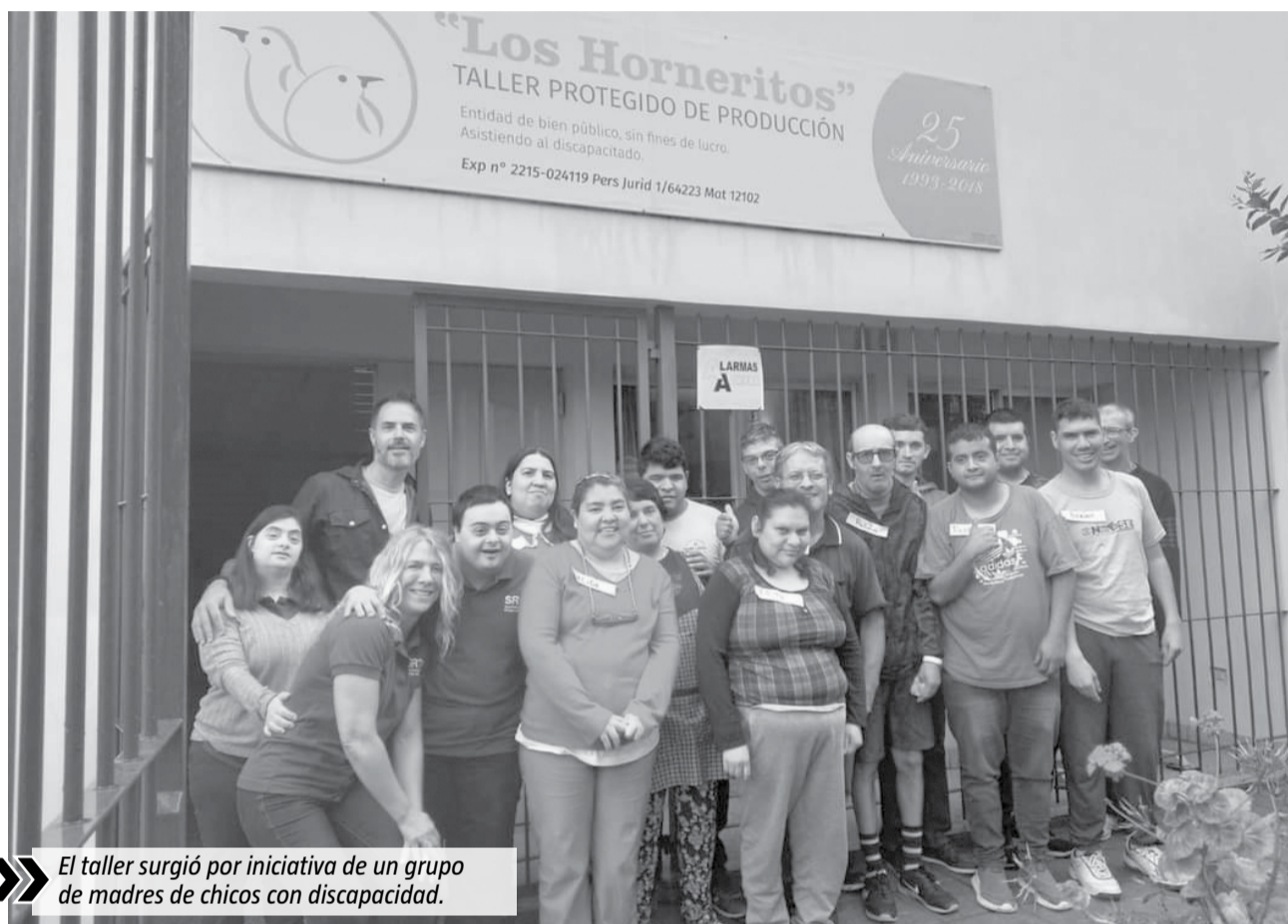
El taller surgió por iniciativa de un grupo de madres de chicos con discapacidad.

Es por esto que desde la organización tomaron la decisión que lanzar una "campaña de socios".