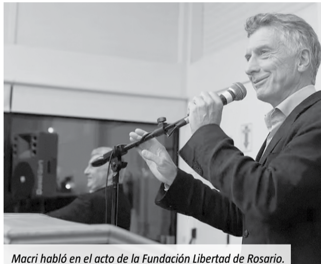
Macri habló en el acto de la Fundación Libertad de Rosario.

El ex presidente Mauricio Macri habló sobre Javier Milei en un acto que se realizó en Rosario: “La sociedad votó a alguien ajeno al sistema político, es un verdadero outsider. Es él, su hermana y las redes sociales”