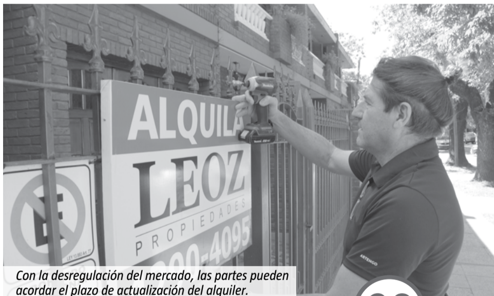
Con la desregulación del mercado, las partes pueden acordar el plazo de actualización del alquiler.

quien elaboró otro informe que muestra el aumento de la oferta. "Las viviendas más pequeñas son las más demandadas, y las más preferidas por los inversores. Con la derogación de la Ley de Alquileres, que las hacía menos atractivas en términos de rentabilidad, ahora experimentan un resurgimiento en la oferta de alquiler debido a una mayor flexibilidad en los contratos", sostuvo.