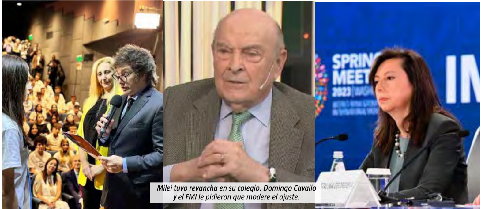
Milei tuvo revancha en su colegio. Domingo Cavallo y el FMI le pidieron que modere el ajuste.

Milei está operando sin anestesia. No puede ser una sorpresa para nadie. El Presidente lo dijo en la campaña electoral. Es cierto, motosierra en mano, gritaba que el ajuste lo iba a pagar la casta. Pero siempre quedó claro que bajarles el sueldo a los diputados o sacarles los choferes eran solo gestos de la "guerra contra la casta", nada más. La "normalización" macroeconómica la están pagando principalmente los jubilados, con salarios mínimos de 150 dólares en un país en el que el cortado en jarrito ya sale dos dólares.