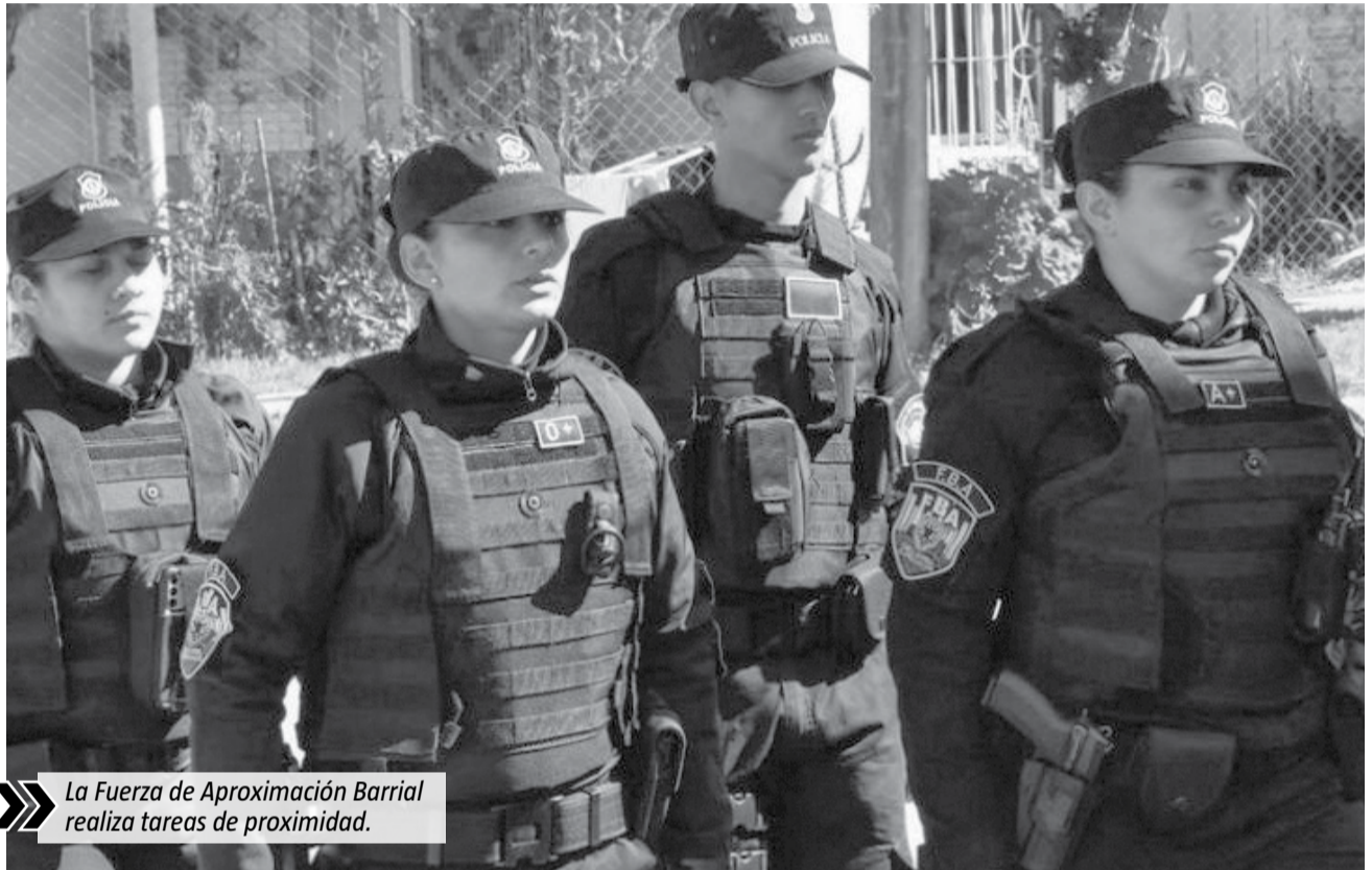
La Fuerza de Aproximación Barrial realiza tareas de proximidad.

Cada semana, personal de la Guardia Urbana local y agentes de la Policía bonaerense realizan operativos de control vehicular, saturación y prevención del delito en diferentes puntos del distrito. En el municipio, la flota de seguridad cuenta con 102 patrulleros y 15 motos de la Policía bonaerense, 50 móviles de la Guardia Urbana y también vehículos de la Dirección Departamental de Investigaciones (DDI) y de Gendarmería Nacional. Asimismo, Esteban Echeverría tiene más de 1.650 cámaras de seguridad y domos con visualización de 360° en funcionamiento, y 70 paradas seguras y tótems equipados con dispositivos de videovigilancia e intercomunicadores que facilitan la asistencia en casos de emergencia y seguridad.