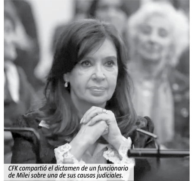
CFK compartió el dictamen de un funcionario de Milei sobre una de sus causas judiciales.