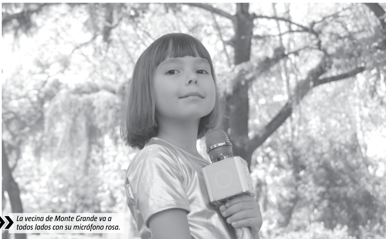
La vecina de Monte Grande va a todos lados con su micrófono rosa.

En ese sentido, contó que ayuda a "Los Peques de Santa Lucía", donde funciona un comedor comu-