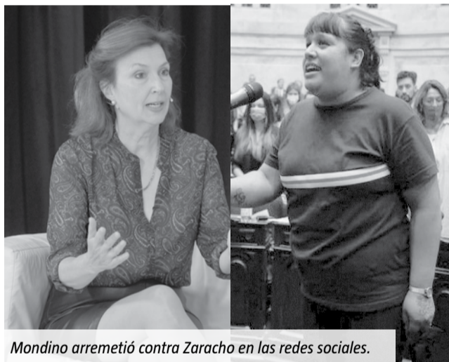
Mondino arremetió contra Zaracho en las redes sociales.

La canciller Diana Mondino mantuvo un fuerte cruce en las redes sociales con la diputada nacional Natalia Zaracho, del espacio de Juan Grabois tras la respuesta que la cartonera le había hecho a un periodista.