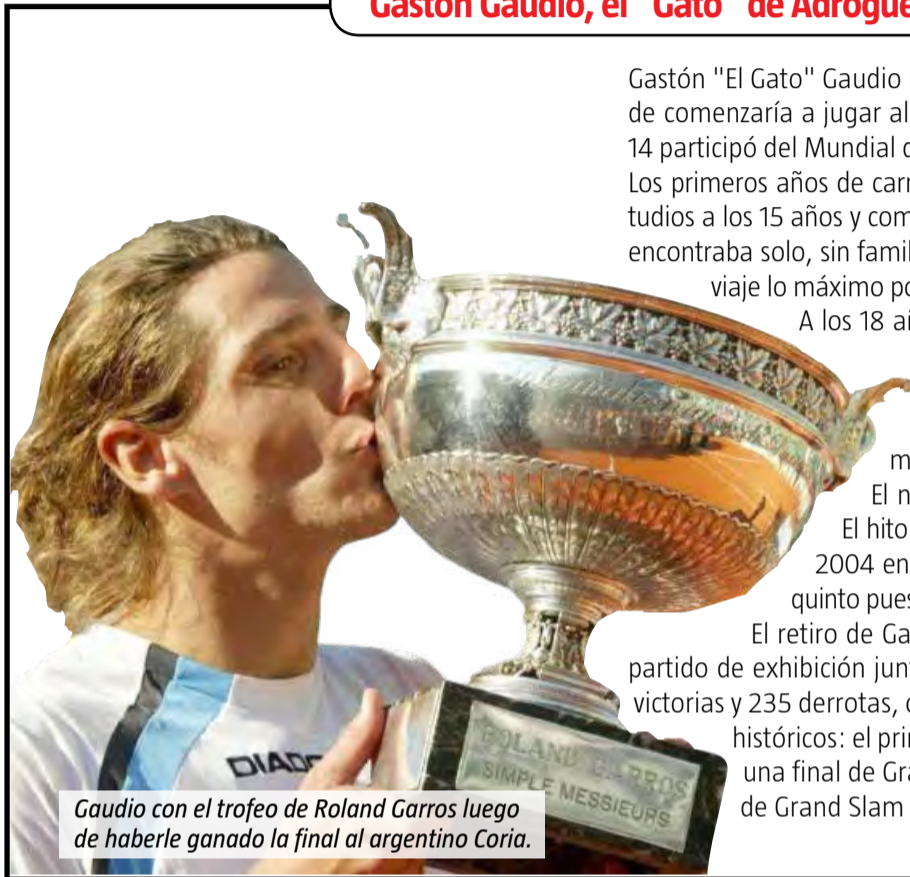
Gaudio con el trofeo de Roland Garros luego de haberle ganado la final al argentino Coria.

Gastón "El Gato" Gaudio nació el 9 de diciembre de 1978 en la ciudad de Adrogué, donde comenzaría a jugar al tenis desde los 4 años, para ser federado a los 8 años. A sus 14 participó del Mundial de Menores en Japón, junto a su compañero Mariano Puerta. Los primeros años de carrera de Gaudio fueron difíciles, ya que debió abandonar los estudios a los 15 años y comenzar sus giras por todo el mundo, en las que normalmente se encontraba solo, sin familia, y buscando los hoteles más baratos para poder extender su viaje lo máximo posible, según relató en numerosas oportunidades.