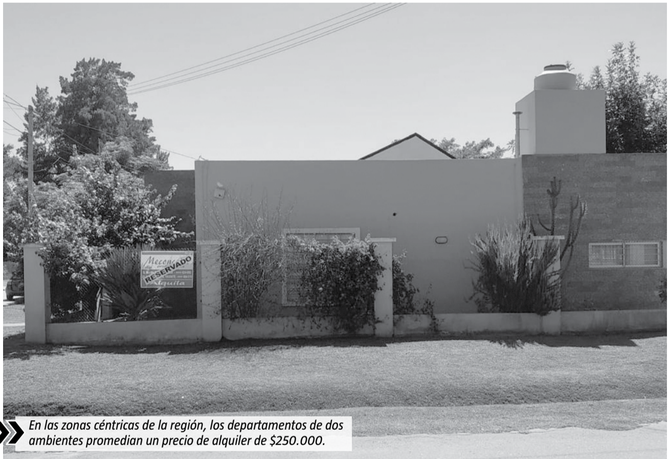
En las zonas céntricas de la región, los departamentos de dos ambientes promedian un precio de alquiler de $250.000.