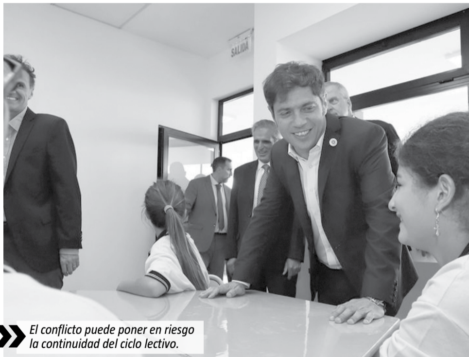
El conflicto puede poner en riesgo la continuidad del ciclo lectivo.

Ese es uno de los puntos más calientes del conflicto que enfrenta a las Provincias con el Gobierno de Javier Milei, que desde que llegó al poder disminuyó las transferencias a las distintas jurisdicciones en más de 100.000 millones de pesos, que incluyeron