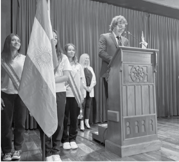
El presidente inauguró el ciclo lectivo en el Colegio Cardenal Copello.

El mandatario, que en ese momento estaba inaugurando el ciclo lectivo de la institución, aclaró que la mujer no fue su maestra con un duro comentario, al calificarla como "farsante y embustera". Ella había dicho que fue su docente en cuarto grado.