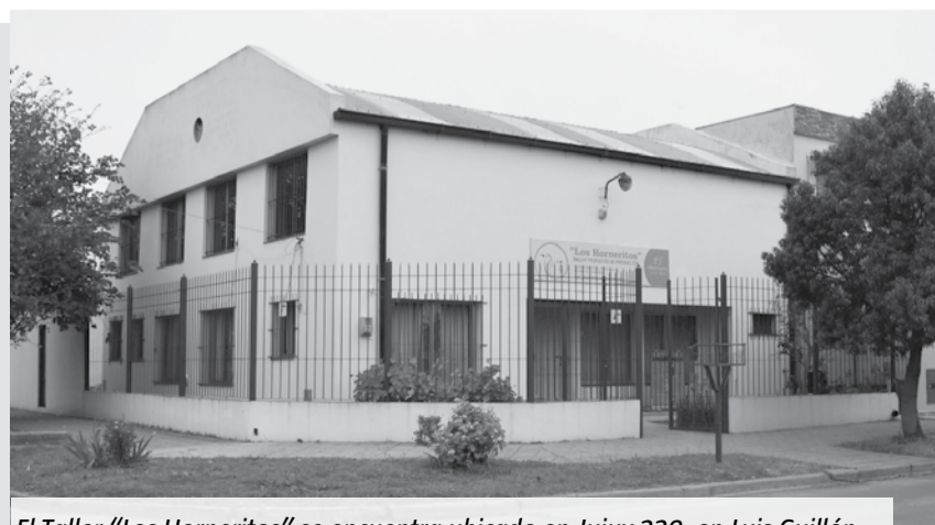
El Taller "Los Horneritos" se encuentra ubicado en Jujuy 239, en Luis Guillón.