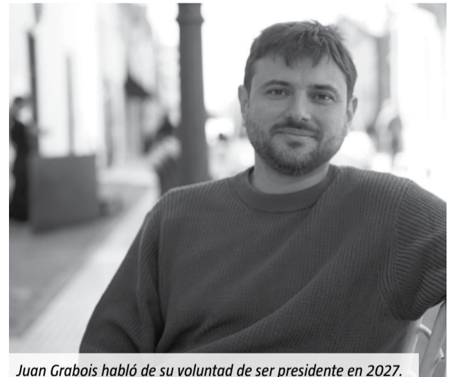
Juan Grabois habló de su voluntad de ser presidente en 2027.

El dirigente Juan Grabois mencionó sobre sus ambiciones electorales en una entrevista radial y dijo que pretende “ser presidente en tres años y medio”.