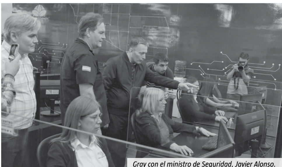
Gray con el ministro de Seguridad, Javier Alonso.

La comuna, además, cuenta con un arco que integra el Anillo Digital de Seguridad y está conformado por cámaras lectoras de patentes que detectan vehículos robados, con chapas de dominio falsas o con pedido de secuestro. Todos los equipos tienen un seguimiento permanente del personal municipal del COM. También consolidó un equipo vinculado al sistema de emergencias, del cual participan las áreas de SAME, Defensa Civil y Bomberos.