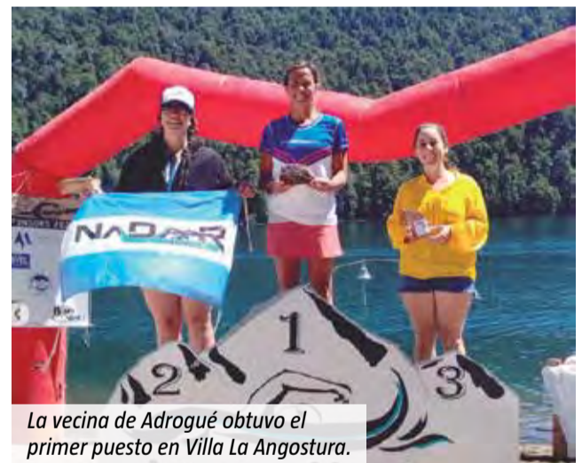
La vecina de Adrogué obtuvo el primer puesto en Villa La Angostura.

“Tuve a mi hijo y ahora retomé mis entrenamientos, pero no en forma tan profesional. Las prioridades cambian y a los 50 años es difícil mantener un nivel tan alto, pero hago lo que me apasiona”, aseguró la vecina de Adrogué. Y concluyó: “Son muchísimas las carreras que llevo grabadas en mi historia y en mi memoria”.