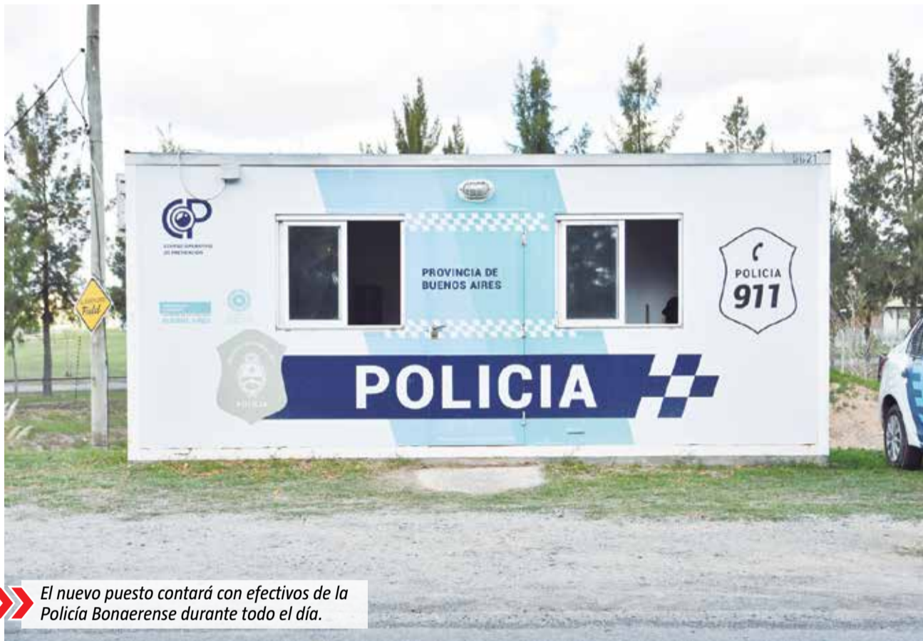
El nuevo puesto contará con efectivos de la Policía Bonaerense durante todo el día.

Según destacaron desde la Secretaría de Protección Ciudadana del gobierno local, este módulo de seguridad tendrá presencia policial las 24 horas, al igual que el que funciona en la curva de El Pampero (en el ingreso a San Vicente por Rivadavia) y sobre la Ruta 210, a la altura del polidepor-