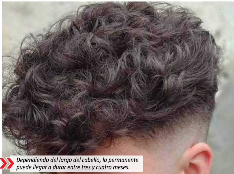
Dependiendo del largo del cabello, la permanente puede llegar a durar entre tres y cuatro meses.