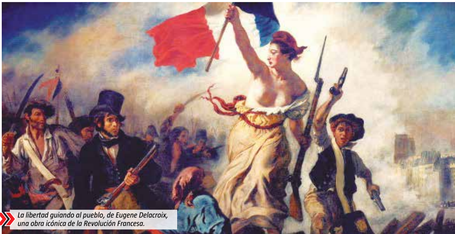
La libertad guiando al pueblo, de Eugene Delacroix, una obra icónica de la Revolución Francesa.

El dato de inflación de 8,4% registrada por el INDEC en abril sonó como un puñetazo sobre la mesa cuando terminaba la semana el pasado viernes. La cifra anualizada es del 108%: lo que en abril de 2022 salía 5 mil pesos hoy sale más de 10 mil pesos. Lo peor es que la tendencia es de aceleración, y que es poco probable que los precios detengan su escalada en el corto plazo.