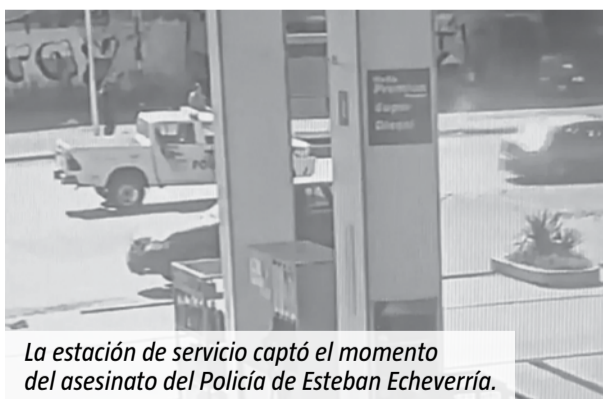
La estación de servicio captó el momento del asesinato del Policía de Esteban Echeverría.

Al frenar los sospechosos, los efectivos bajaron del móvil y a Alvez le dispararon en el cuello. En ese marco, tuvo que ser trasladado al Hospital Bicentenario de Monte Grande, donde finalmente falleció mientras lo operaban.