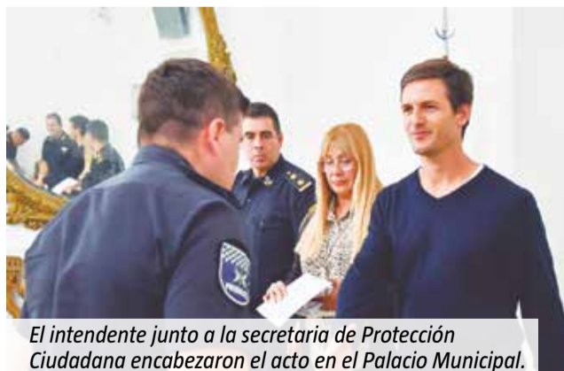
El intendente junto a la secretaria de Protección Ciudadana encabezaron el acto en el Palacio Municipal.

El acto se desarrolló en el salón Gaetani del Palacio Municipal y contó con la presencia de autoridades policiales, municipales y familiares de los agentes destacados. Los miembros de las fuerzas dependientes del Ministerio de Seguridad bonaerense y del Municipio recibieron el diploma que se sumó a un