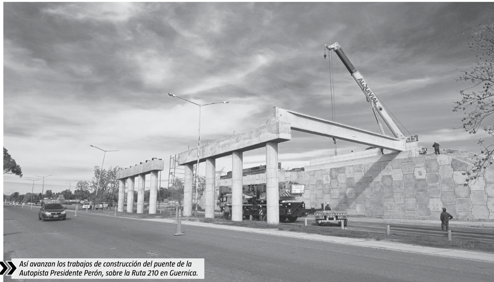
Así avanzan los trabajos de construcción del puente de la Autopista Presidente Perón, sobre la Ruta 210 en Guernica.

Otro pendiente es el puente sobre la Ruta 210, a la altura de Guernica. En ese sentido, el martes último comenzaron a llevarse adelante las tareas