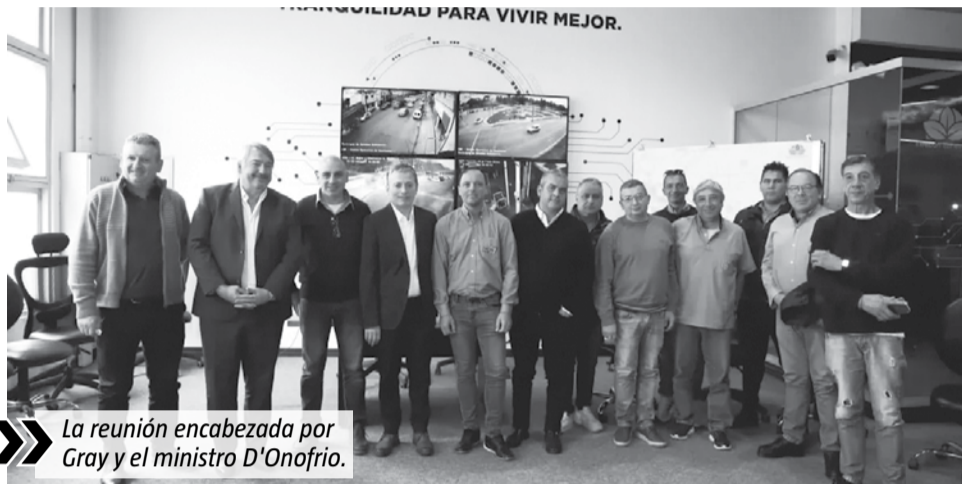
La reunión encabezada por Gray y el ministro D'Onofrio.

Centro Operativo de Monitoreo (COM) ubicado en Robertson 140 (Monte Grande). "Esta medida se suma a los 24 nuevos patrulleros que recibimos la semana pasada y a la inversión tecnológica que venimos realizando desde el Municipio donde ya contamos con más de 1.200 equipos de videovigilancia en funcionamiento y con un sistema de monitoreo de GPS", indicó el intendente. Por su parte, el ministro Jorge D'Onofrio señaló que "estamos trabajando junto con los municipios y las empresas para avanzar en la instalación de los dispositivos de videovi-