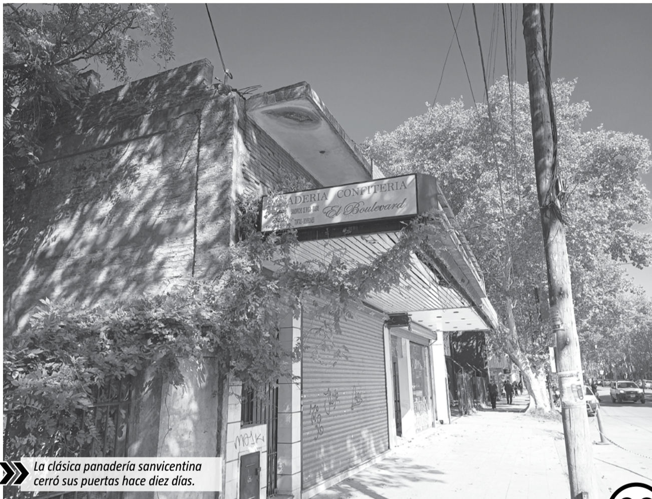
La clásica panadería sanvicentina cerró sus puertas hace diez días.

Sin embargo, todo tiene un fin y el horno tuvo que ser apagado hace unos días luego del cierre de la panadería. La temperatura está descendiendo lentamente: este jueves, cuando El Diario Sur visitó "la cuadra" de la pana-