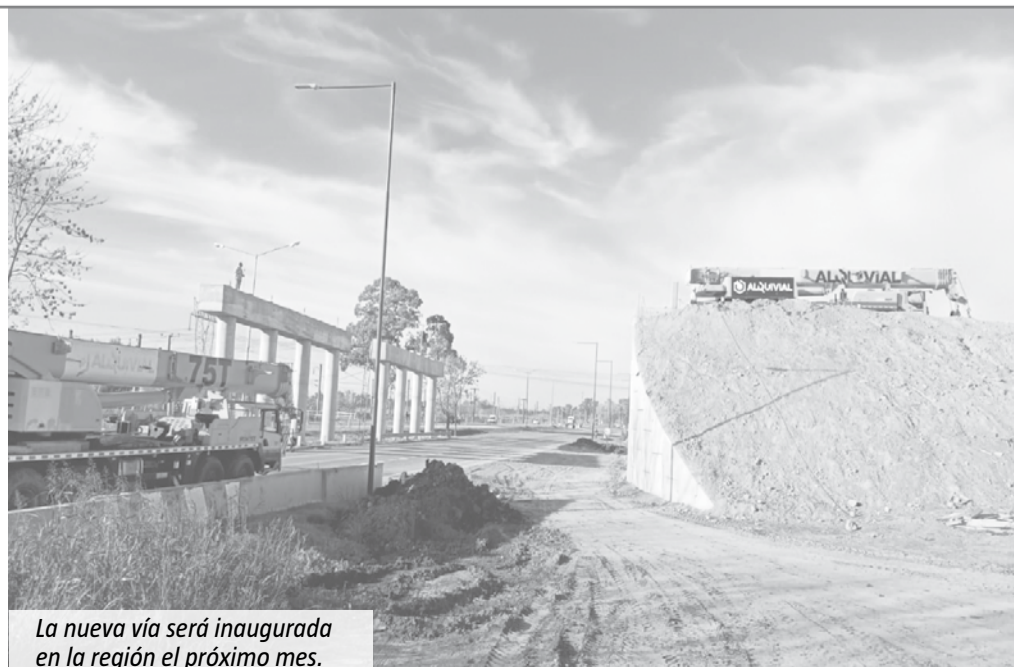
La nueva vía será inaugurada en la región el próximo mes.

El proyecto de la Autopista Presidente Perón fue lanzado en el año 2010 y hasta el año 2015 registraba un avance del 23%. Luego se registraron avances durante la gestión de Cambiemos y tomaron un nuevo impulso a partir de mayo de 2020, según informaron desde el ministerio de Obras Públicas de la Nación.