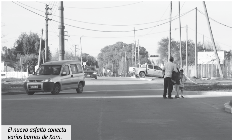
El nuevo asfalto conecta varios barrios de Korn.

El pavimento de la calle Payadores Indios Bares permitirá conectar los barrios de Santa Ana, San