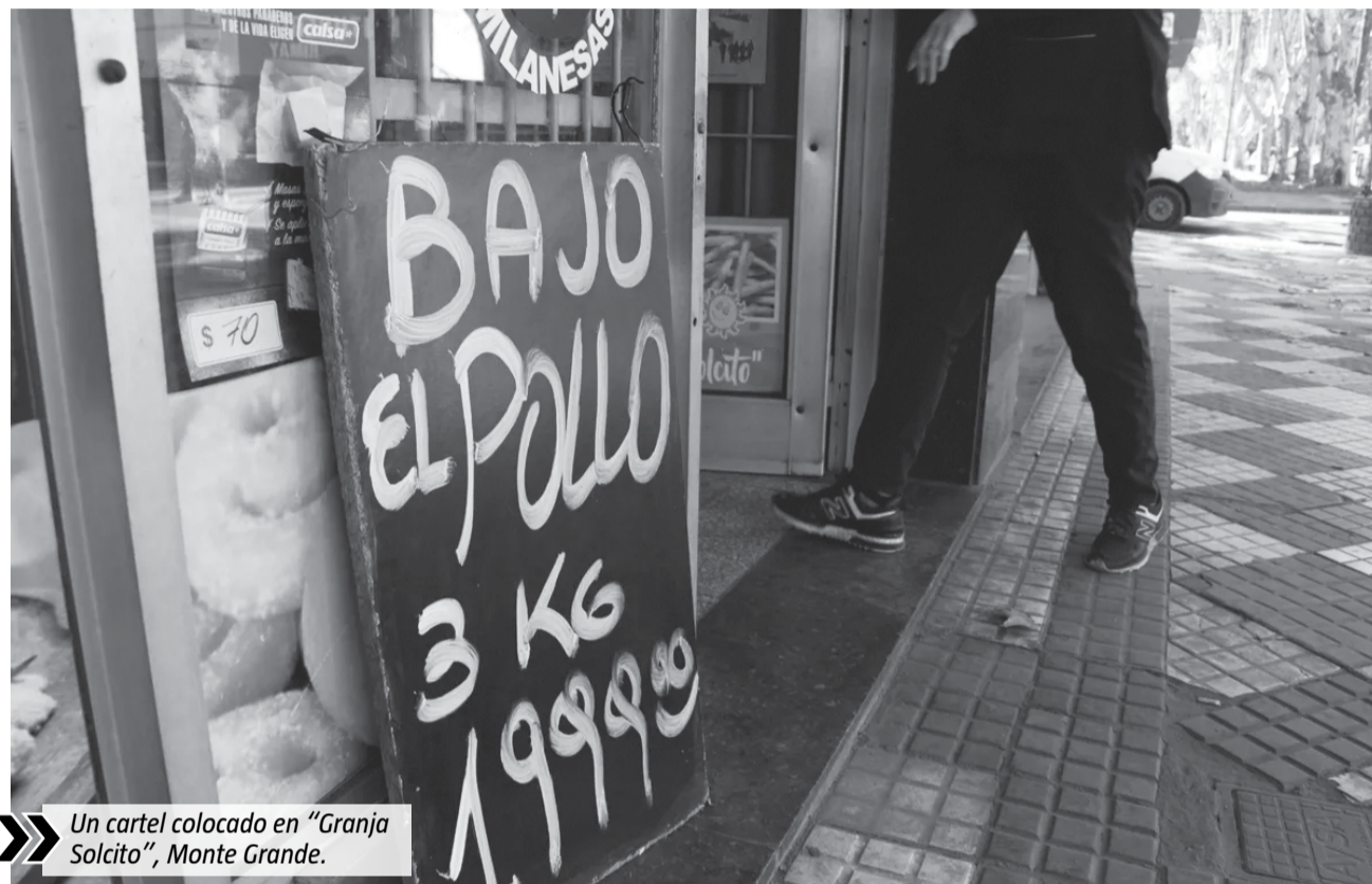
Un cartel colocado en "Granja Solcito", Monte Grande.

"La venta acá en el barrio se mantiene más o menos pareja. Obviamente que cuando aumentó mucho la gente compraba 1 kilo en lugar de dos, o directa-