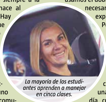
La mayoría de los estudiantes aprenden a manejar en cinco clases.

cambio, te clavan el freno cuando ven algún colectivo o auto medio cerca. Ahí usamos el doble comando, cuando es necesario frenar o embragar”, explicó.