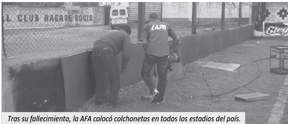
Tras su fallecimiento, la AFA colocó colchonetas en todos los estadios del país.