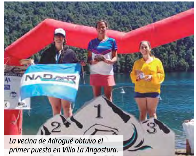
La vecina de Adrogué obtuvo el primer puesto en Villa La Angostura.

“Tuve a mi hijo y ahora retomé mis entrenamientos, pero no en forma tan profesional. Las prioridades cambian y a los 50 años es difícil mantener un nivel tan alto, pero hago lo que me apasiona”, aseguró la vecina de Adrogué. Y concluyó: “Son muchísimas las carreras que llevo grabadas en mi historia y en mi memoria”.