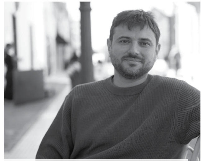
Juan Grabois habló de su voluntad de ser presidente en 2027.

El dirigente Juan Grabois mencionó sobre sus ambiciones electorales en una entrevista radial y dijo que pretende “ser presidente en tres años y medio”.