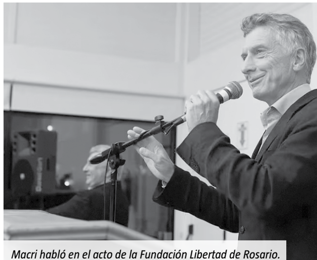
Macri habló en el acto de la Fundación Libertad de Rosario.

El ex presidente Mauricio Macri habló sobre Javier Milei en un acto que se realizó en Rosario: “La sociedad votó a alguien ajeno al sistema político, es un verdadero outsider. Es él, su hermana y las redes sociales”