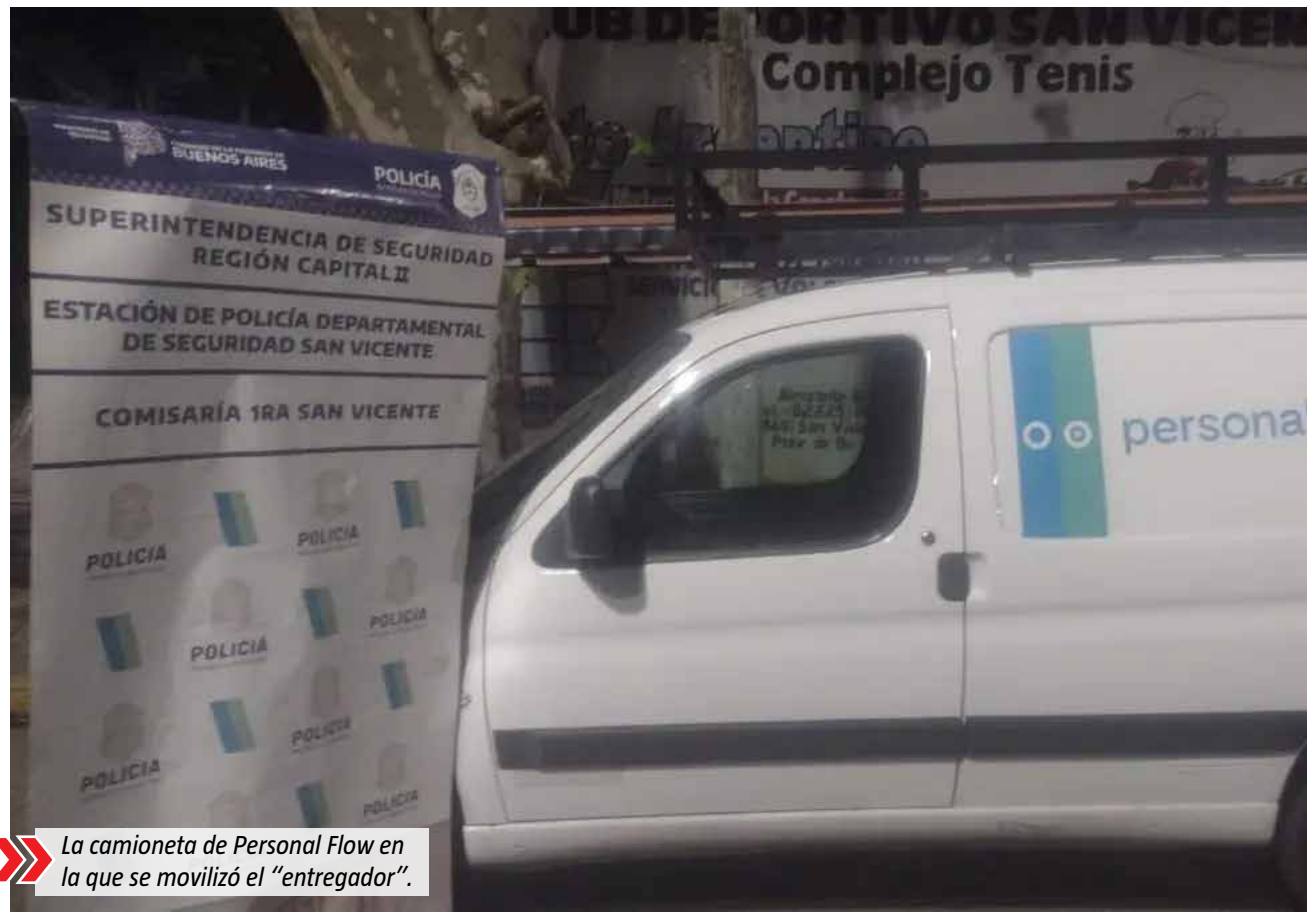
La camioneta de Personal Flow en la que se movilizó el "entregador".

Posteriormente se realizó un allanamiento. Allí, la policía secuestró otros 400 mil pesos en efectivo, y diferentes vehículos como un Peugeot Partner y dos Fiat Mobi, de los cuales uno también tenía un pedido de secuestro activo. Además, encontraron un equipo de comunicación Handy Motorola y un barral portaequipo.