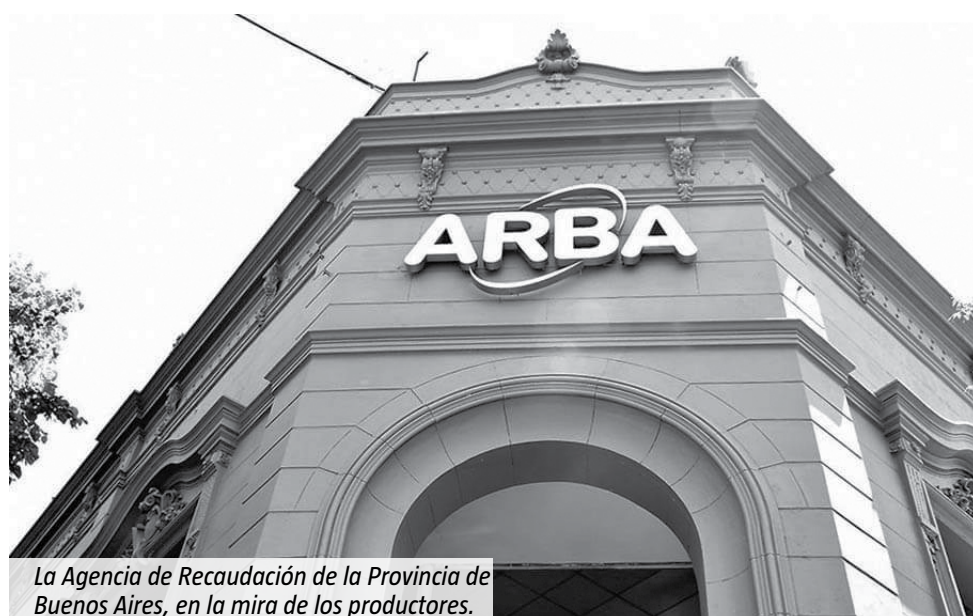
La Agencia de Recaudación de la Provincia de Buenos Aires, en la mira de los productores.