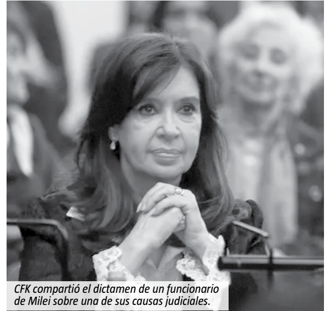
CFK compartió el dictamen de un funcionario de Milei sobre una de sus causas judiciales.