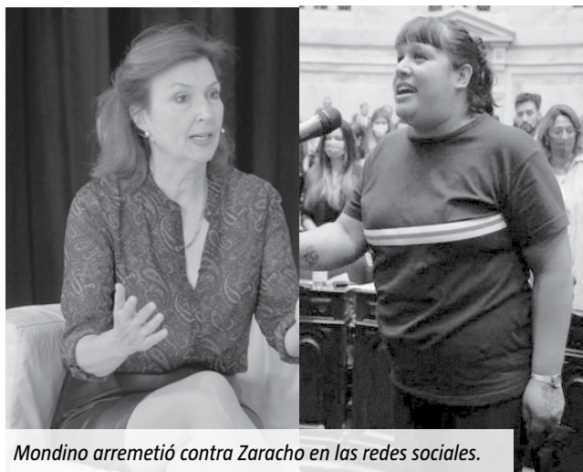
Mondino arremetió contra Zaracho en las redes sociales.

La canciller Diana Mondino mantuvo un fuerte cruce en las redes sociales con la diputada nacional Natalia Zaracho, del espacio de Juan Grabois tras la respuesta que la cartonera le había hecho a un periodista.