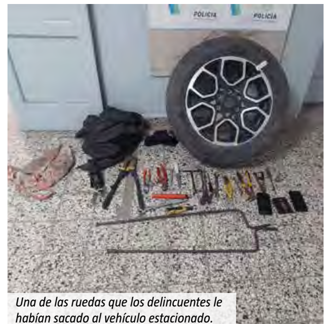
Una de las ruedas que los delincuentes le habían sacado al vehículo estacionado.

La Policía actuó con rapidez, logró encontrar a los