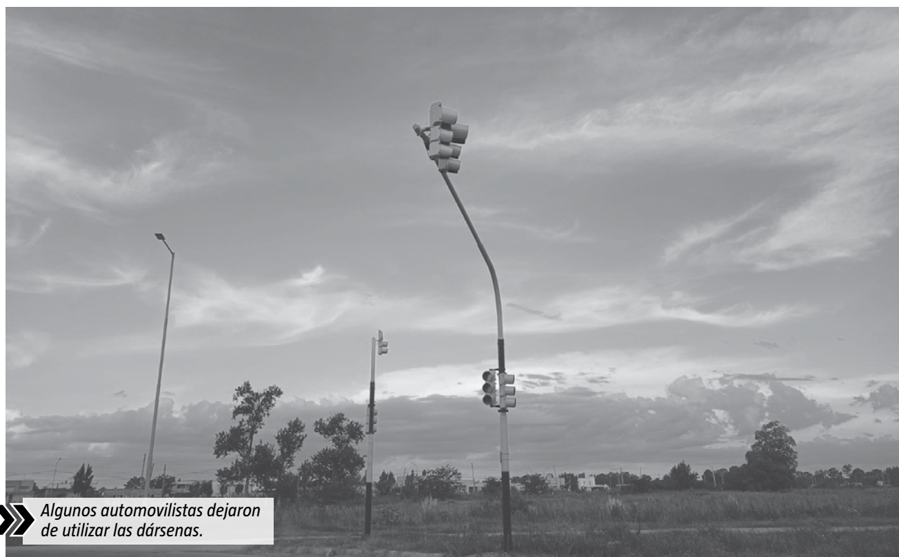
Algunos automovilistas dejaron de utilizar las dársenas.

La serie de semáforos y colectoras que comunican a la Ruta 58 con el acceso a San Vicente por Rivadavia empezaron a funcionar en abril de 2023, cuando se