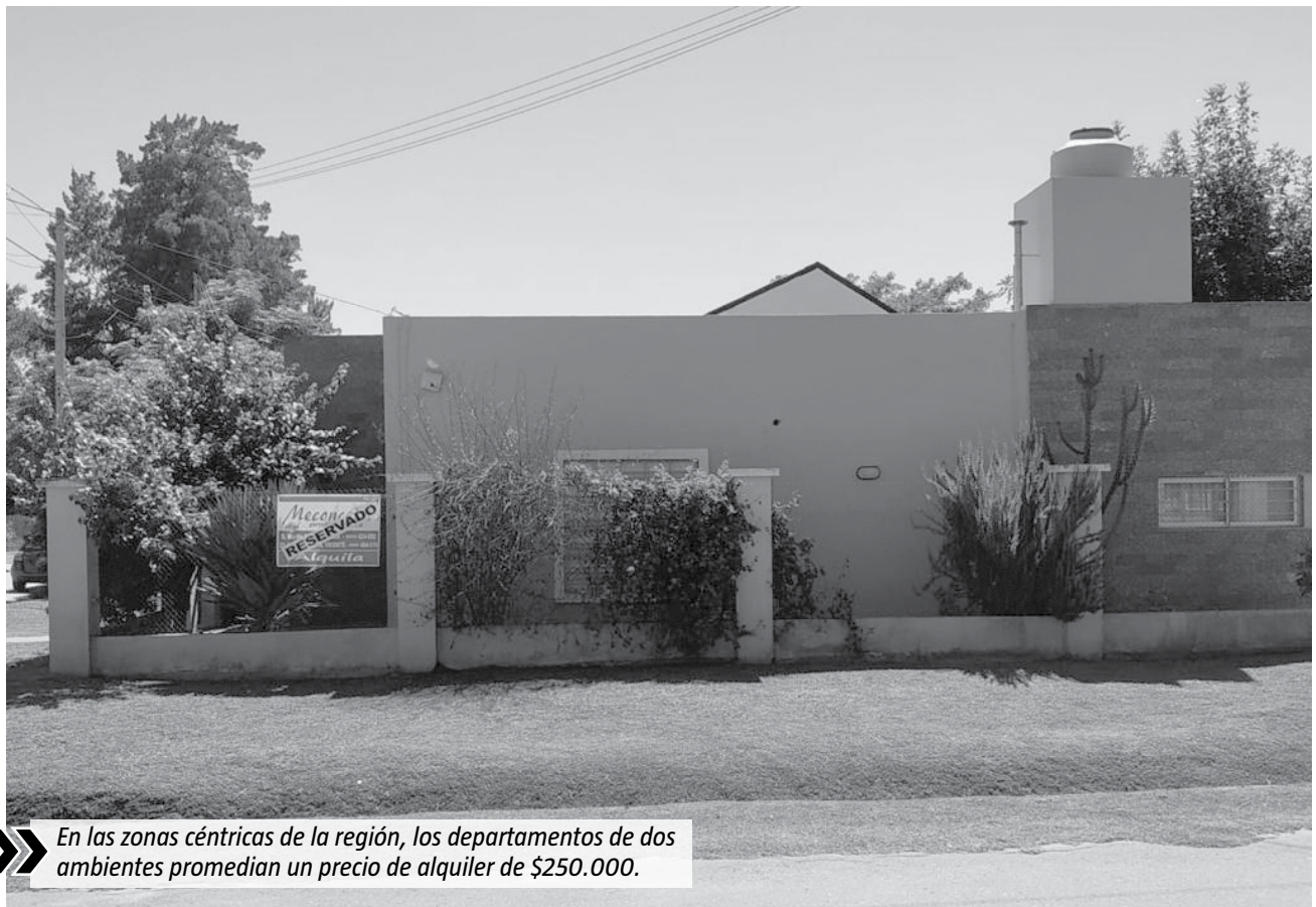
En las zonas céntricas de la región, los departamentos de dos ambientes promedian un precio de alquiler de $250.000.