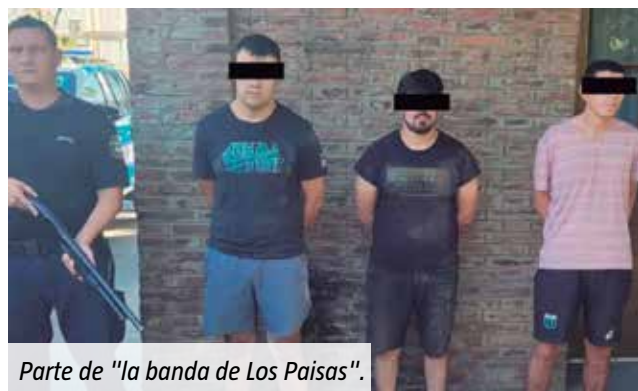
Parte de "la banda de Los Paisas".

El hecho ocurrió entre las calles Sargento Cabral y Asamblea, en la zona del barrio Villa Coll. Allí, los efectivos policiales interceptaron a los criminales, quienes al verlos efectuaron una serie de disparos de arma de fuego contra los uniformados. La policía también disparó y uno de los malvivientes recibió un tiro en la pierna derecha. Fue asistido por la ambulancia y se encuentra fuera de peligro. Finalmente, la policía logró