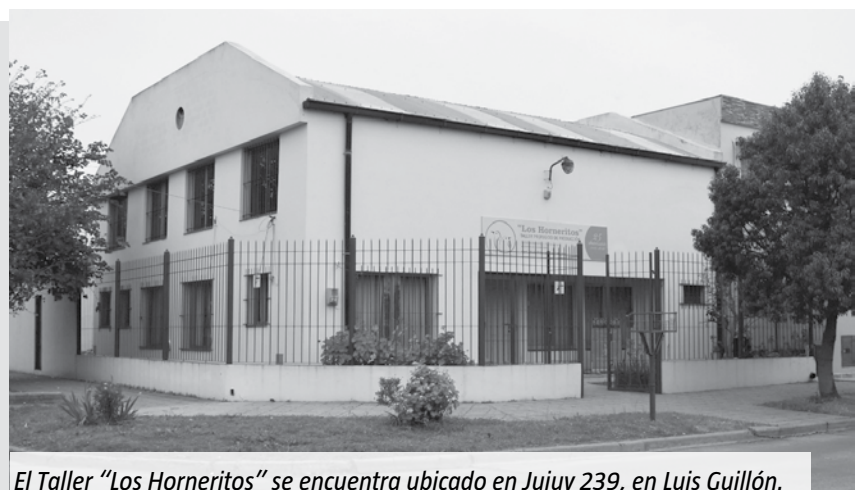
El Taller "Los Horneritos" se encuentra ubicado en Jujuy 239, en Luis Guillón.