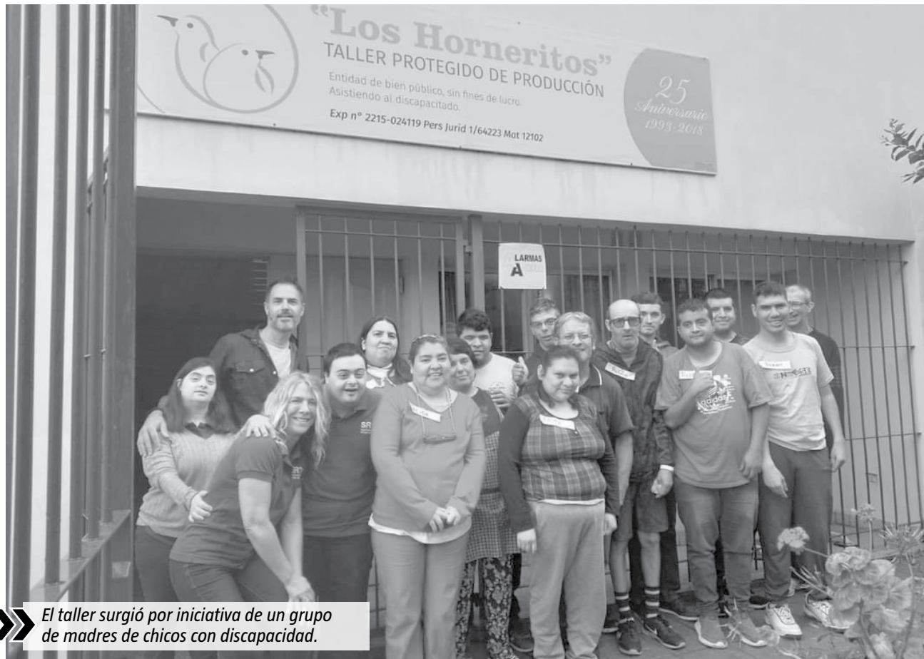
El taller surgió por iniciativa de un grupo de madres de chicos con discapacidad.

Es por esto que desde la organización tomaron la decisión que lanzar una "campaña de socios".