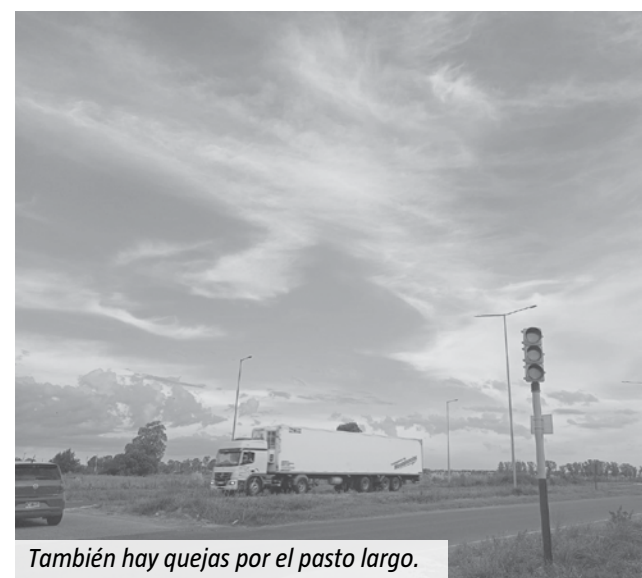
También hay quejas por el pasto largo.

en 2021 y el año pasado empezó a deteriorarse y se hicieron trabajos de bacheo. Ahora, nuevamente reaparecieron los pozos. A simple vista se nota que los baches son "erupciones" del asfalto, que surgen desde la banquina. Hay unos seis, todos ubicados en la mano que va hacia el centro de San Vicente. Además de los pozos consumados, hay varios sectores en los que se ve que el pavimento empieza a levantarse.