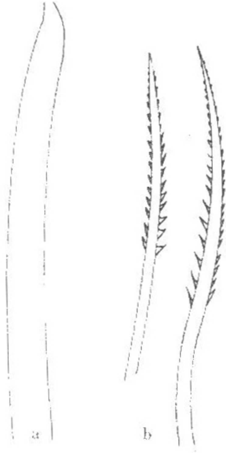
图 98 澳洲鳞沙蚕