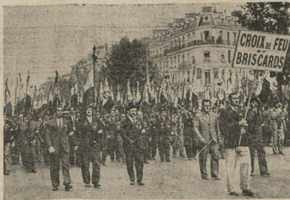
Eski "Ateş haç", cemiyeti azâları Paris sokaklarında nümayiş yaparlarken