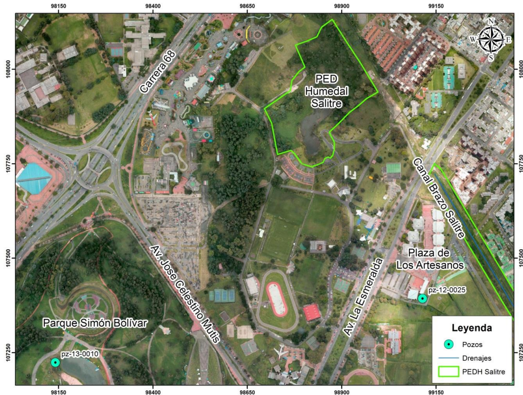
MAPA 3: UBICACIÓN PHD HUMEDAL SALITRE