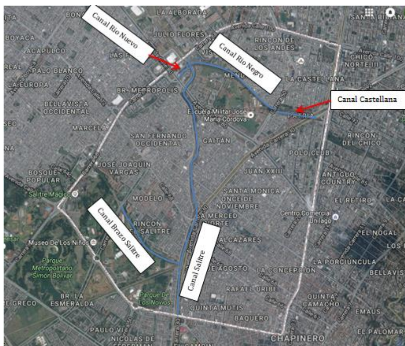
MAPA 2: CANALES LOCALIDAD BARRIOS UNIDOS

El canal de Río Negro se inicia en la carrera séptima con calle 88. Luego de recibir los colectores de agua lluvias de los cerros orientales, que conducen aguas del canal limitante del Chico, sigue por la calle 88 hacia el occidente y recibe a la altura de la carrera 30, los aportes del canal de La Castellana para verterlas a El Salitre, aguas arriba de la carrera 68, frente a Entrerríos; al igual que el canal del río Nuevo, se ve afectado por el deficiente drenaje 10 .