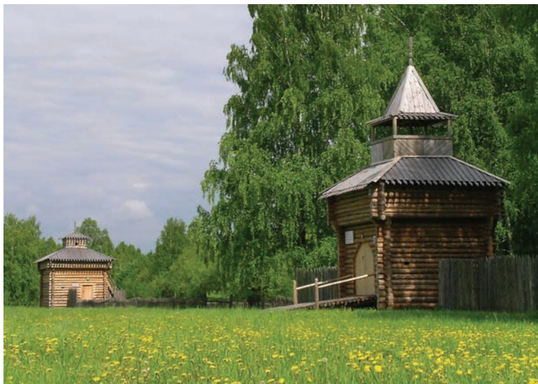
Рис. 4. Реконструкция башен острога экомuzeя «Тюльберский городок».

В выставочном павильоне на территории учебного центра КемГУ был оборудован Музей истории Притомья с археологическими находками в витринах и диорамой – интерьерами русской избы и тюльберской юрты. К юго-западу от городища вниз по течению Томи на береговой террасе реконструируются три из девяти раскопанных у д. Порываевки средневековых кургана, воссоздаются надземные и культовые погребальные сооружения народов Западной Сибири. В 50 м к западу от городища при раскопках обнаружены основания нескольких жилищ с очагами эпохи раннего железа, которые также подлежат частичному восстановлению.