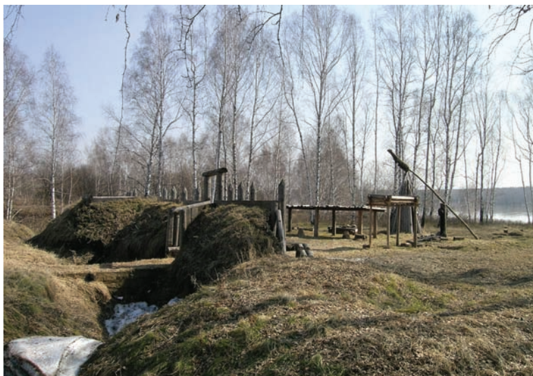
Рис. 3. Городище «Городок».

Пространственное моделирование изначальной структуры позволило представить объекты как часть природно-физического феномена измененной историко-культурной среды. Это создает уникальную визуально-пространственную модель на базе экспонируемого памятника. Остальная часть городища представлена в «натурной консервации» для сохранения первоначального облика памятника. На одном из раскопанных участков с жилищем допустимо сооружение временных защитных навесов. Такой «открытый» показ позволит представить городище как часть рекреационной системы историко-ландшафтного комплекса экомuzeя [Кимеев, 2001а, с. 65].