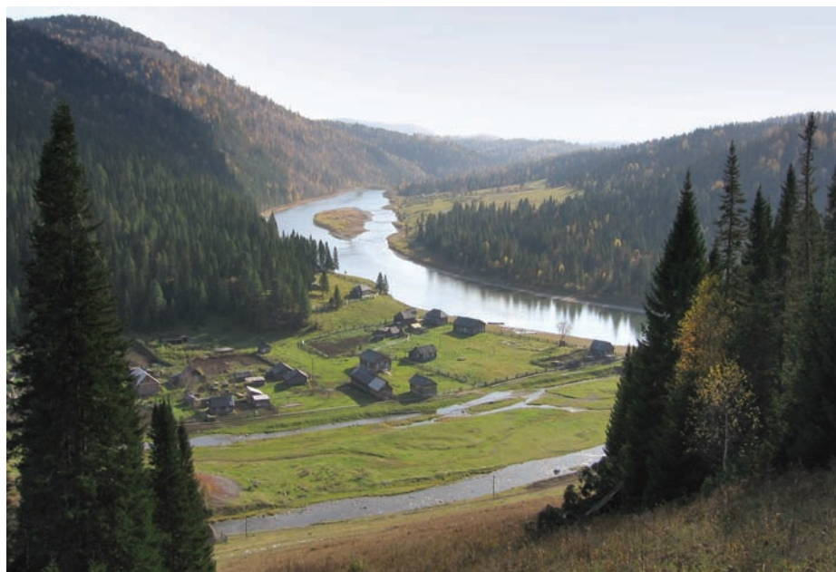
Рис. 1. Экомузей «Тазгол» в Горной Шории.