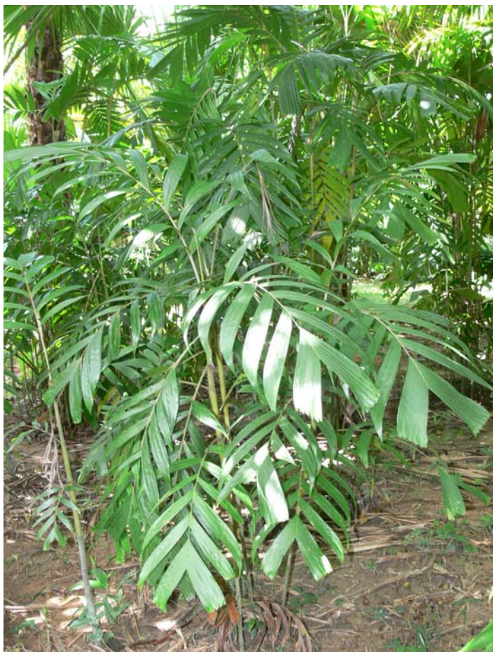
รูปที่ 18.1 หมากลิง

ข้อมูลอื่น หมากลิง เป็นปาล์มในสกุลหมากเจ (Pinanga) ปาล์มในสกุลนี้ทั่วโลกมีอยู่ 125 ชนิด กระจายพันธุ์ในแถบภูเขาหิมาลัย จีนตอนใต้ เอเชียตะวันออกเฉียงใต้ ในไทยพบ 14 ชนิด และพบในป่าพรุ เพียงชนิดเดียว คือ หมากลิง ( P. riparia )