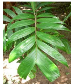
รูปที่ 18 หมากลิง

• ใบ เป็นใบประกอบรูปขนนก เรียงเวียนสลับ แผ่ออก 6 ทาง ขาว 50-80 เซนติเมตร มีใบย่อยด้านละ 6-9 ใบ รูปรีเว้าแคบปลายใบแหลมถึงกว้าง ใบย่อย คู่ปลายรูปหางปลา ปลายตัดและหยัก