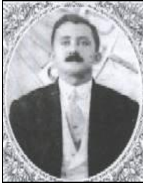
Figura 1: Médico Ophir Pinto de Loyola

Segundo o fascículo Personalidades Históricas do Pará, publicado pelo jornal o Diário do Pará, em 02 de setembro de 2010, o referido médico veio para Belém em 1910, com apenas 24 anos de idade. Nesse período a cidade passava por um período de grande progresso advindo da exploração da borracha. Entretanto, conforme relata a referida publicação “[...] a metrópole da Amazônia também tinha sua face cruel”. Além de imigrantes e desvalidos atraídos pelas promessas de riqueza, epidemias e doenças das mais variadas origens invadiam o espaço urbano de Belém.