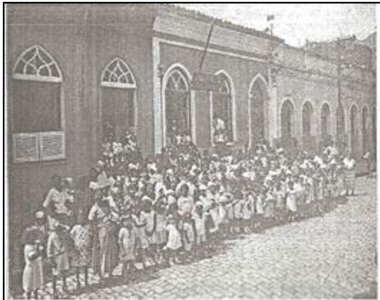
Figura 3: Segunda Sede do Instituto de Proteção e Assistência à Infância do Pará.

A partir de então funcionou em outros locais, a saber: a segunda sede, na Rua 13 de maio (figura 3); já a terceira sede na Av. Nazaré, esquina com a travessa Joaquim Nabuco (figura 4) e a atual na Av. Magalhães Barata (figura 5).