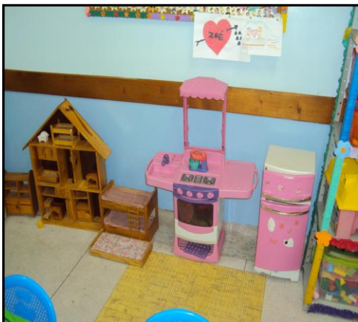
Figura 8: Espaço lúdico construtivo