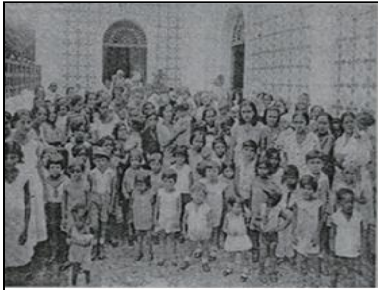
Figura 4: Terceira Sede do Instituto de Proteção e Assistência à Infância do Pará.