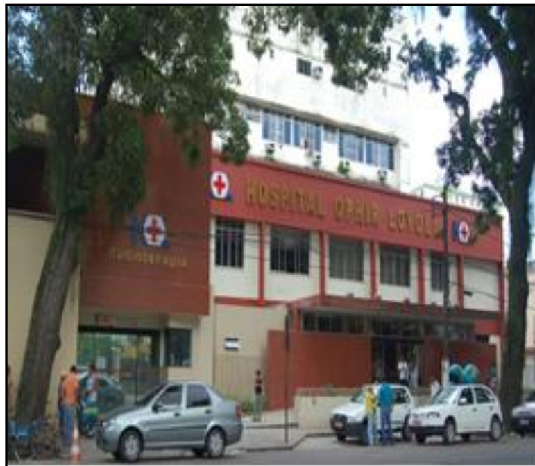
Figura 5: Sede Atual do Hospital Ophir Loyola

Durante os anos iniciais a instituição era mantida por mensalidade dos sócios-fundadores e doações de instituições e pessoas renomadas da época.