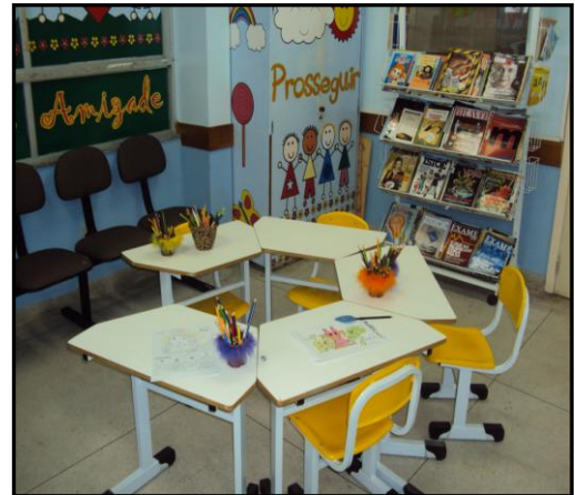
Figura 7: Espaço de pintura e leitura