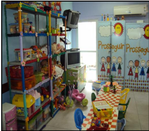
Figura 6: Espaço de brinquedos

acompanhantes. Possui um acervo de 230 brinquedos, dois televisores, um DVD, dois videogames, cinco computadores, um revisteiro. A brinquedoteca funciona de segunda a sexta-feira, no horário de 7 às 17h sob a responsabilidade de uma professora funcionária do HOL e possui espaços para brinquedos (figura 6), para leitura e pintura (figura 7), para o lúdico construtivo (figura 8) e para informática (figura 9).