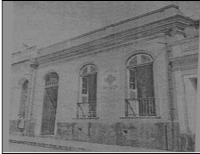
Figura 2: Primeira Sede do Instituto de Proteção e Assistência à Infância do Pará.