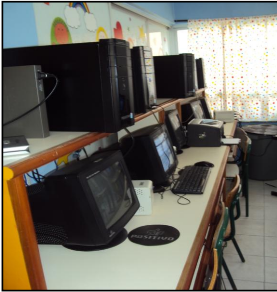
Figura 10: Sala de aula: espaço de informática Educativa.