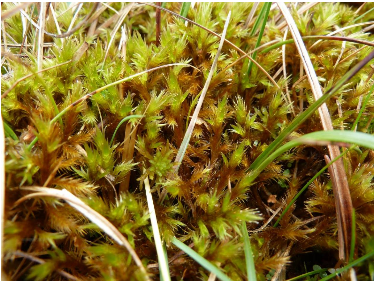
Porost Tomentypnum nitens (PR Chvojnov).