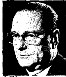
J. Chirac (RPR Corrèze)