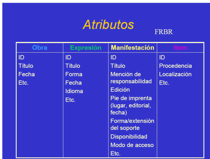
Figura 1 – Atributos de Entidades en FRBR

El segundo componente del modelo FRBR son los atributos o características de las entidades anteriormente mencionadas, los que actualmente han sido denominados como metadatos. Las obras, expresiones, manifestaciones e ítems poseen una serie de atributos, que se muestran en la Figura 1, siendo los más comúnmente conocidos los correspondientes a las manifestaciones.