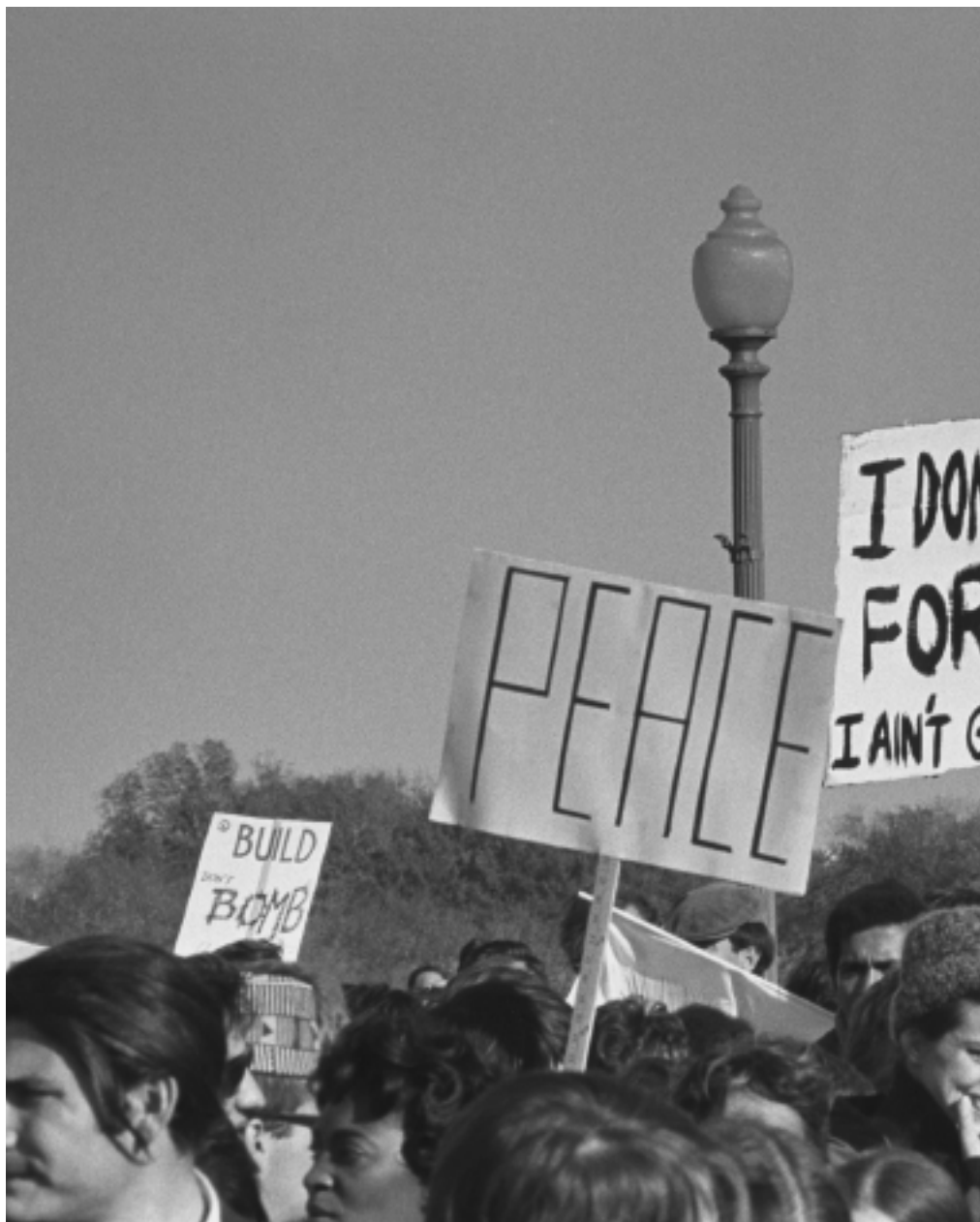
21 oktober 1967: Demonstranten tegen de Vietnamoorlog tijdens de 'Mars naar het Pentagon'