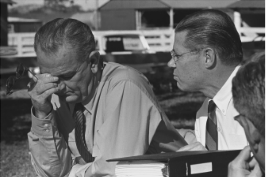
22 december 1964: Minister van Defensie Robert McNamara (rechts) met president Johnson tijdens een vergadering op de LBJ Ranch in Stonewall, Texas

andere burens. Voor hun was het het simpele feit dat ze ons als de nieuwe bezetter zagen, na de Fransen, dat maakte dat ze bleven vechten.” Een inzicht dat niet verhinderde dat “we bijna alsnog met elkaar op de vuist gingen,” de hoge Vietnamese official en hij, dertig jaar na dato.