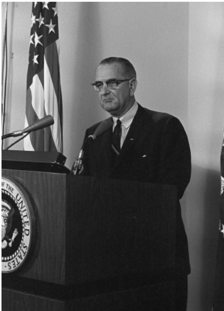
4 augustus 1964: President Lyndon B. Johnson tijdens zijn 'Midnight Address' over het tweede Golf van Tonkin-incident in Vietnam