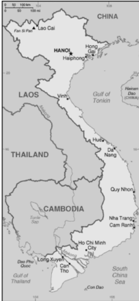
Het huidige Vietnam