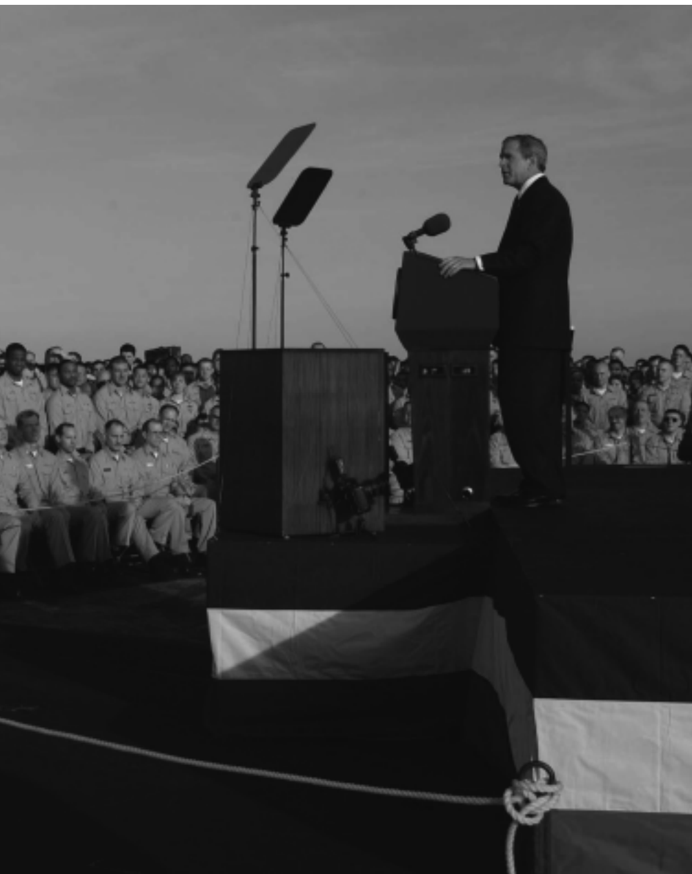
de 'major operations' in Irak afkondigde