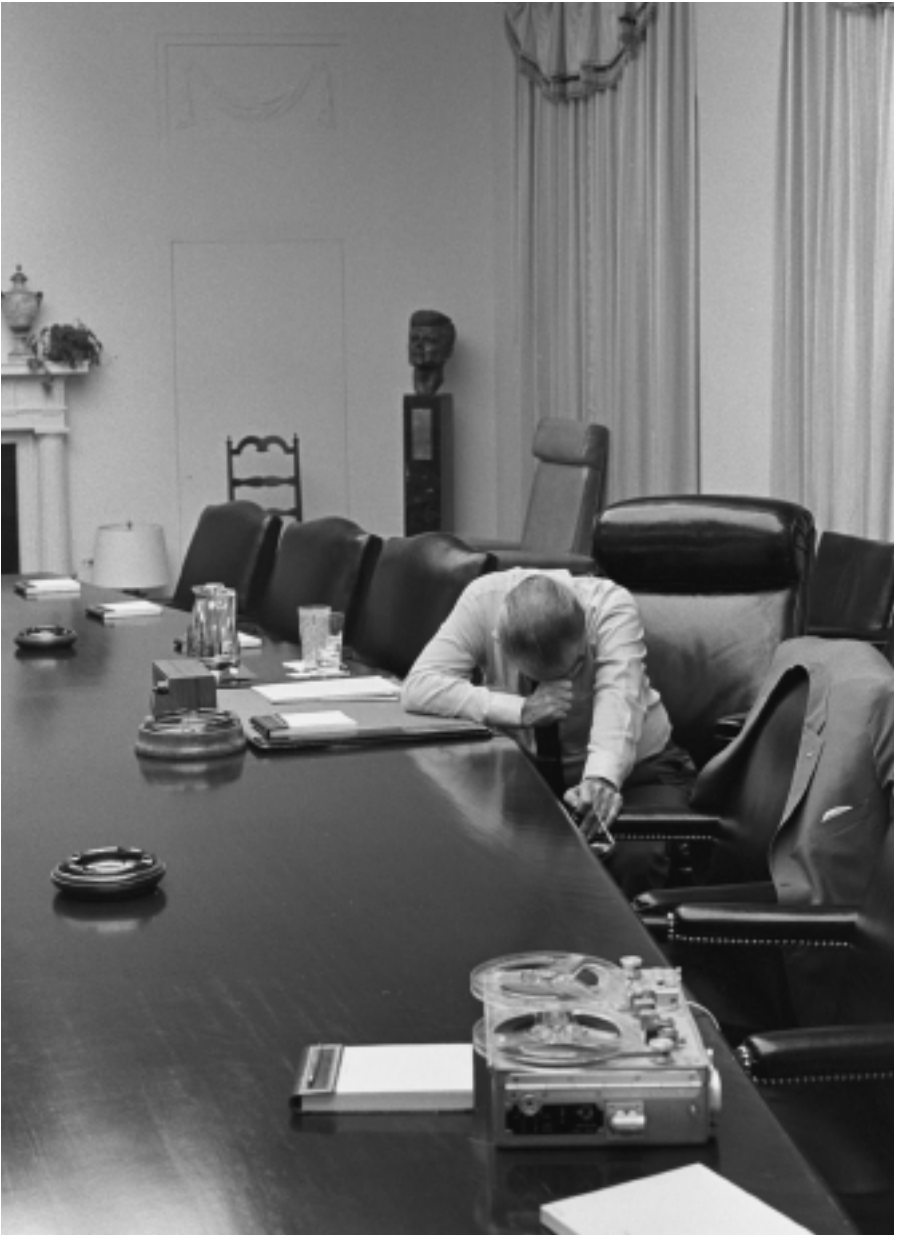
31 juli 1968: President Lyndon B. Johnson luistert naar een bandje dat zijn schoonzoon, kapitein Charles Robb, hem uit Vietnam heeft gestuurd