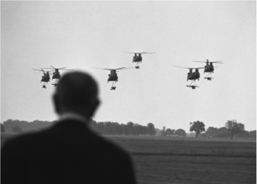
23 juli 1966: President Lyndon B. Johnson kijkt naar helikopters tijdens een oefening op Fort Campbell, Kentucky

Nadat in augustus van dat jaar het Amerikaanse oorlogsschip de Maddox had deelgenomen aan een Zuid-Vietnamese aanval, ondernamen de Noord-Vietnamezen in internationale wateren een tegenaanval op het Amerikaanse flottielje, en brachten één schip tot zinken. Het Amerikaans geduld was op. Senator Russell uit Georgia verklaarde: “De eer van de natie staat op het spel. Wij mogen en zullen niet terugschrikken bij onze verdediging.” Volgens opinieonderzoek was 85 procent het met hem eens. Geopolitiek en ideologie kunnen niet zonder patriotisme. In de Senaat werd de Tonkin-resolutie aangenomen, met twee stemmen tegen. Vliegtuigen stegen op om Noord-Vietnamese militaire installaties te bombarderen. Daarmee was de tocht naar het centrum van het Vietnamese moeras definitief begonnen.