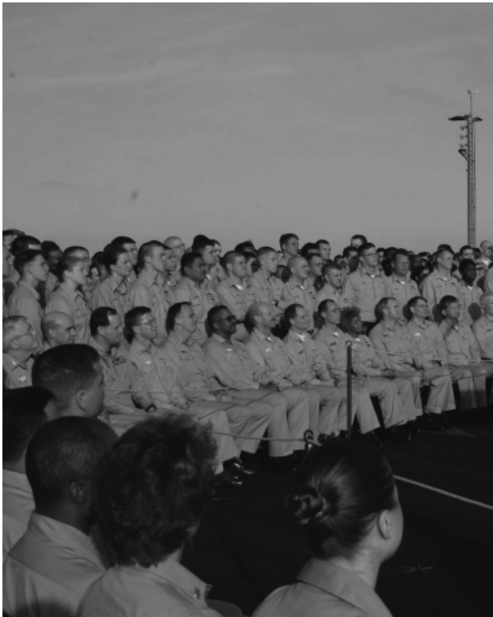
1 mei 2003: President George W. Bush aan boord van de USS Abraham Lincoln waar hij het einde van