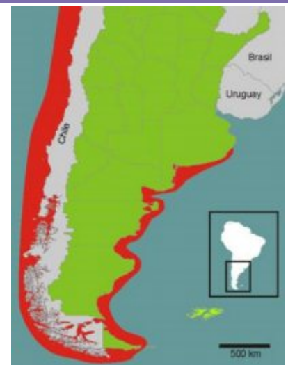
Figura 1. Distribución geográfica de las poblaciones actuales del bivalvo Aulacomya atra en el hemisferio sur (área sombreada). Mapa tomado y modificado de: Gutierrez et al. (2015).

Tomado de: World Register of Marine Species http://www.marinespecies.org/aphia.php?p=taxdet&ails&id=505963