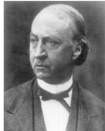
JOHANN BENEDICT LISTING 1808 - 1882

Alemán. Matemático. Nació el 25 de julio de 1808 en Francfort y falleció el 24 de diciembre de 1882 en Göttingen.