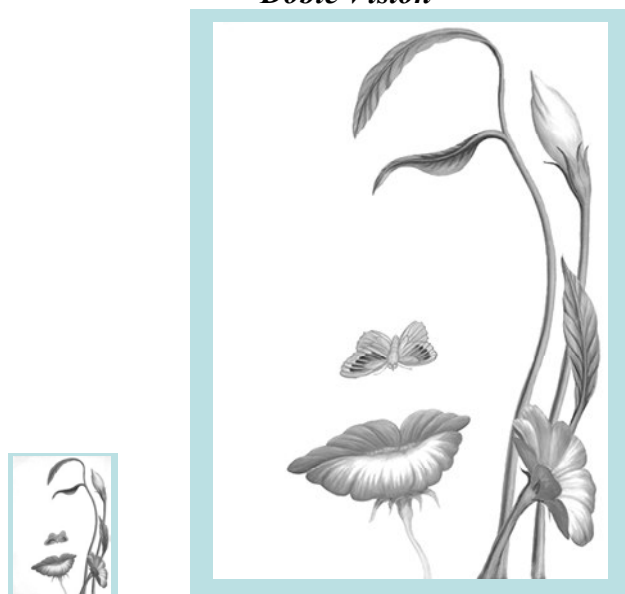
En pequeño, un rostro de mujer. Al ampliar, un hermoso paisaje.