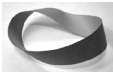
UNA CINTA DE MÖBIUS CONSTRUIDA CON UN TROZO DE PAPEL Y CINTA ADHESIVA.

Era descendiente del reformista religioso Martín Lutero.